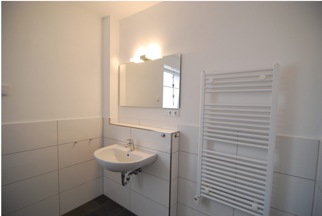
Perlsteinring47 10Grechts Bad2