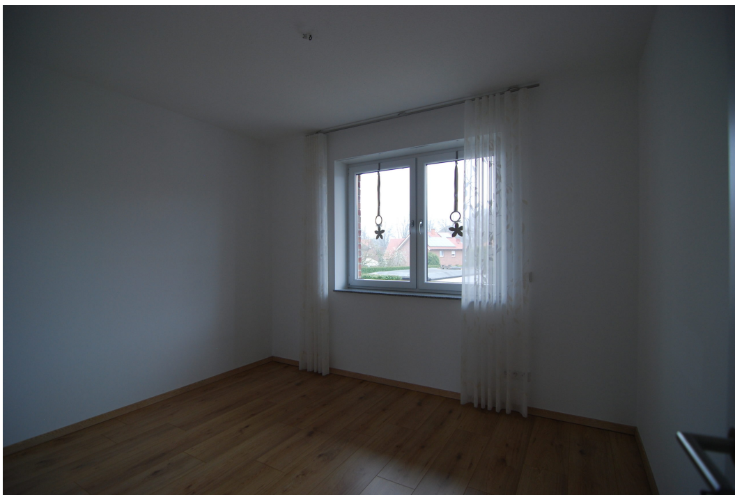
Perlsteinring47 10Grechts Kinderzimmer