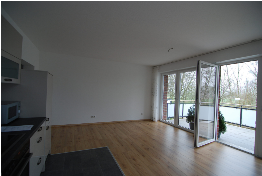
Perlsteinring47 10Grechts Wohnzimmer mit offener Kueche