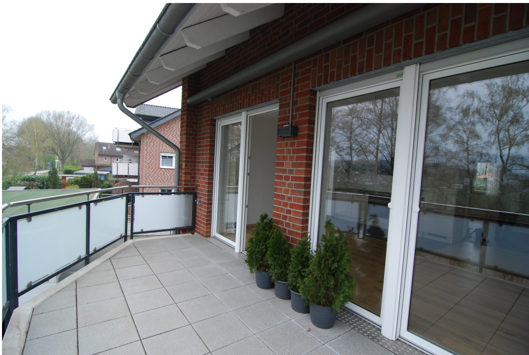
Perlsteinring47 10Grechts Balkon2