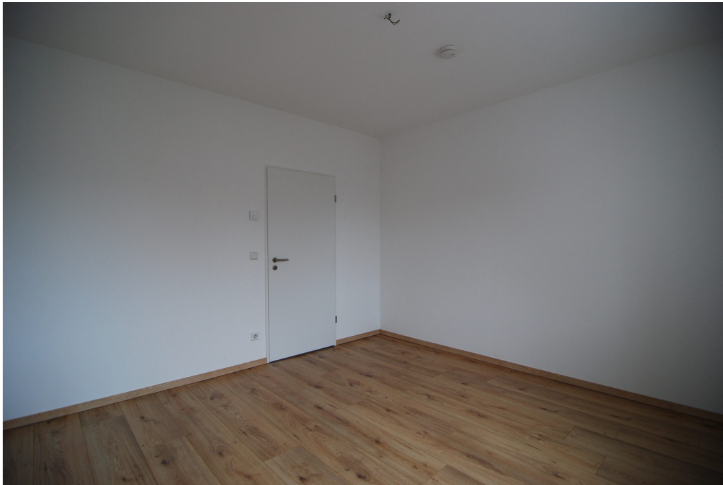
Perlsteinring47 10Grechts Elternschlafzimmer2