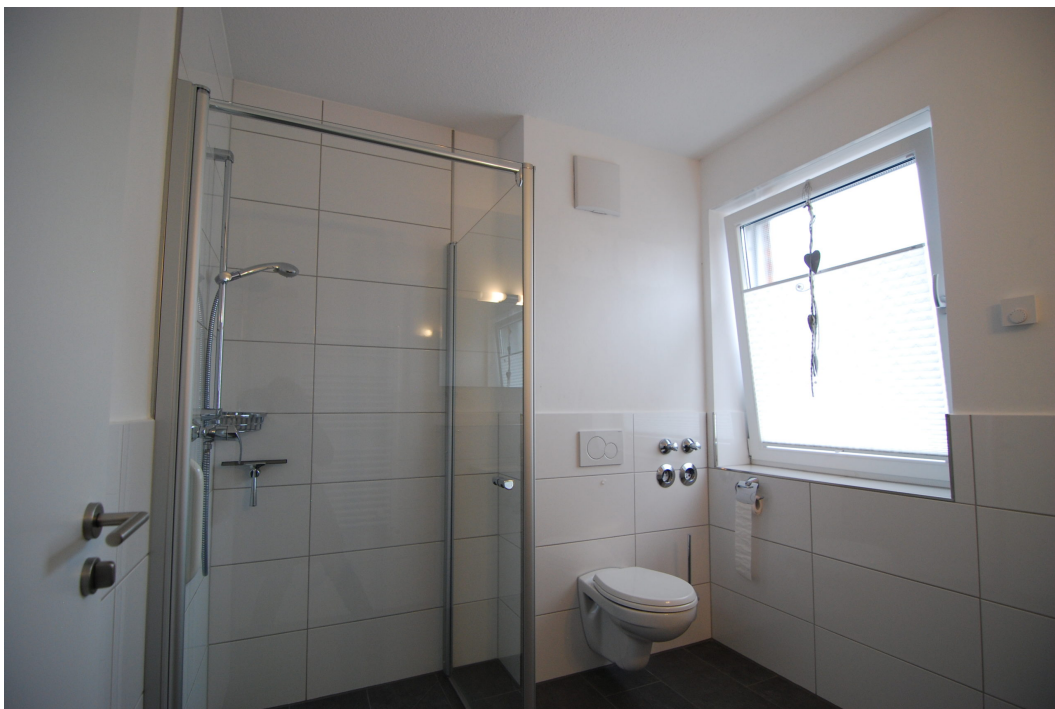
Perlsteinring47 10Grechts Bad3