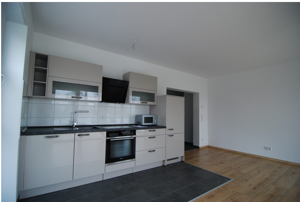
Perlsteinring47 10Grechts Kueche1