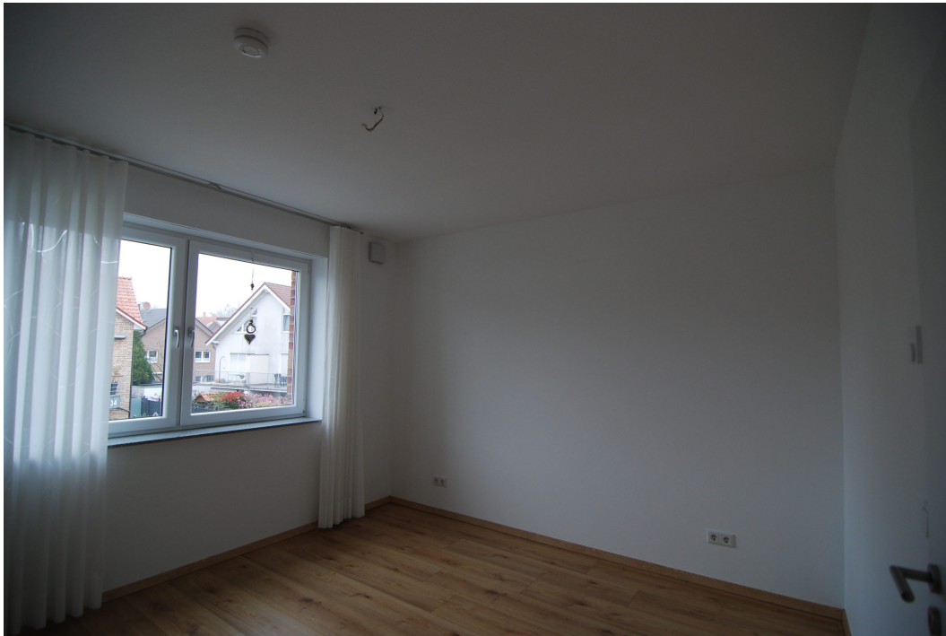
Perlsteinring47 10Grechts Elternschlafzimmer3