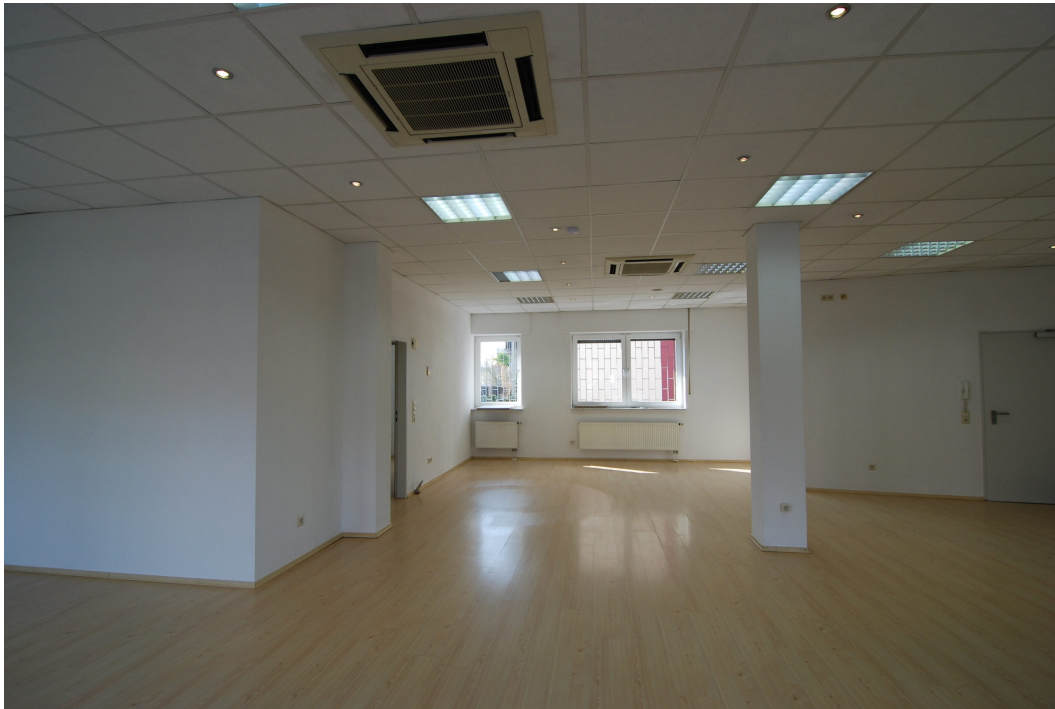
BorkenerStr149 Ladenlokal Bild4