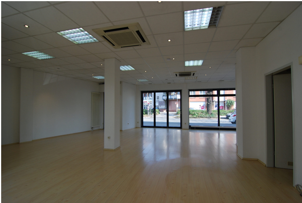
BorkenerStr149 Ladenlokal Bild2