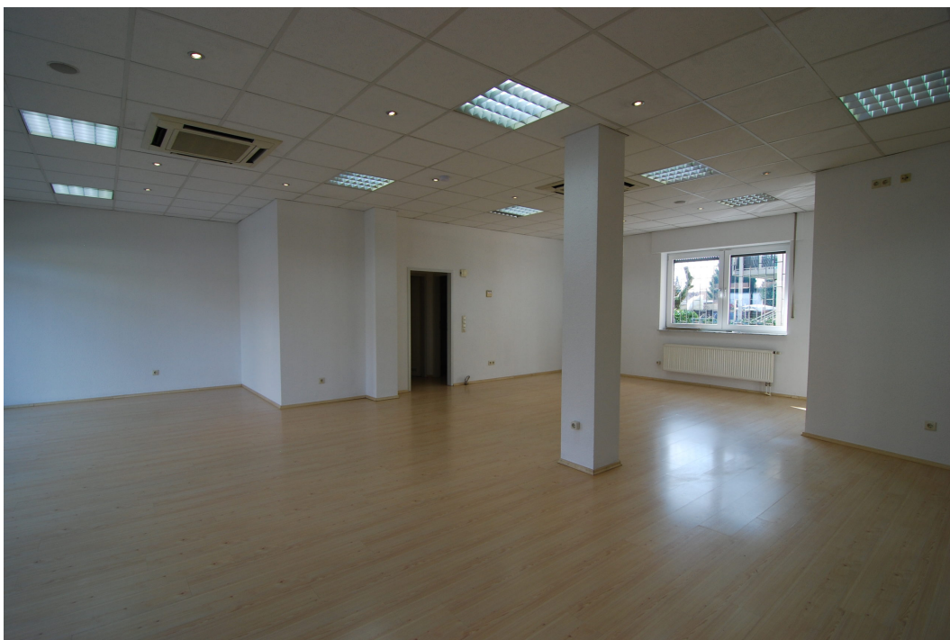
BorkenerStr149 Ladenlokal Bild3