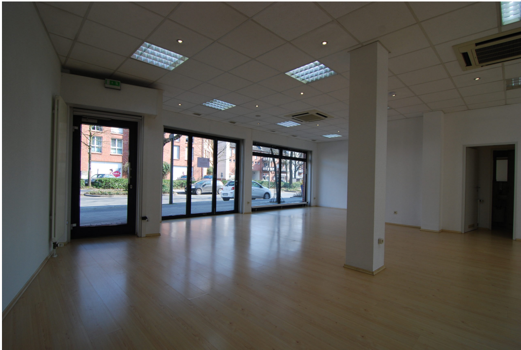
BorkenerStr149 Ladenlokal Bild1