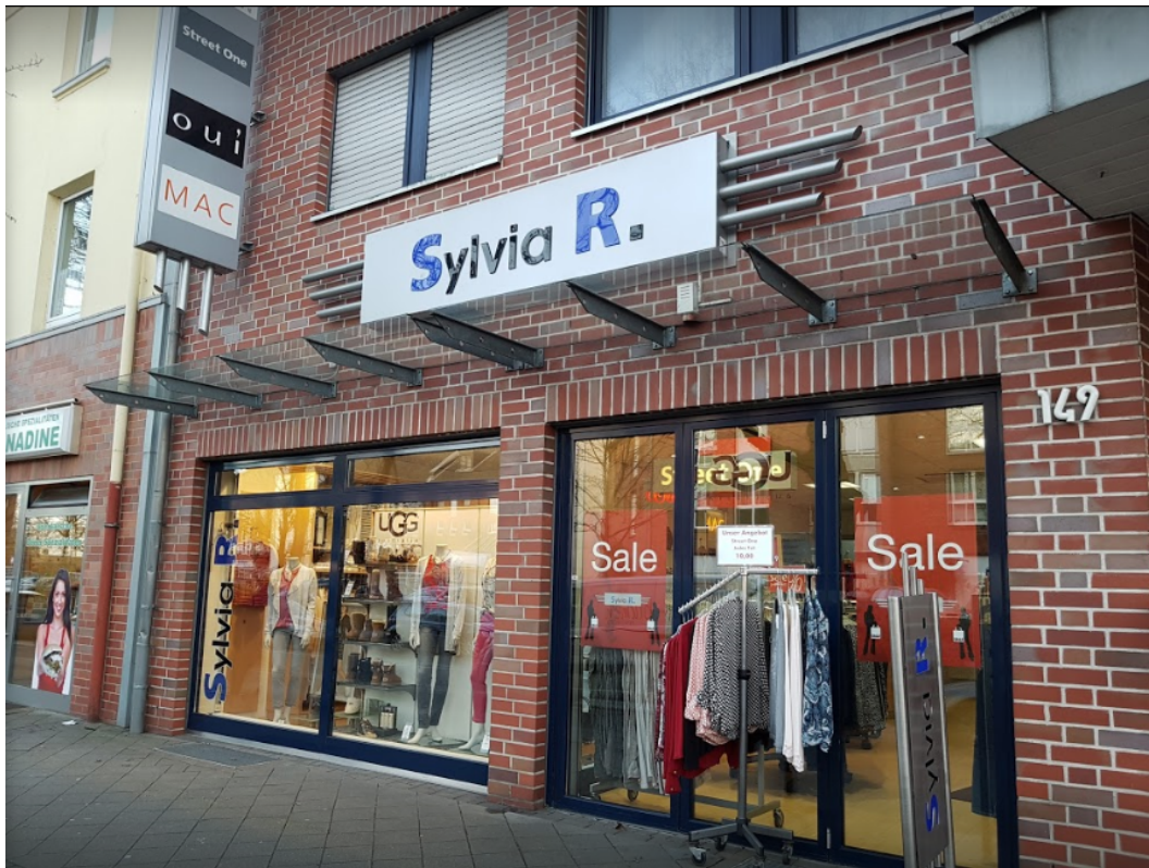
Bild Schaufensterfront Vormieter