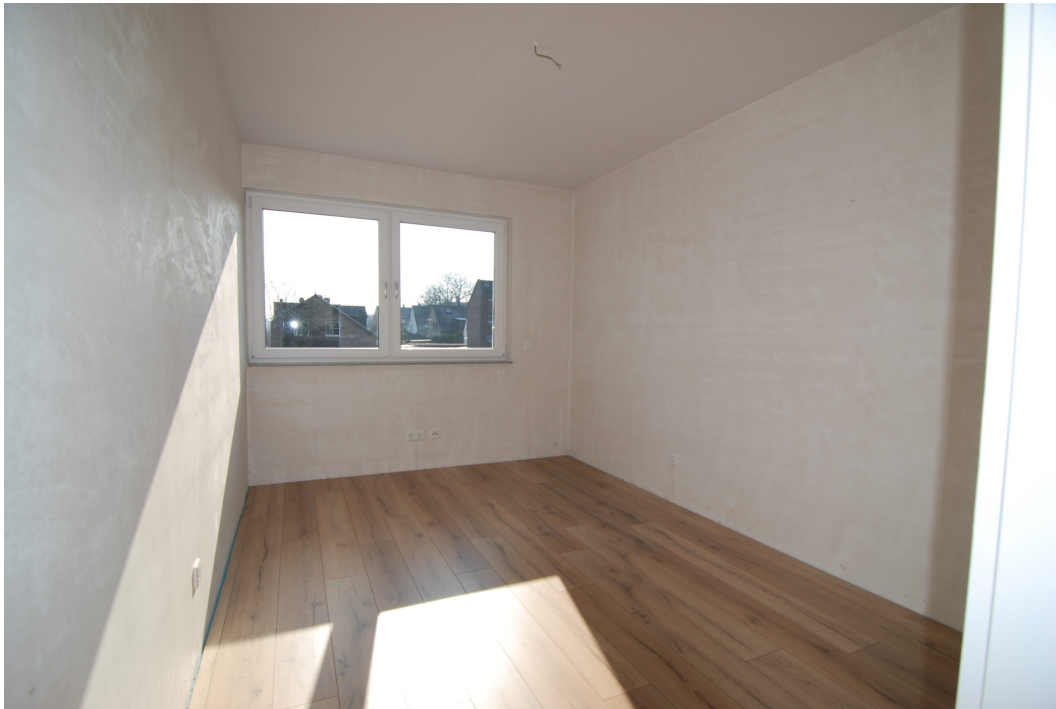
Clemens-August-Strasse85a-c Schlafzimmer 1