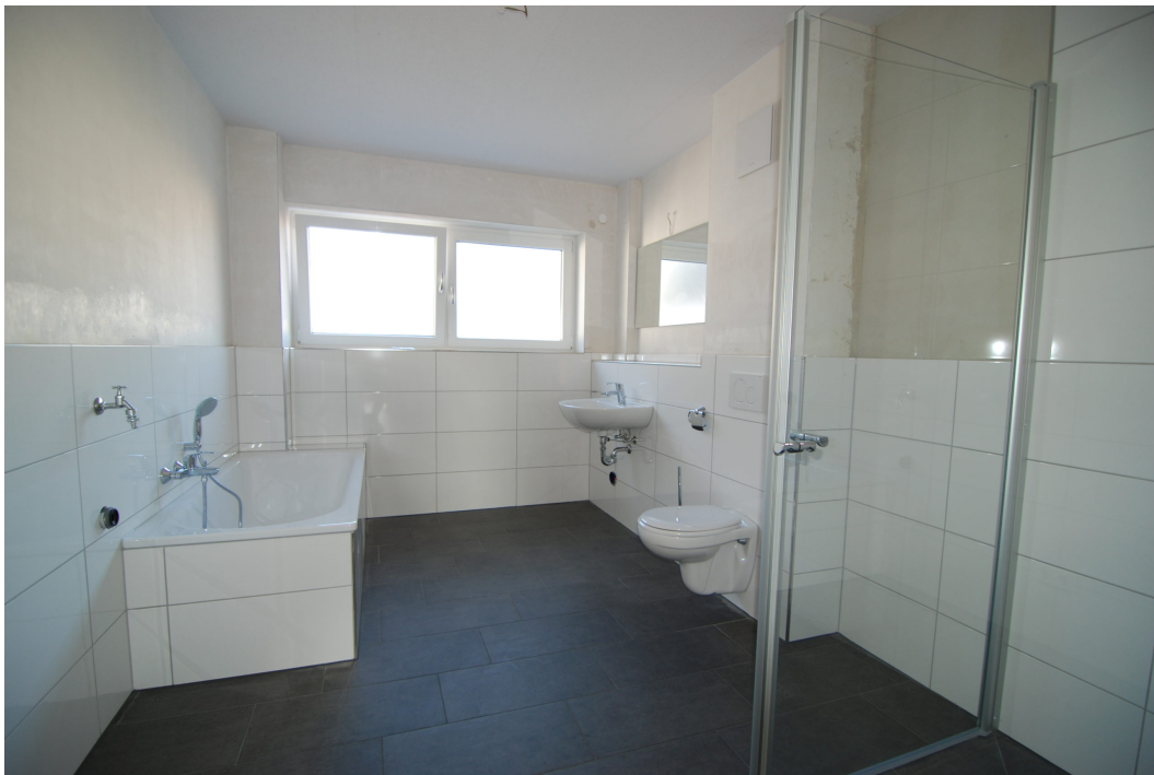
Clemens-August-Strasse85a-c BadOG 1