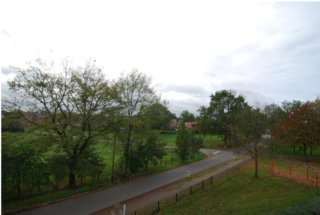
AnderVogelstange29 DGMitte BlickinsGruene2