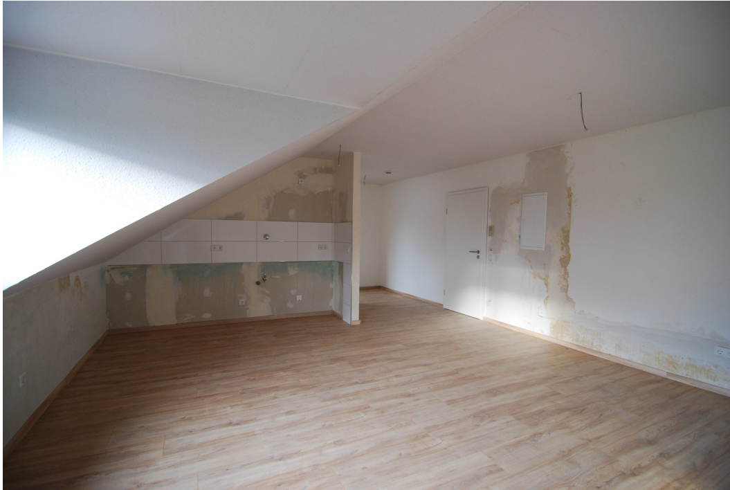
AnderVogelstange29 DGMitte WohnzimmerKuehce3