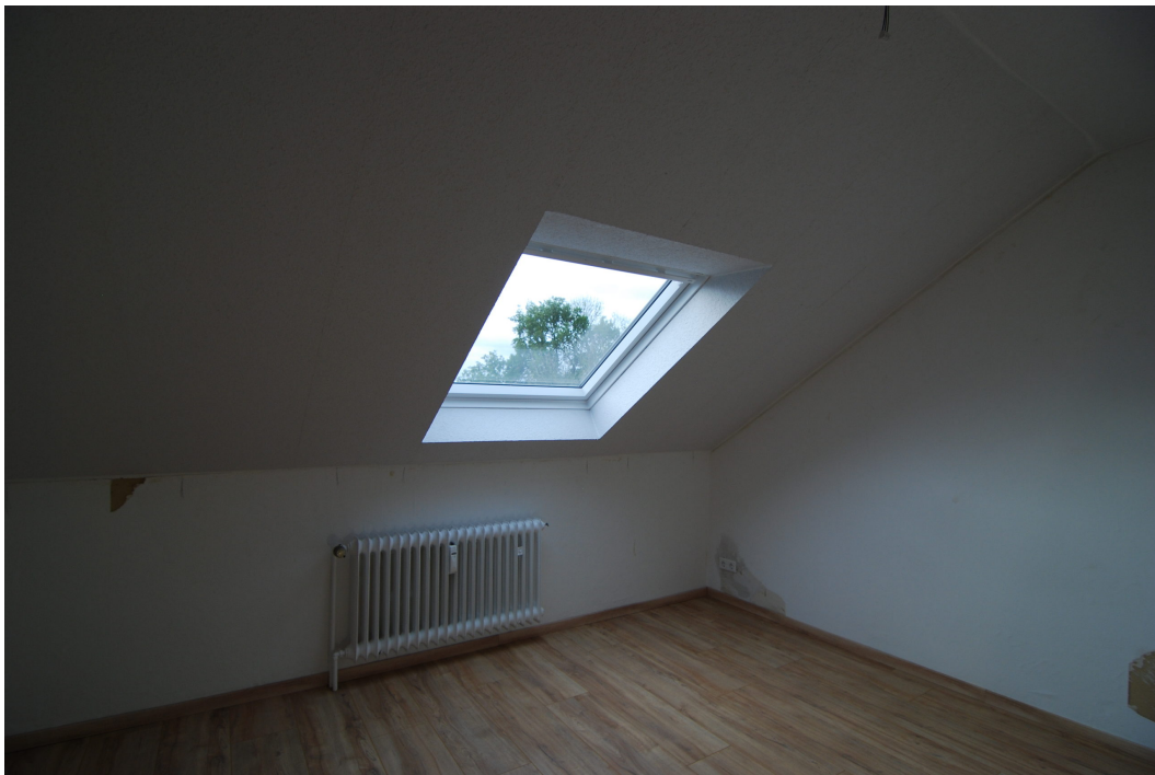
AnderVogelstange29 DGMitte Schlafzimmer 1