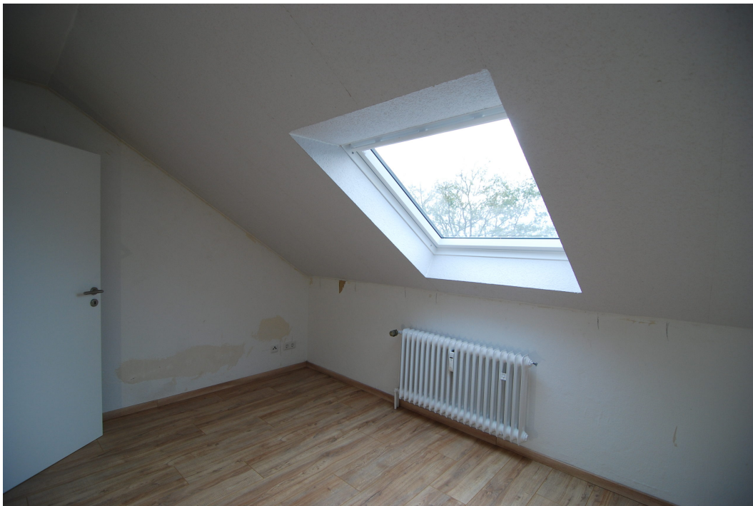
AnderVogelstange29 DGMitte Schlafzimmer 2