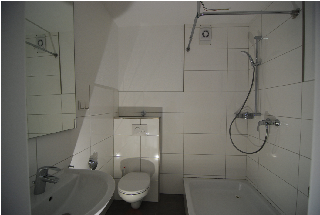
AnderVogelstange29 DGMitte Bad 1