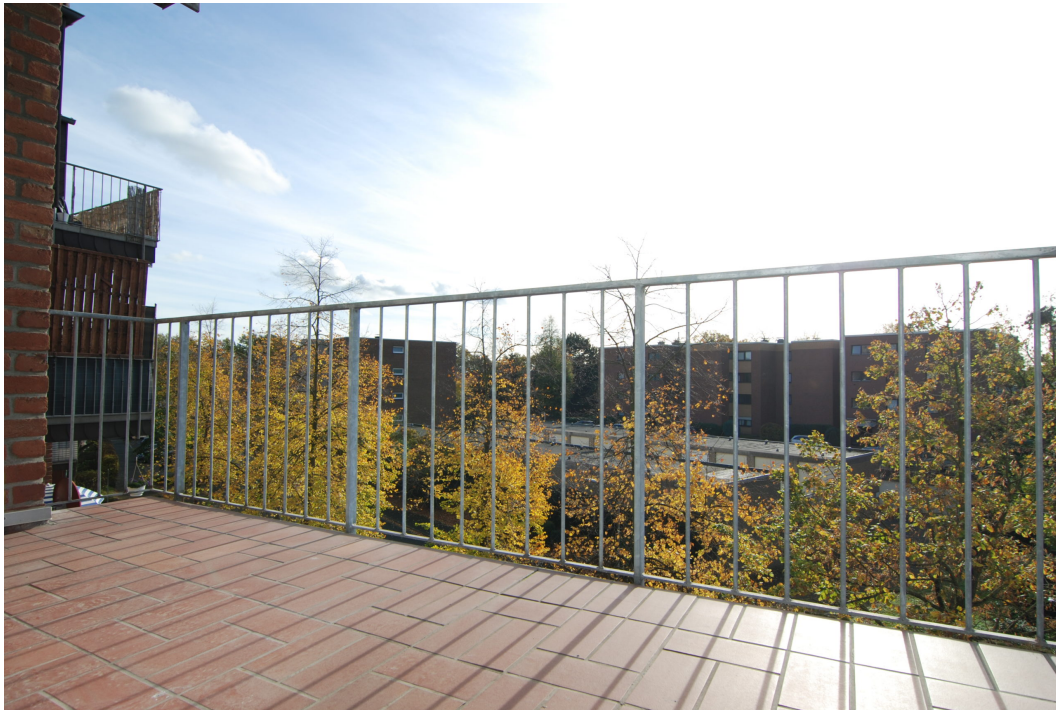
HalternerStr14 2OGMitte Balkon 2