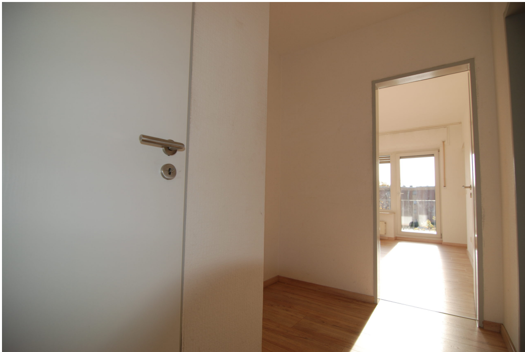
HalternerStr14 2OGMitte Flur 3