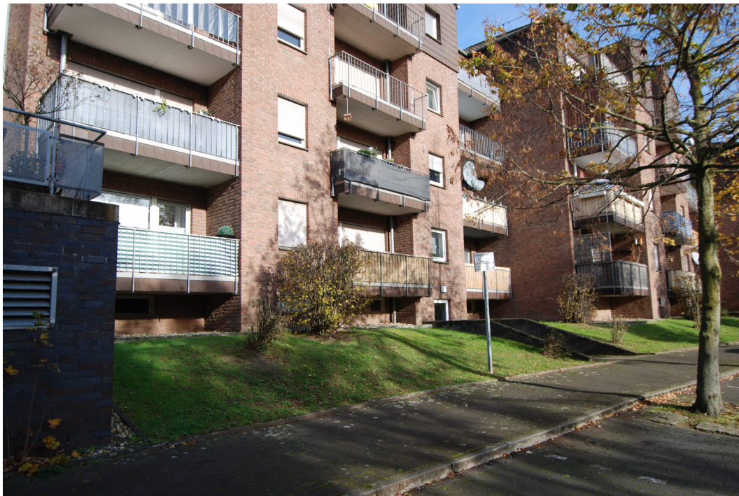
HalternerStr14-18 Rueckseite 1