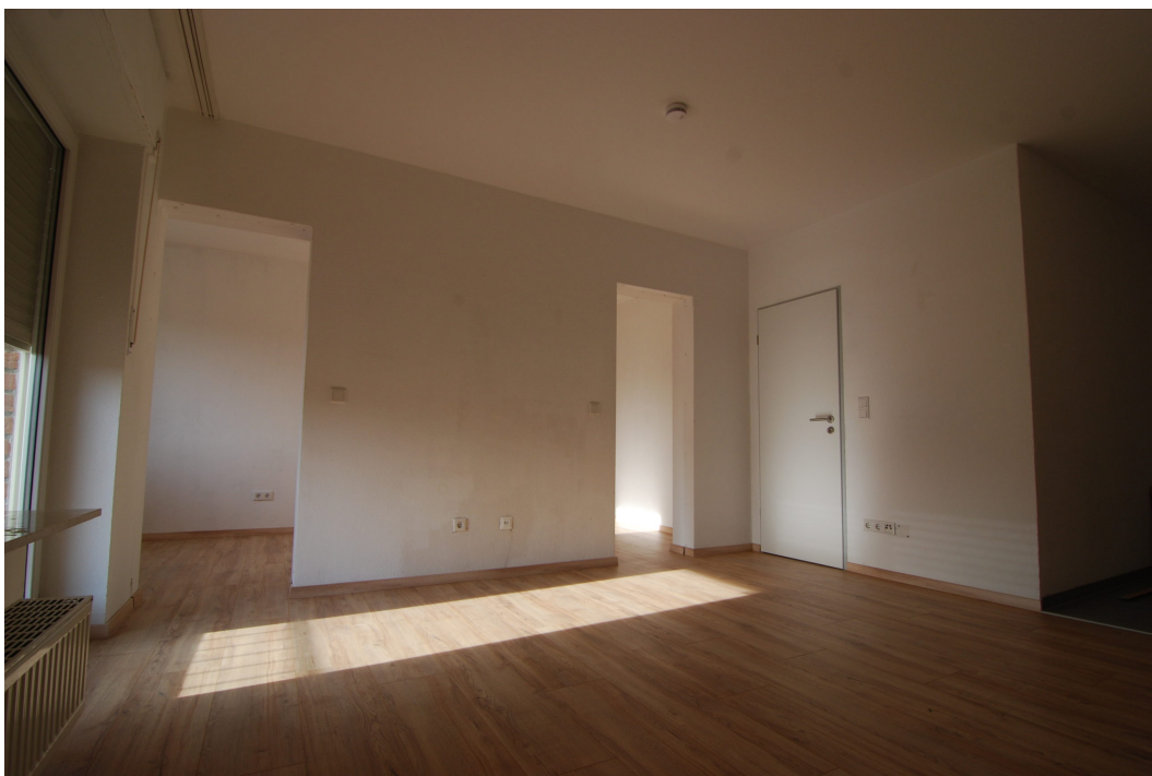
HalternerStr14 2OGMitte Wohnzimmer 1