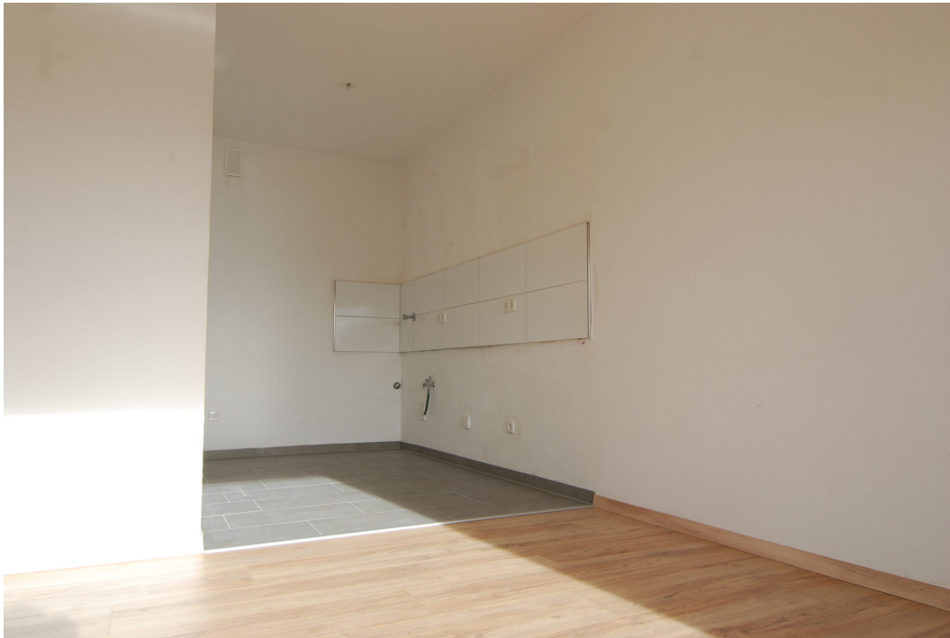
HalternerStr14 2OGMitte Kueche 1