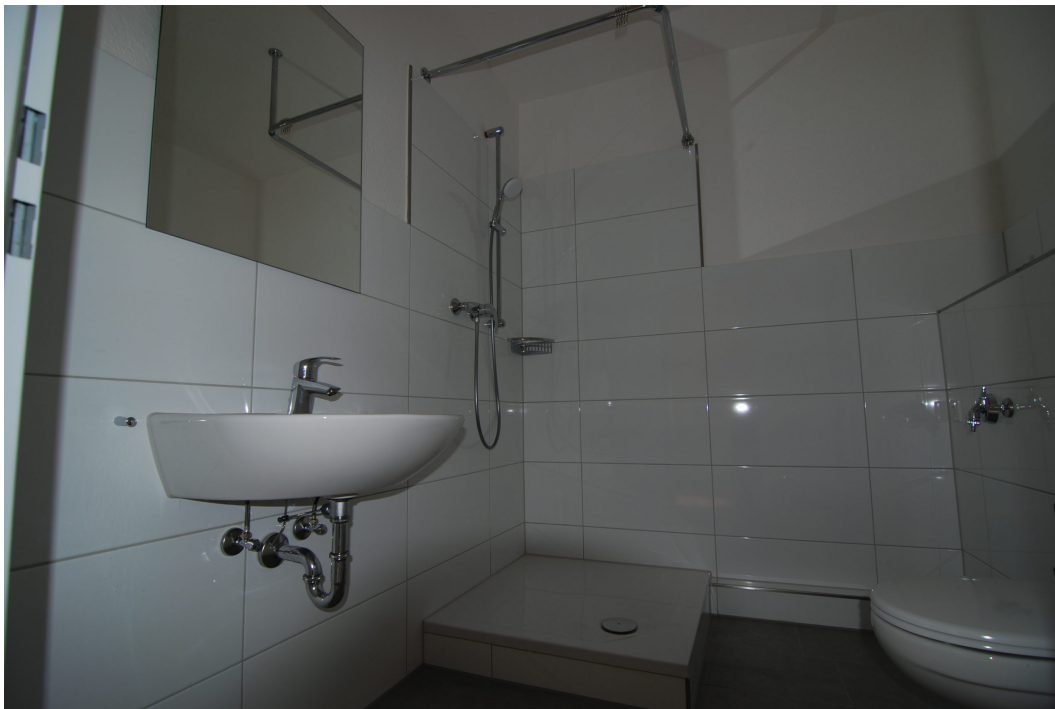
HalternerStr14 2OGMitte Bad 3