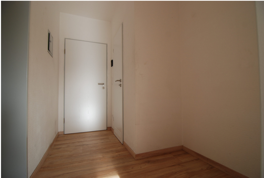
HalternerStr14 2OGMitte Flur 2