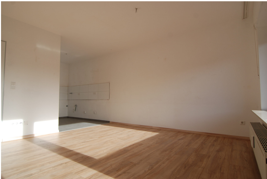
HalternerStr14 2OGMitte Wohnzimmer 3