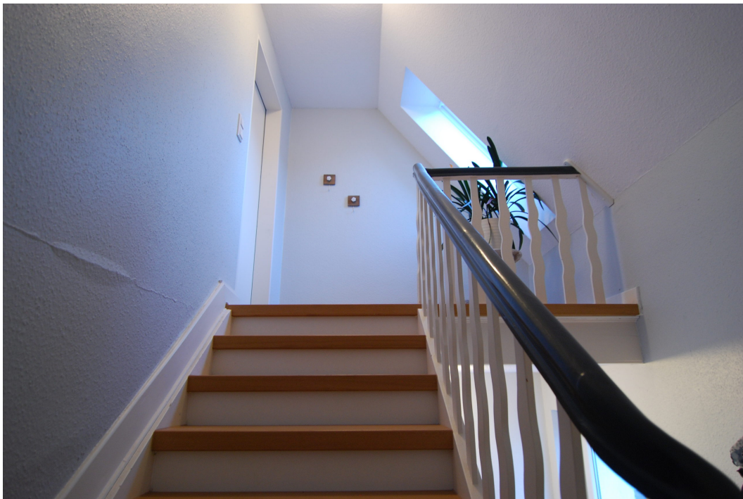
Barbarastrasse12 Treppenhaus 1