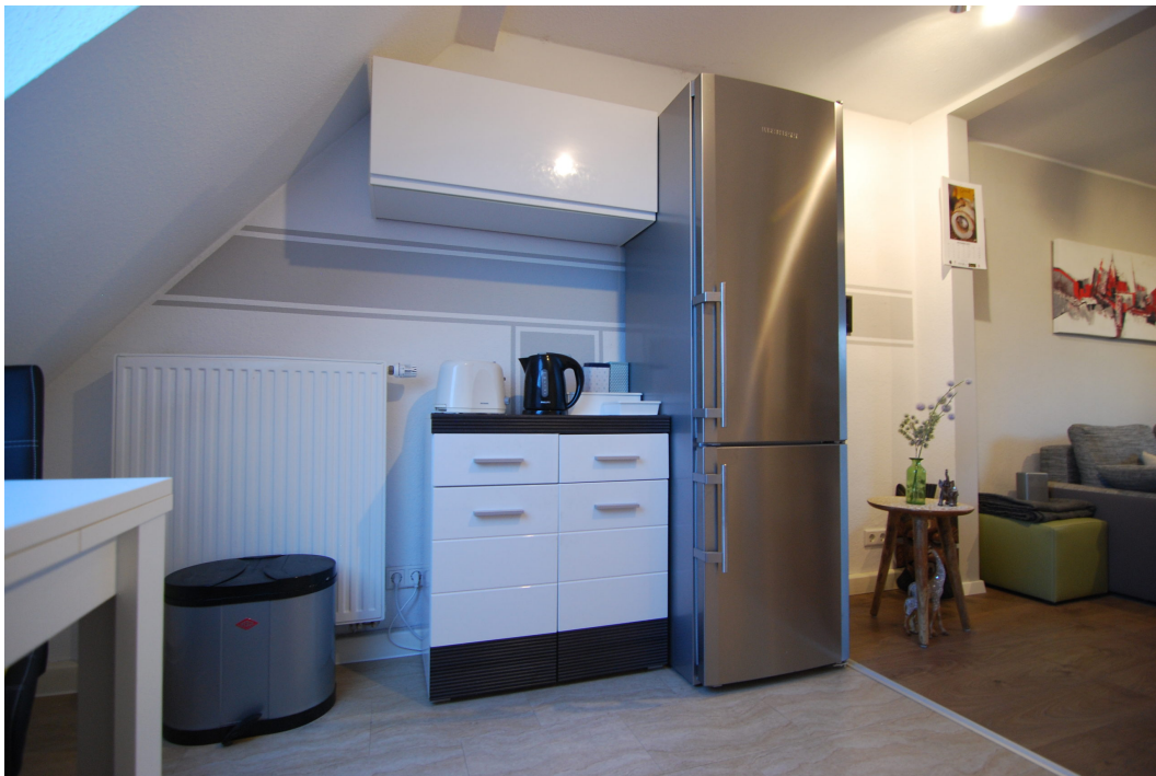
Barbarastrasse12 DG Kueche 3