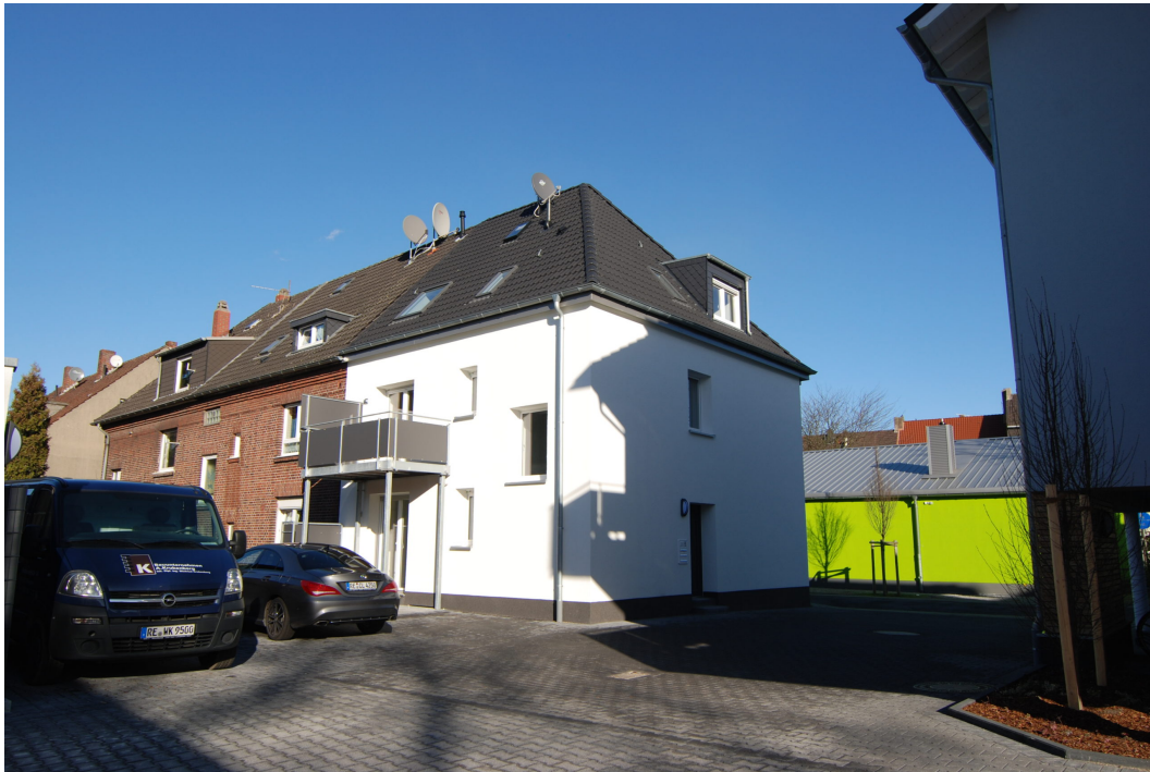
Barbarastrasse12 Ansicht 1