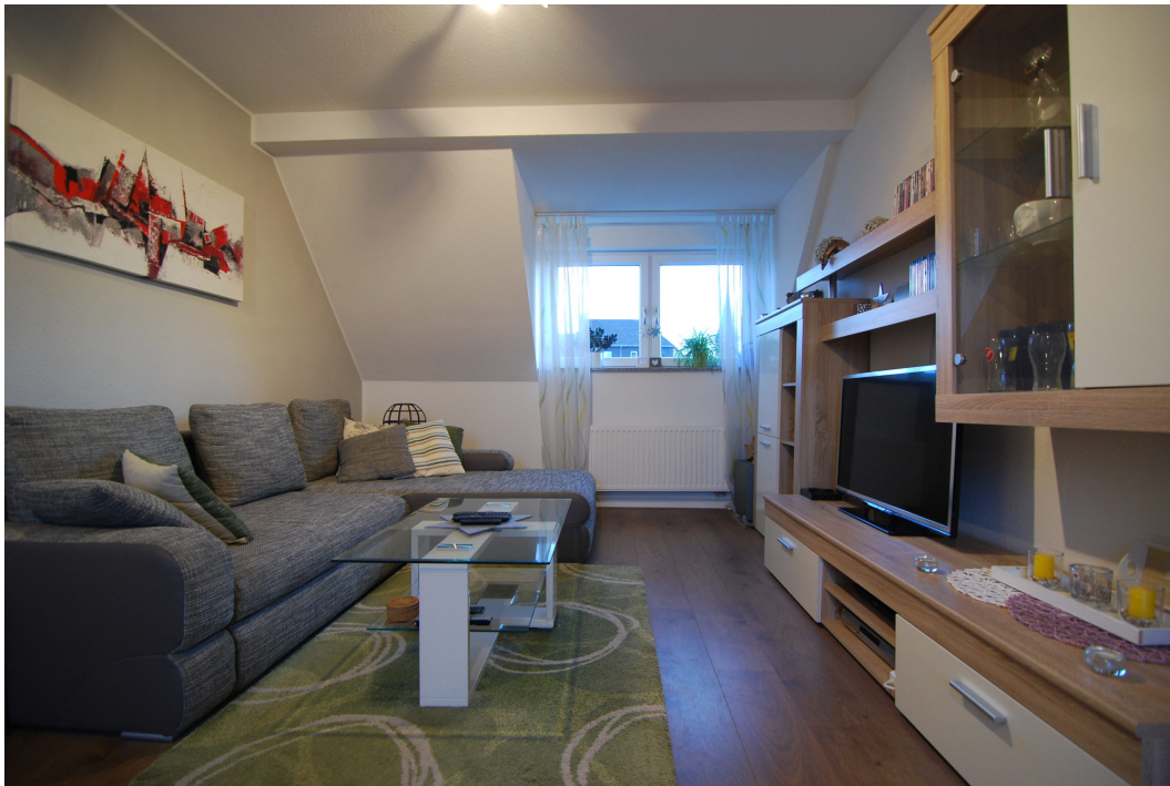
Barbarastrasse12 DG Wohnen 1