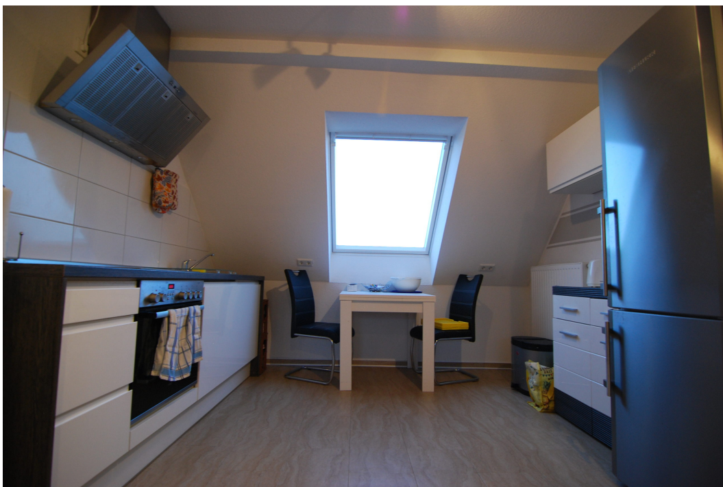
Barbarastrasse12 DG Kueche 1