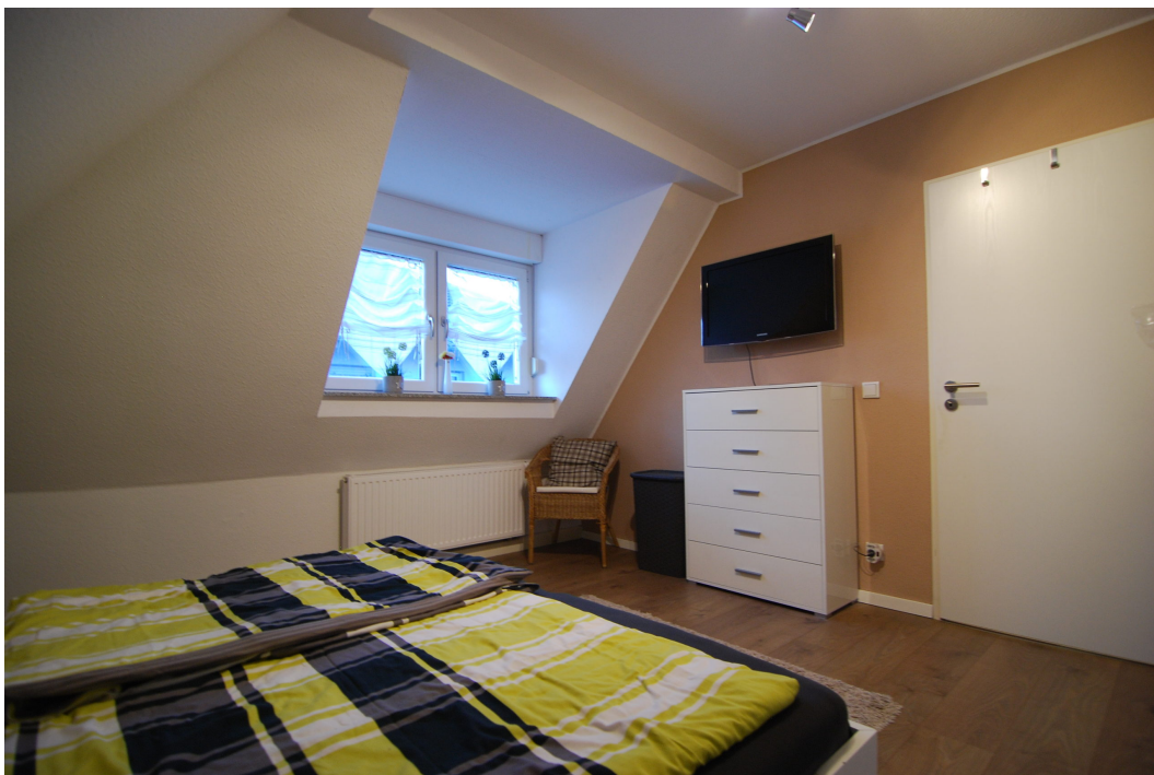
Barbarastrasse12 DG Schlafen 4