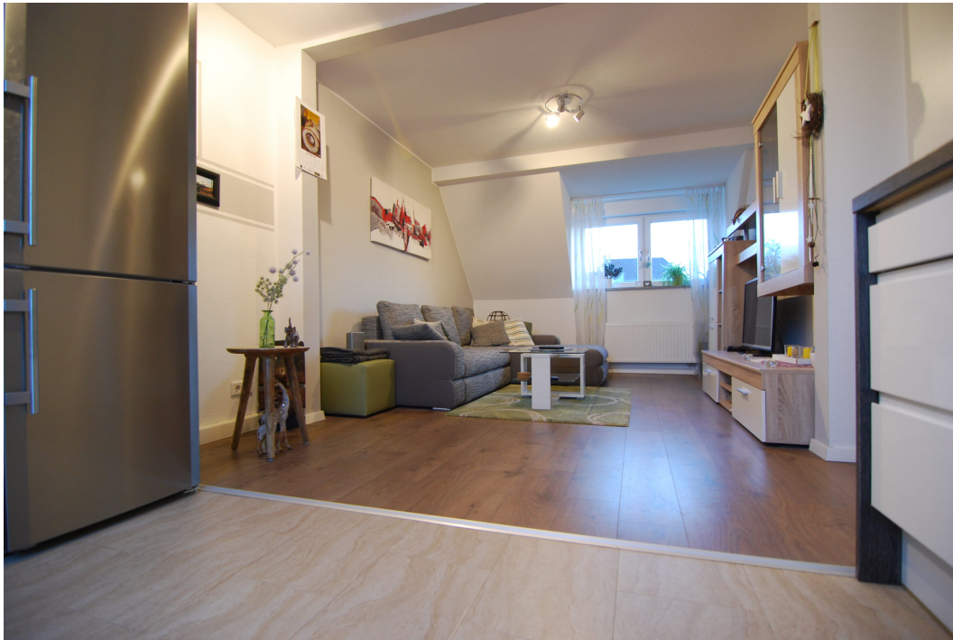
Barbarastrasse12 DG KuecheWohnen 2