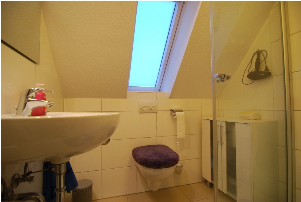
Barbarastrasse12 DG Bad 1