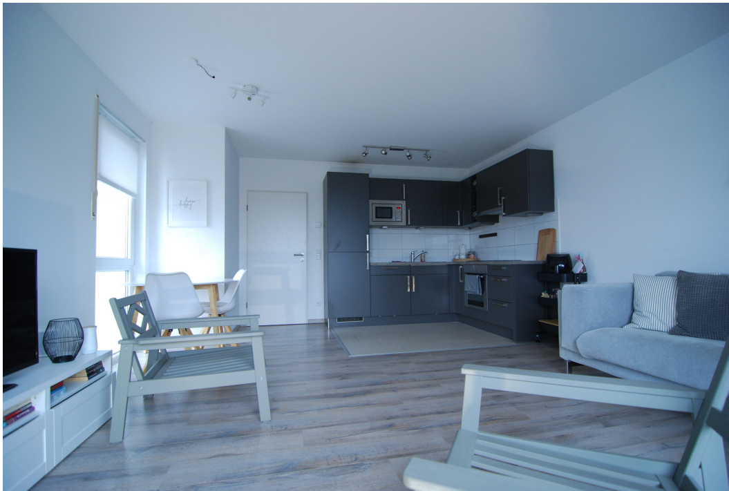
Barbarastrasse14A 2OGrechts Wohnzimmer 1