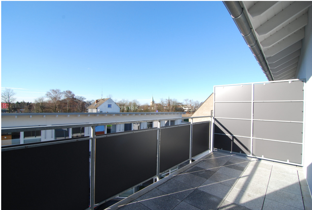
Barbarastr14A 2OGlinks Balkon 1