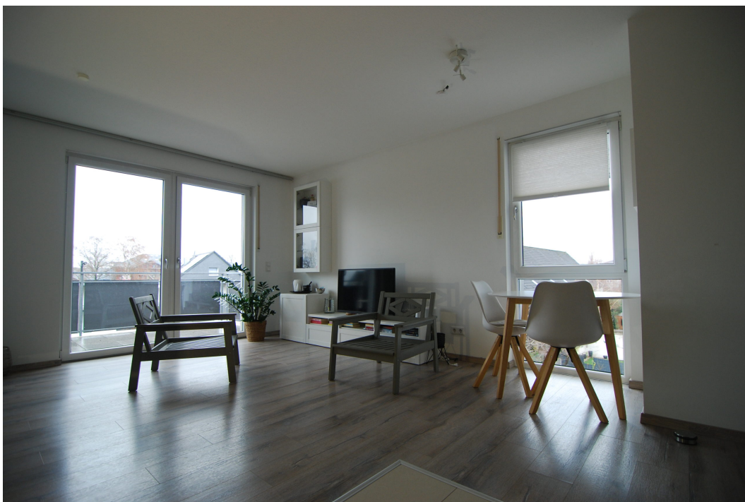
Barbarastrasse14A 2OGrechts Wohnzimmer 4