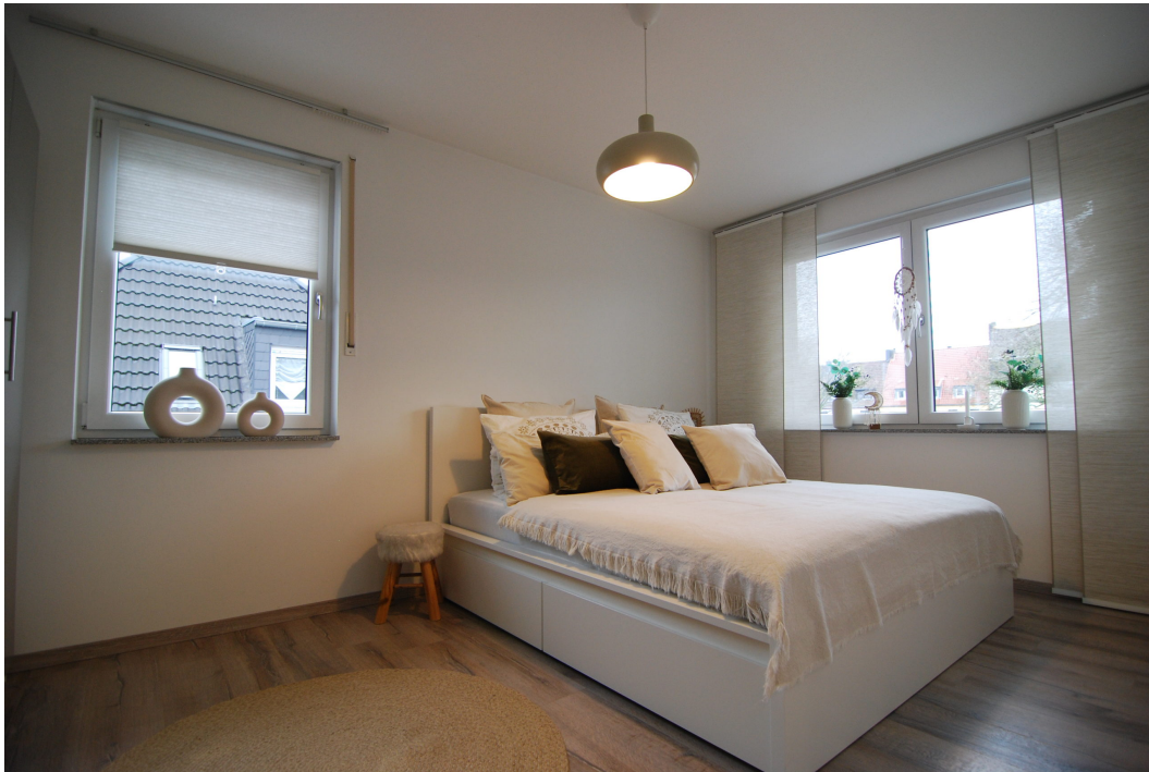
Barbarastrasse14A 2OGrechts Schlafzimmer 1