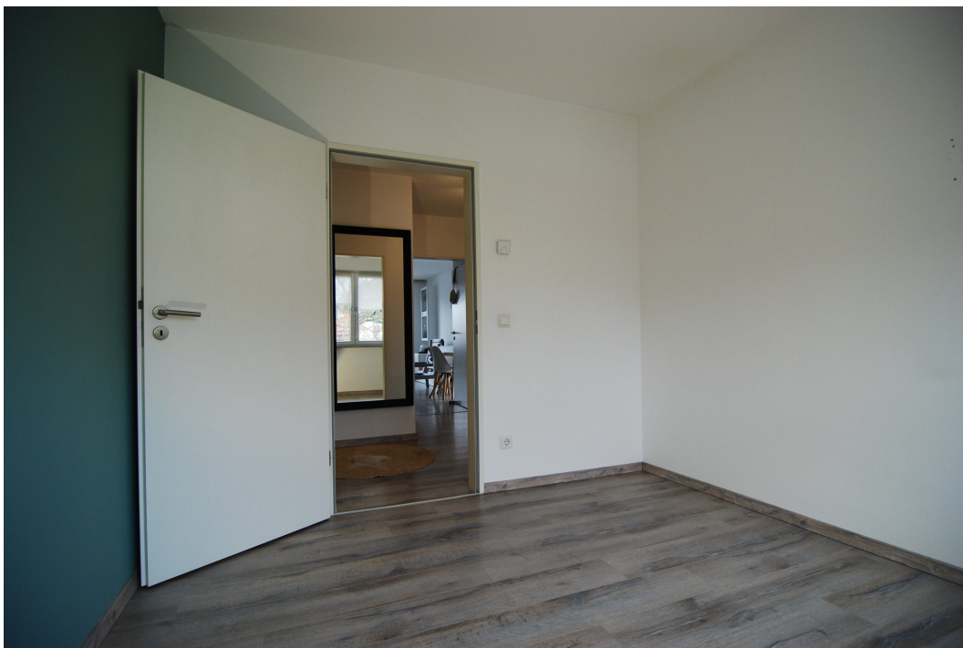
Barbarastrasse14A 2OGrechts Kinderzimmer 3