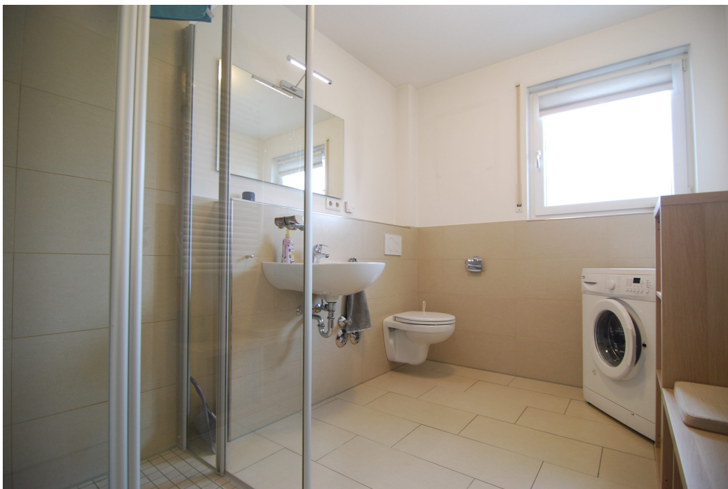
Barbarastrasse14A 2OGrechts Bad 2