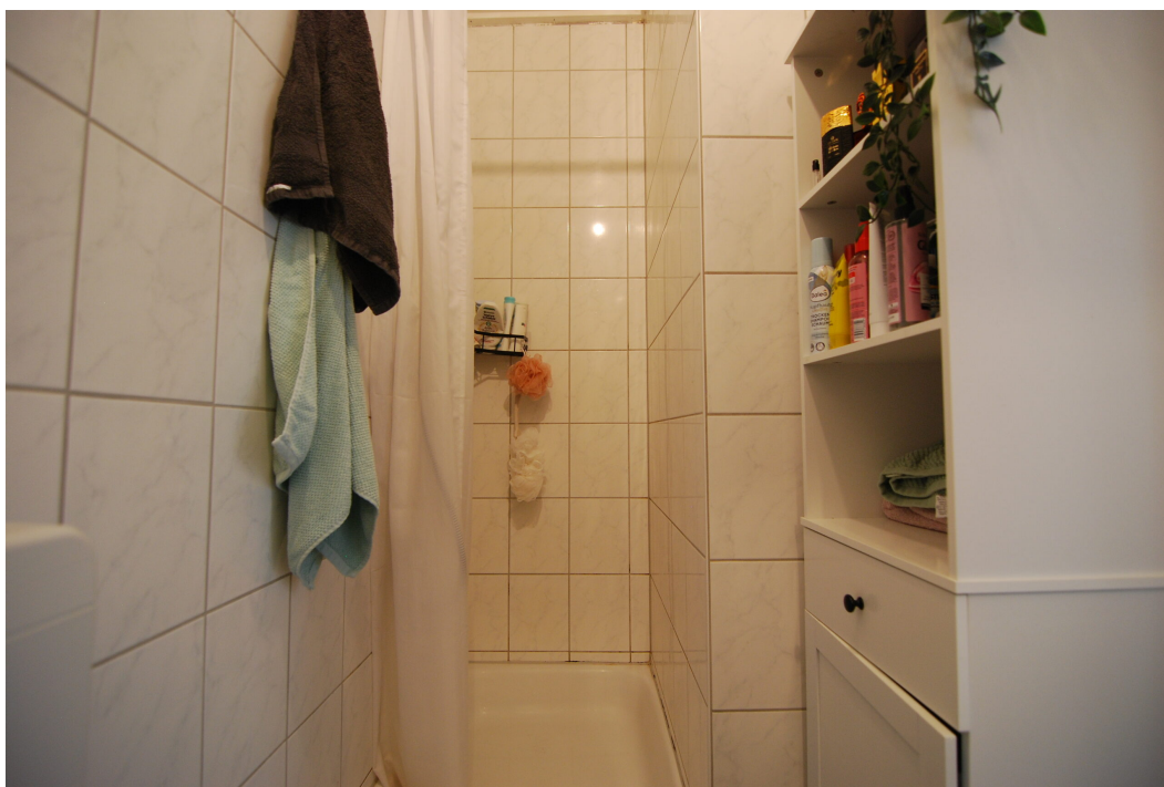
Vogelsang20 1OG Bad 2.25