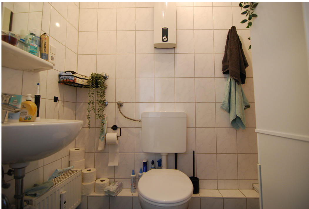
Vogelsang20 1OG Bad 1.25