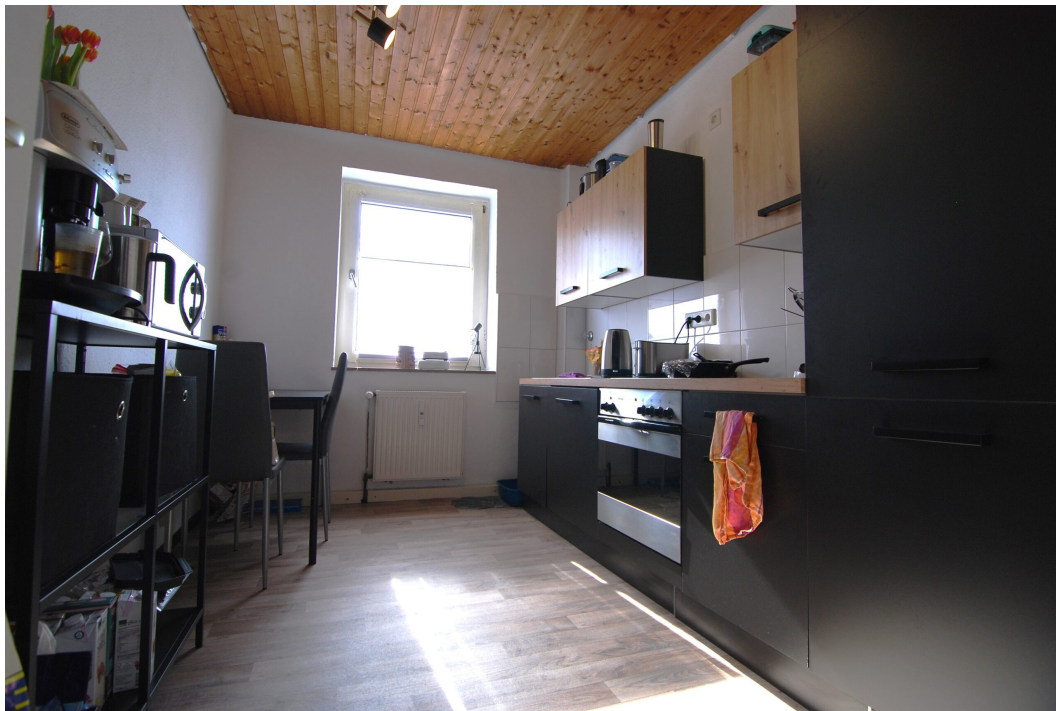
Vogelsang20 1OG Kueche 1.25