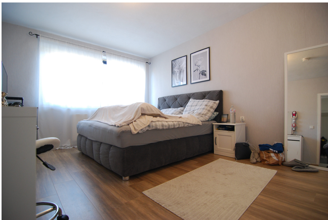
Vogelsang20 1OG Schlafzimmer 2.25