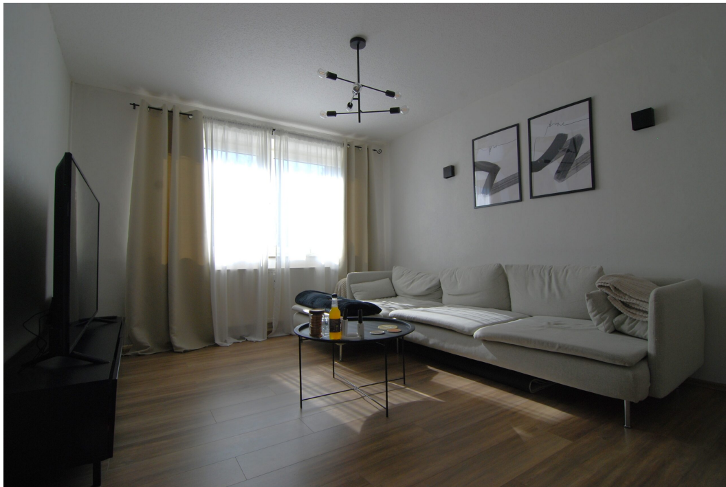
Vogelsang20 1OG Wohnzimmer 2.25