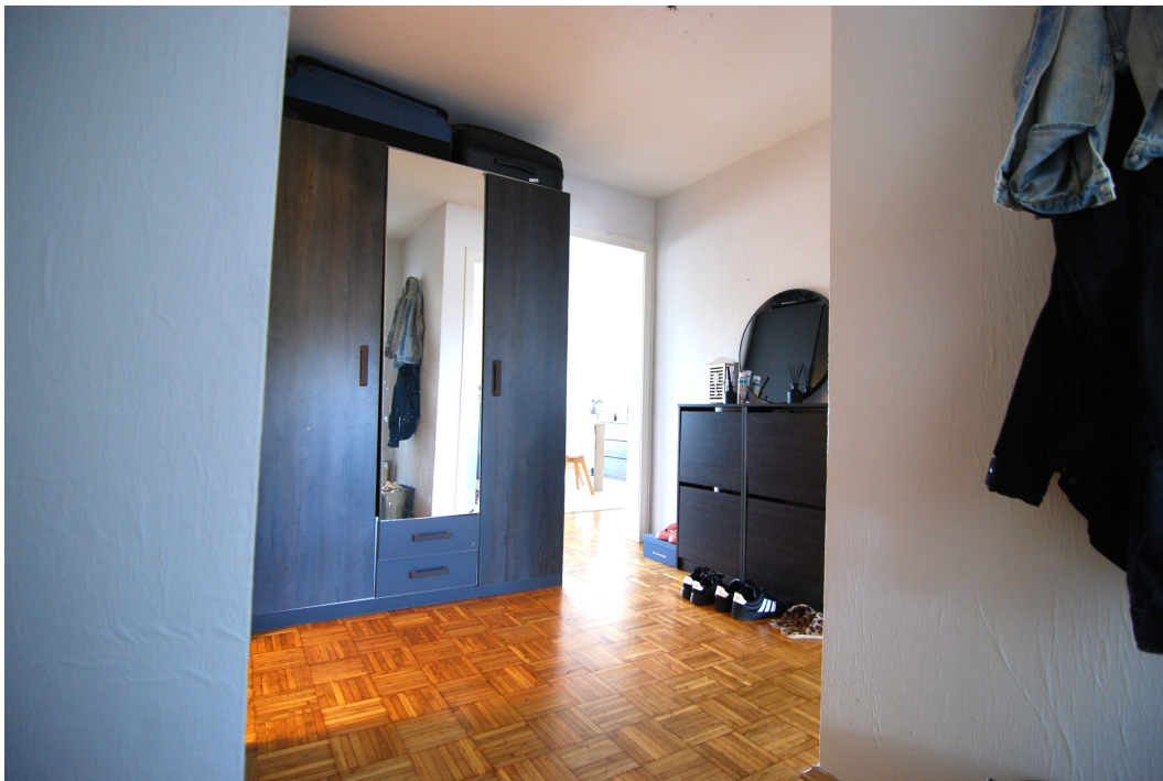
Barbarastrasse23 DGrechts Flur 1 2