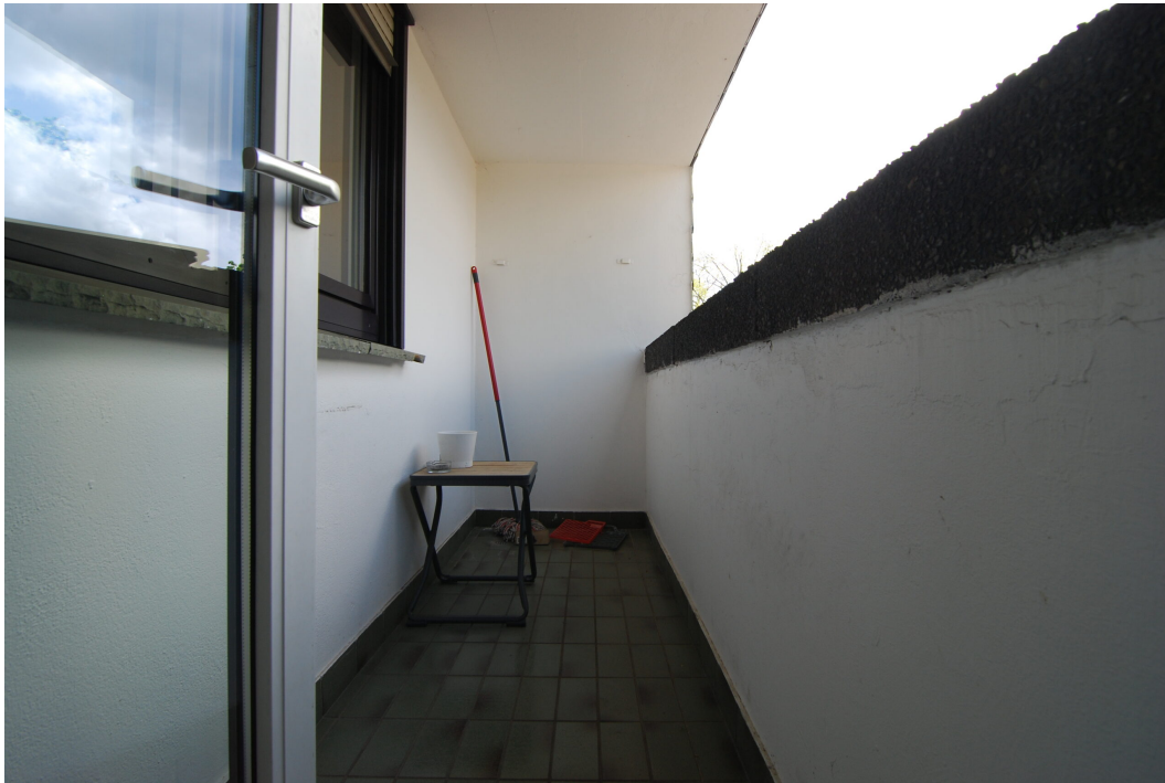
Barbarastrasse23 DGrechts Balkon 1 3