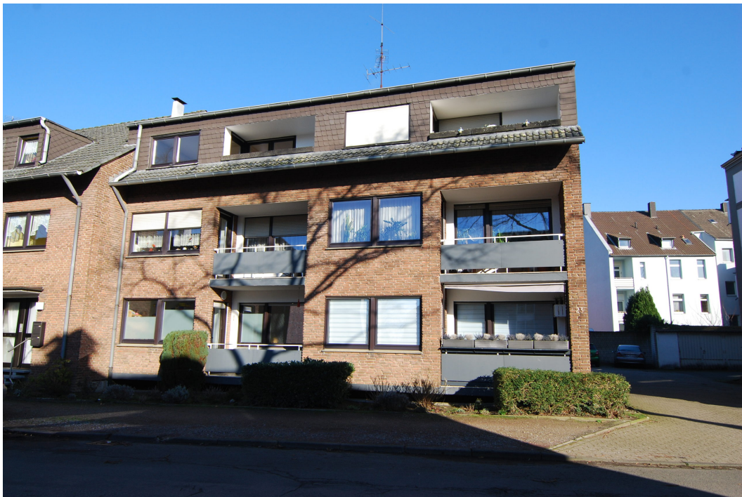
Barbarastrasse23 Strassenansicht 2