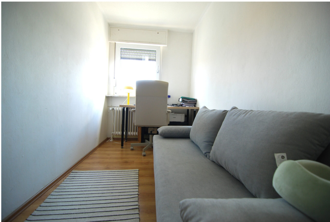
Barbarastrasse23 DGrechts Kinderzimmer 1 3