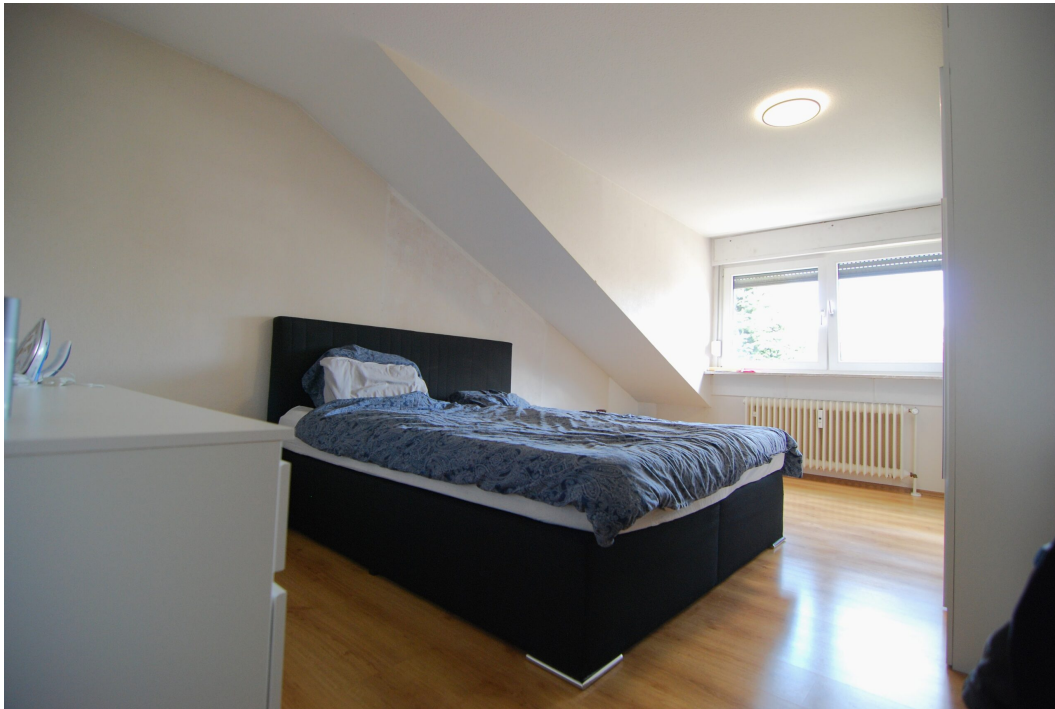
Barbarastrasse23 DGrechts Schlafzimmer 1 2