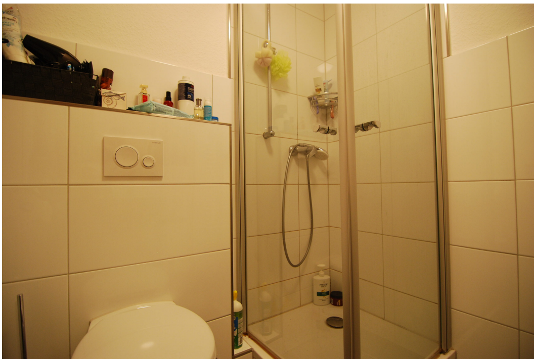
Barbarastrasse23 DGrechts Bad 1 5