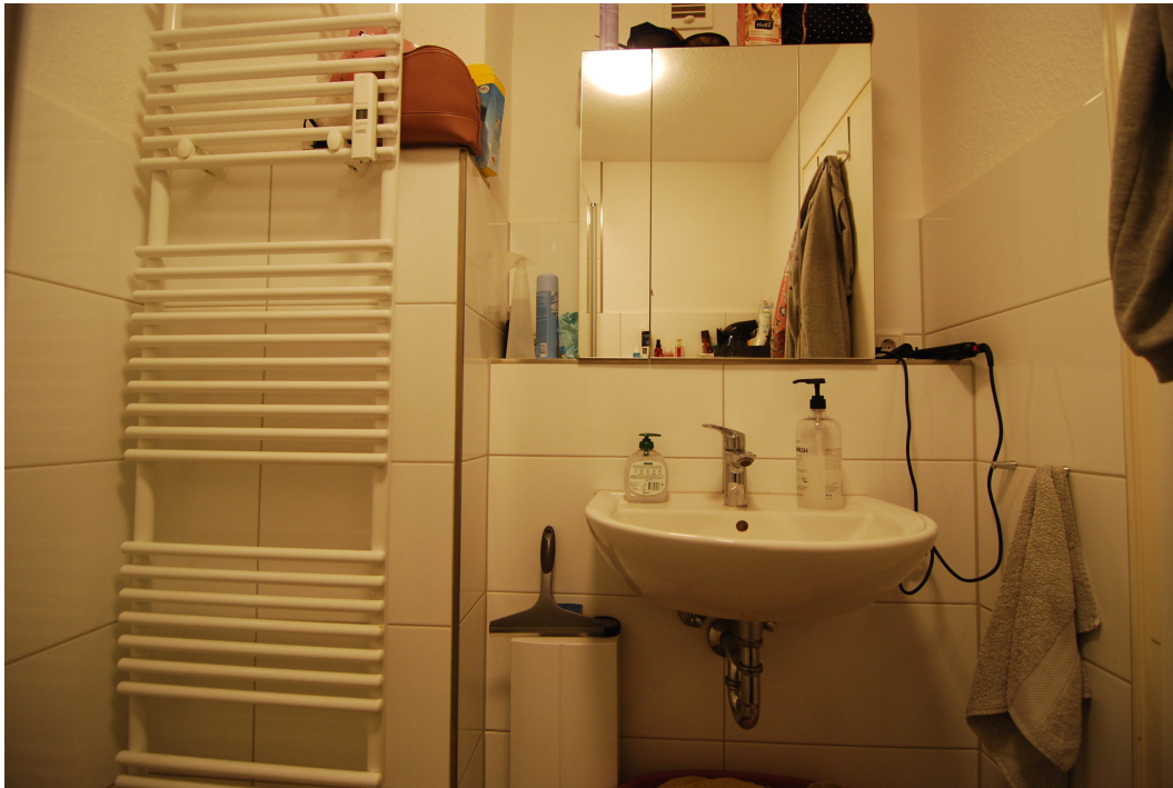
Barbarastrasse23 DGrechts Bad 1 4