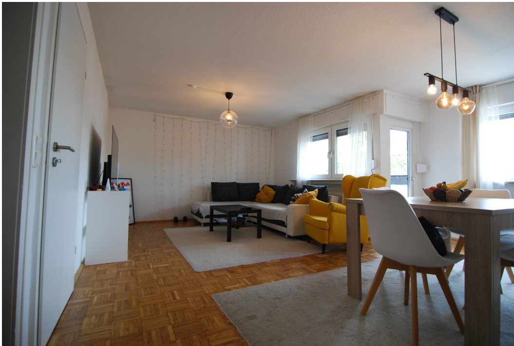
Barbarastrasse23 DGrechts Wohnzimmer 1 4