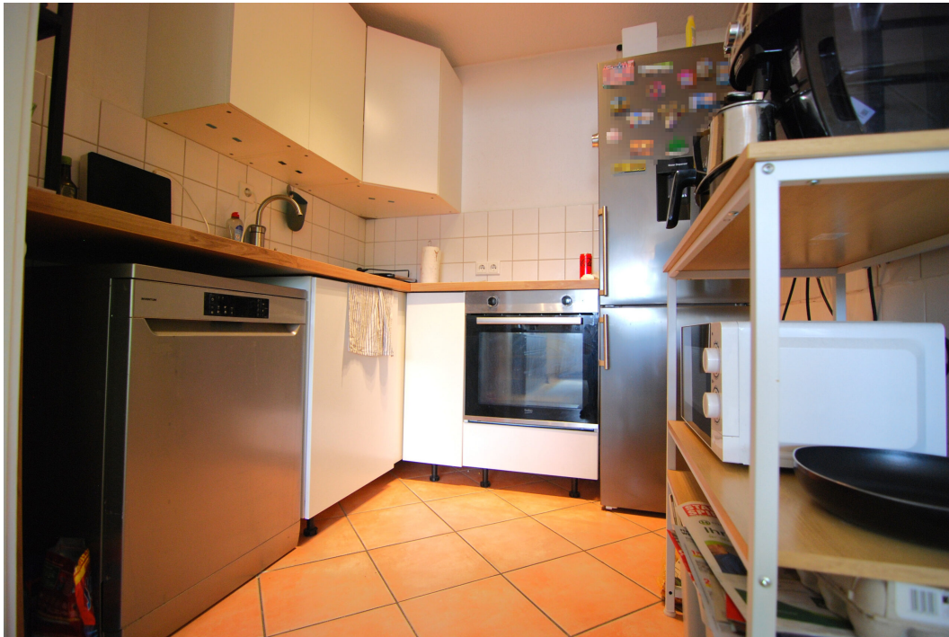
Barbarastrasse23 DGrechts Kueche 1 2