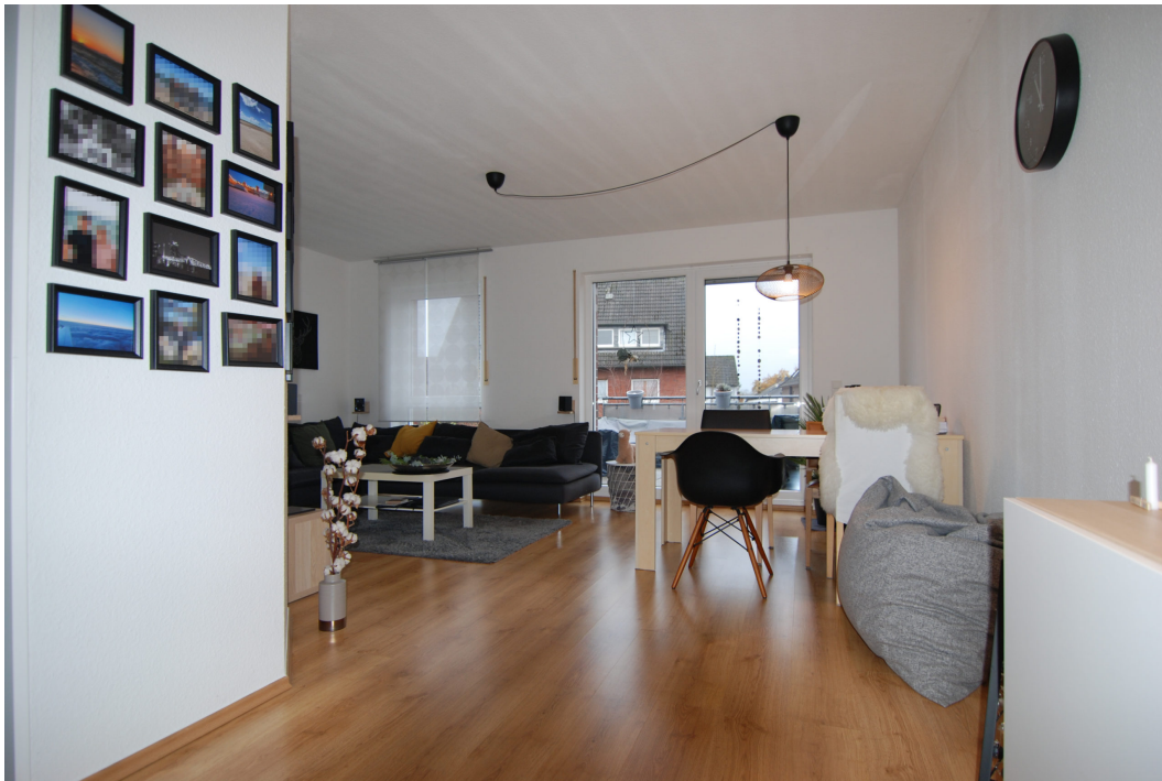
Klosterstrasse57B 10Glinks Wohnzimmer 2 verpixelt