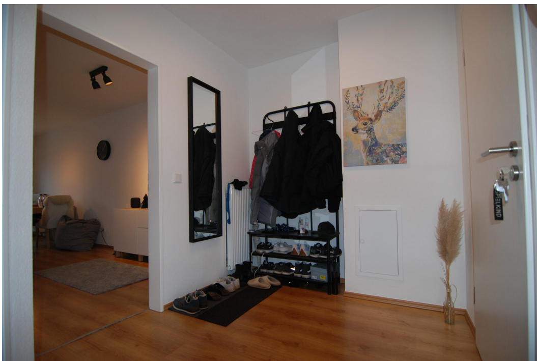
Klosterstrasse57B 10Glinks Flur 5