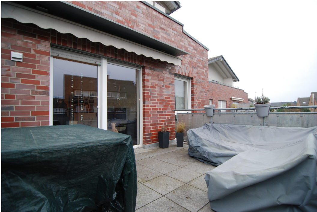
Klosterstrasse57B 10Glinks Balkon