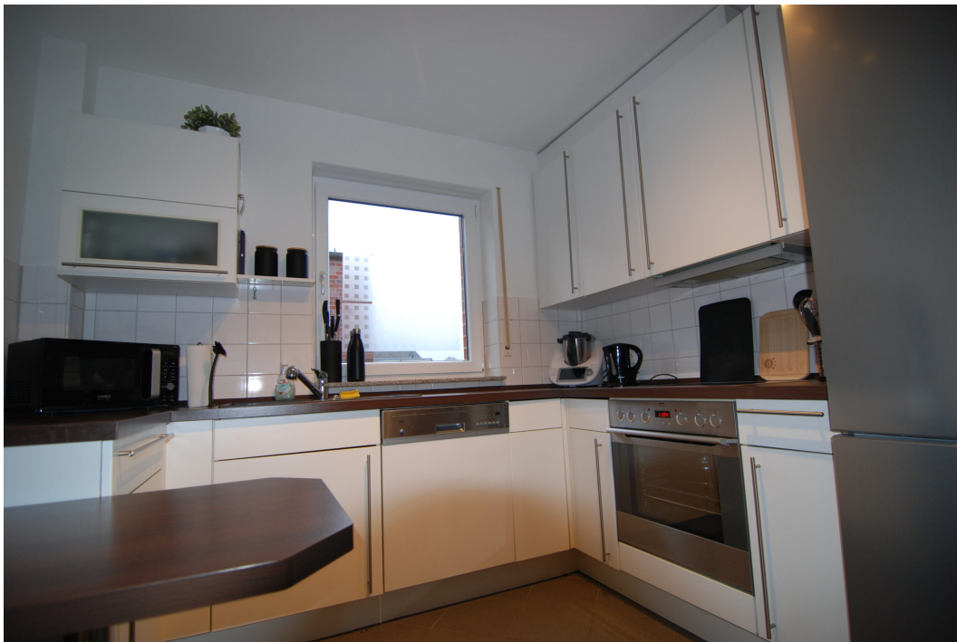
Klosterstrasse57B 10Glinks Kueche 3