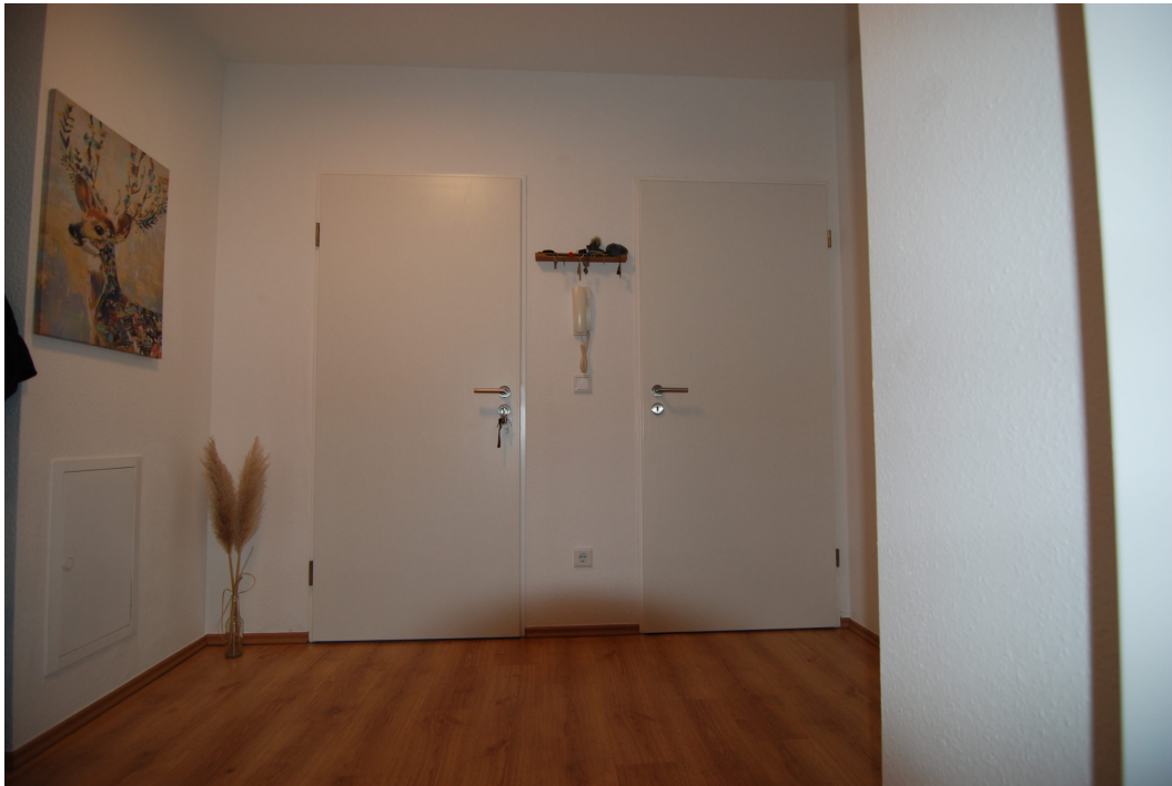
Klosterstrasse57B 10Glinks Flur 2