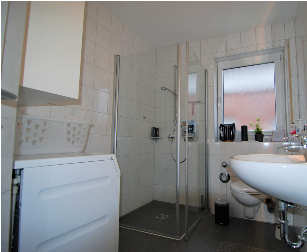
Klosterstrasse57B 10Glinks Bad 3