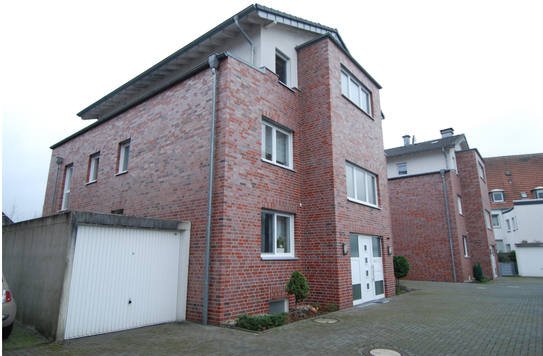
Klosterstrasse57B Seitenansicht 2