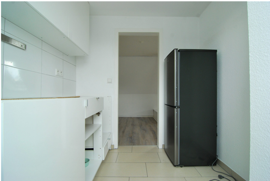
Barbarastrasse16 DG Kueche 2