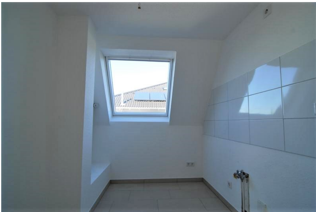
Barbarastrasse16 DG Kueche 3