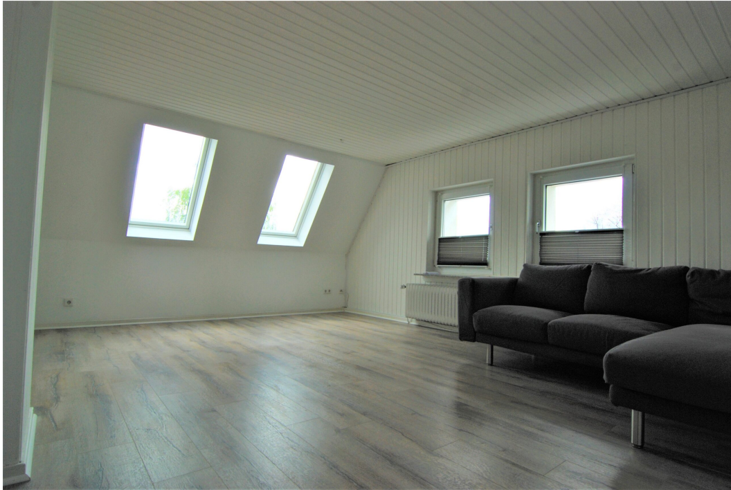
Barbarastrasse16 DG Wohnzimmer 5