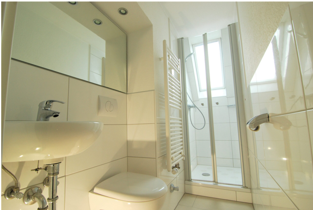
Barbarastrasse16 DG Bad 7