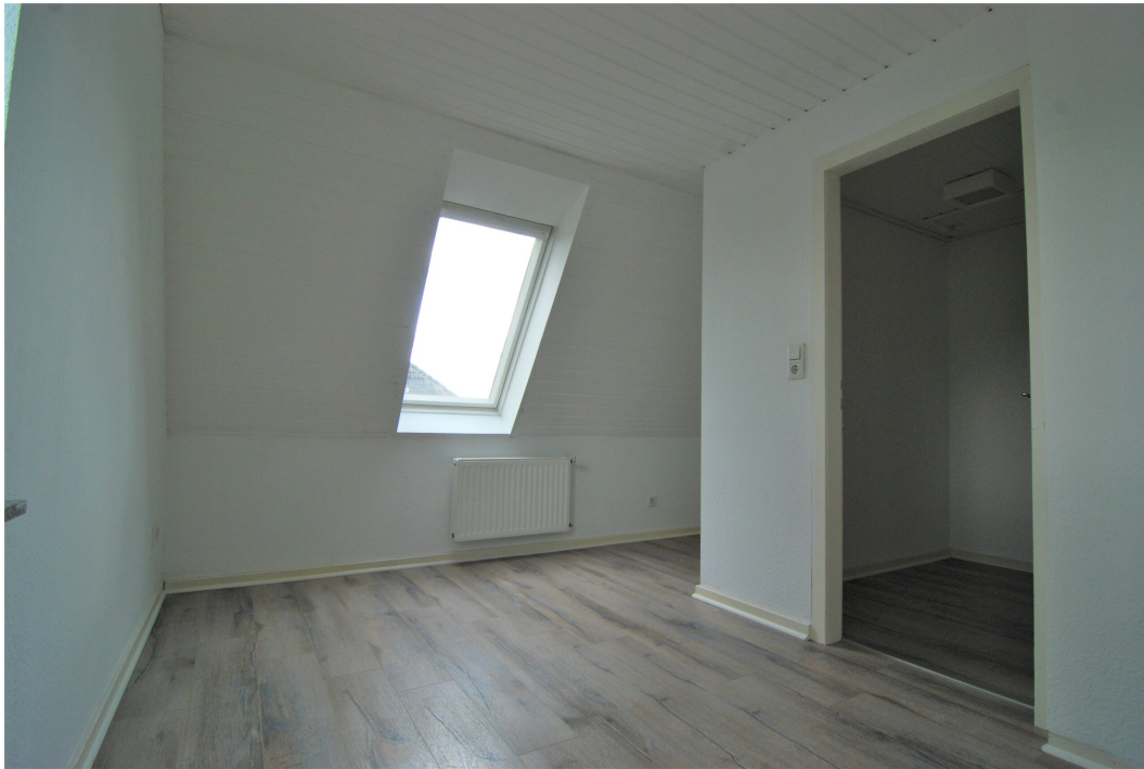
Barbarastrasse16 DG Schlafzimmer 1