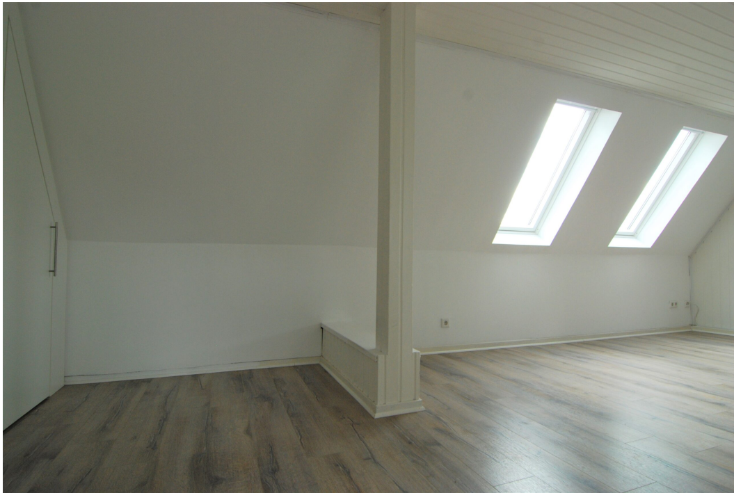
Barbarastrasse16 DG Wohnzimmer 8