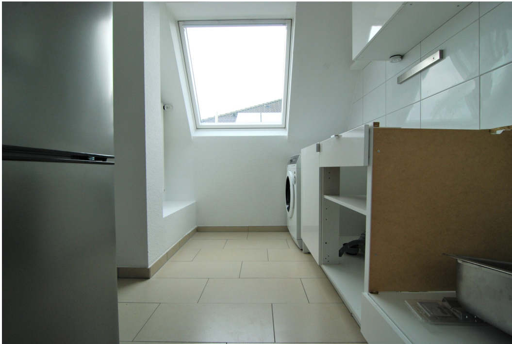
Barbarastrasse16 DG Kueche 1