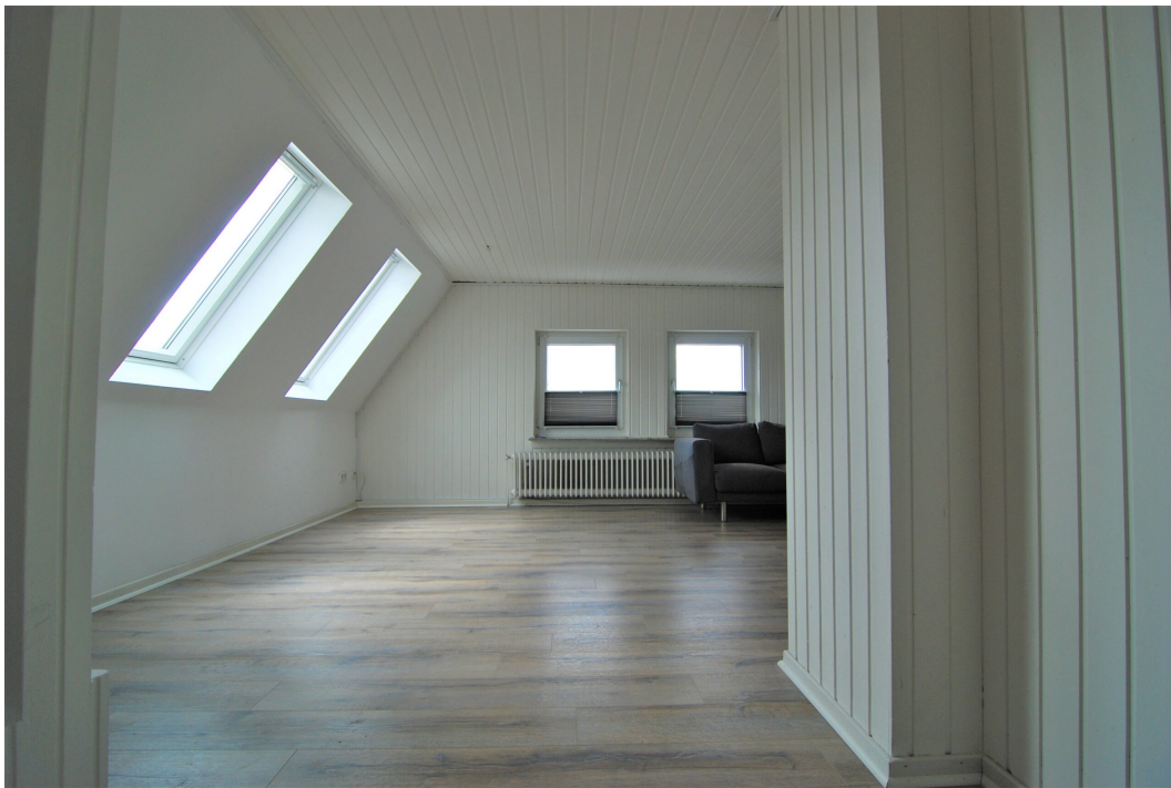
Barbarastrasse16 DG Wohnzimmer 1