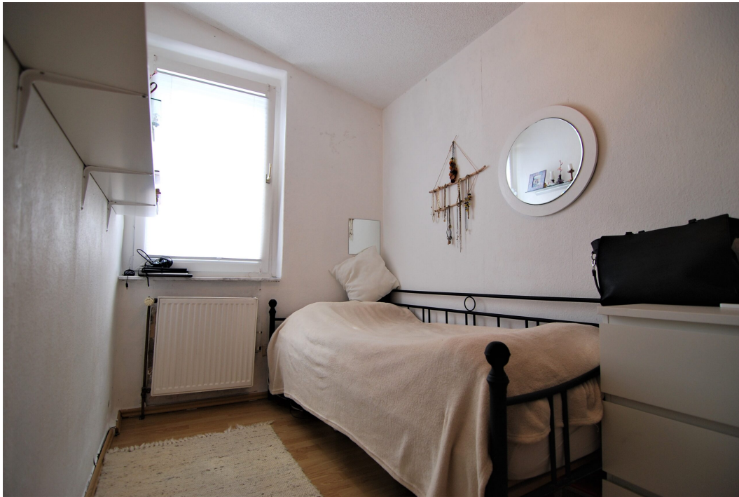
Bochumerstrasse32 2OG Kinderzimmer 2 2