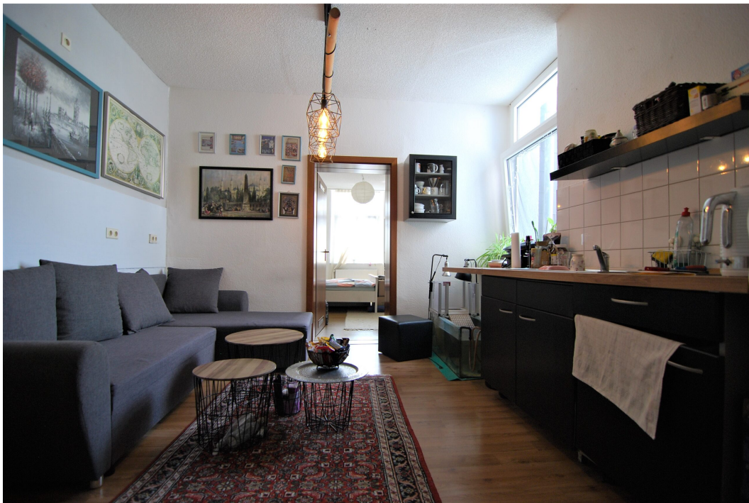
Bochumerstrasse32 2OG Kueche 2