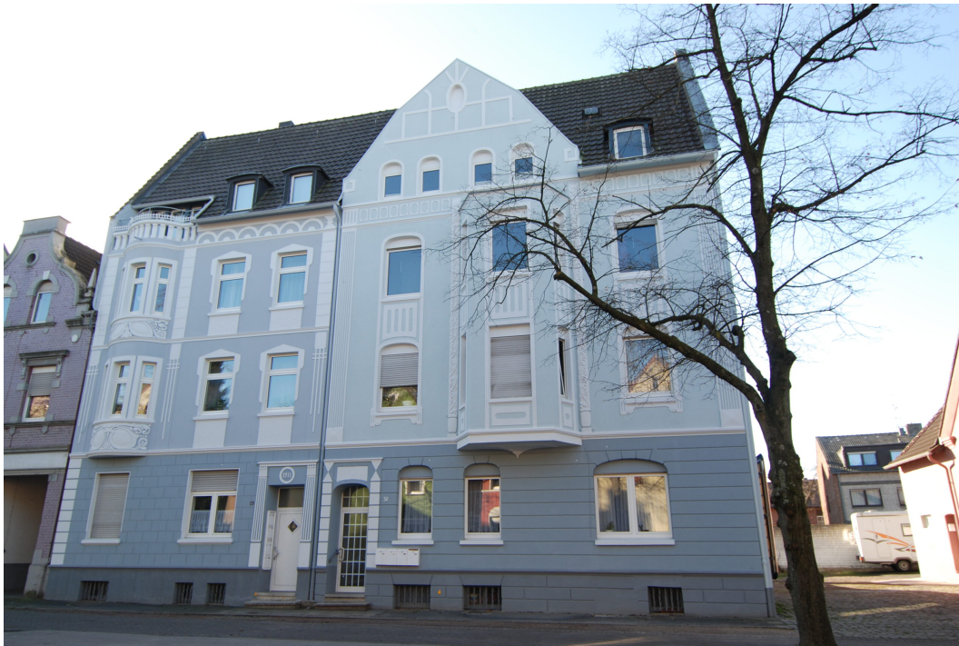
BochumerStrasse30+32 Ansichten 280114 (2)