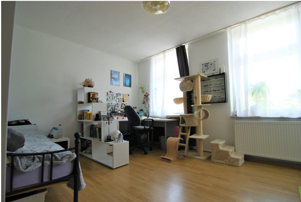
Bochumerstrasse32 2OG Kinderzimmer 6