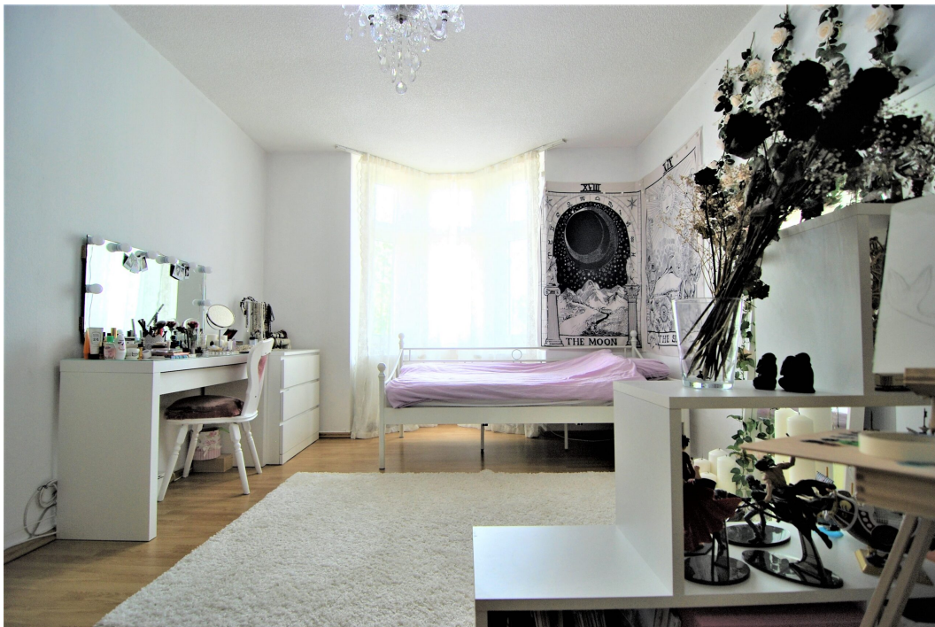
Bochumerstrasse32 2OG Wohnzimmer 7