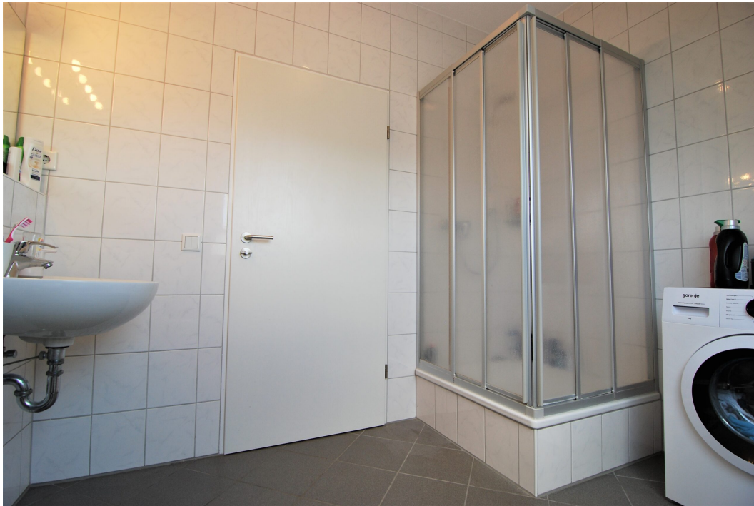
Hellweg101A DG Bad 1