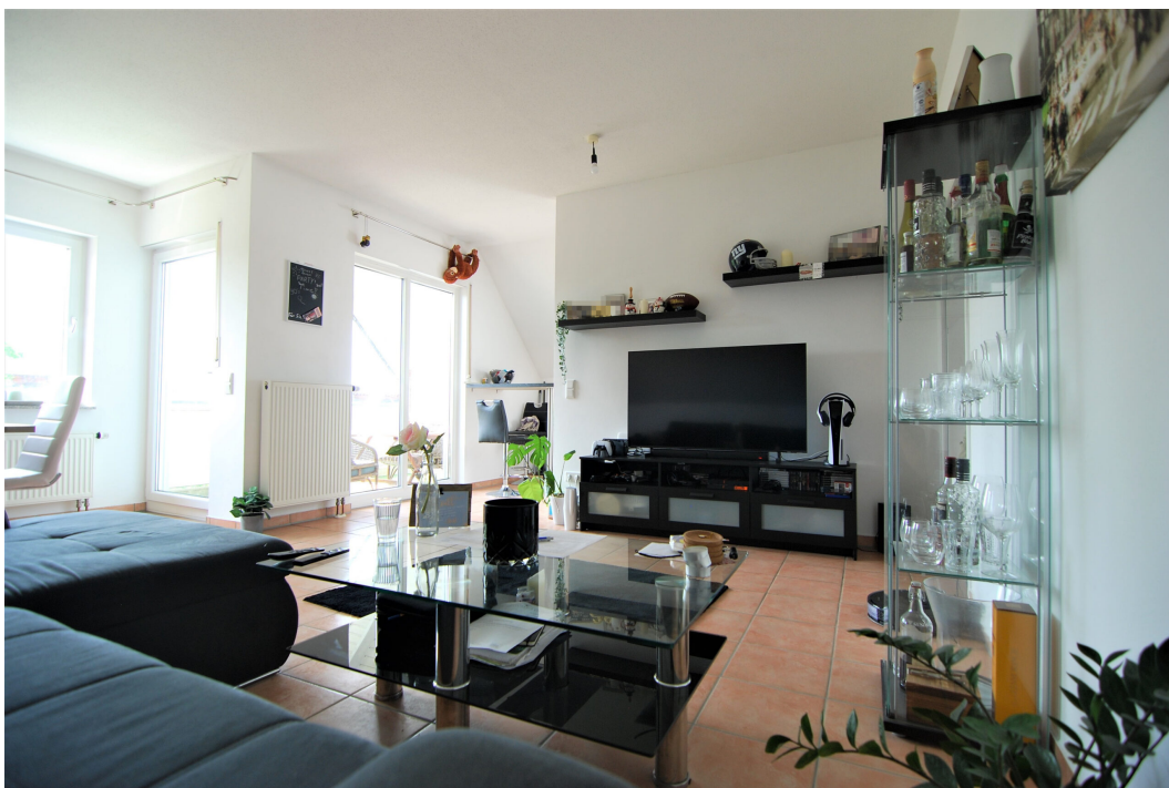
Hellweg101A DG Wohnzimmer 1