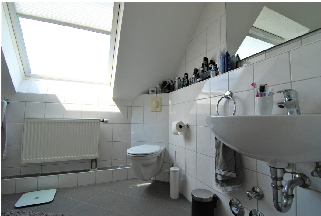
Hellweg101A DG Bad 6