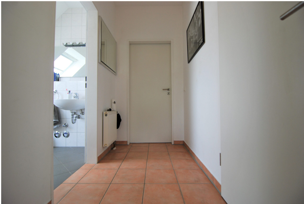
Hellweg101A DG Flur 3