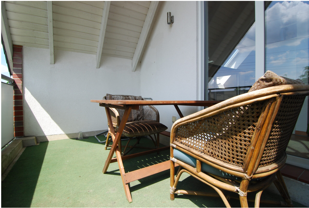
Hellweg101A DG Balkon 2