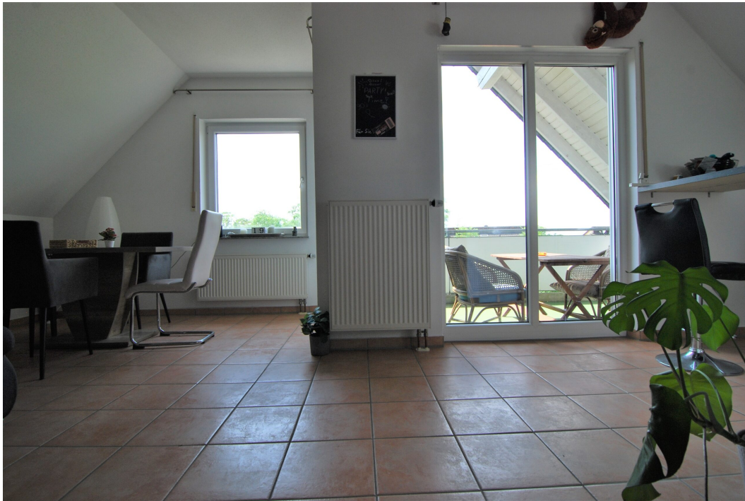
Hellweg101A DG Wohnzimmer 3