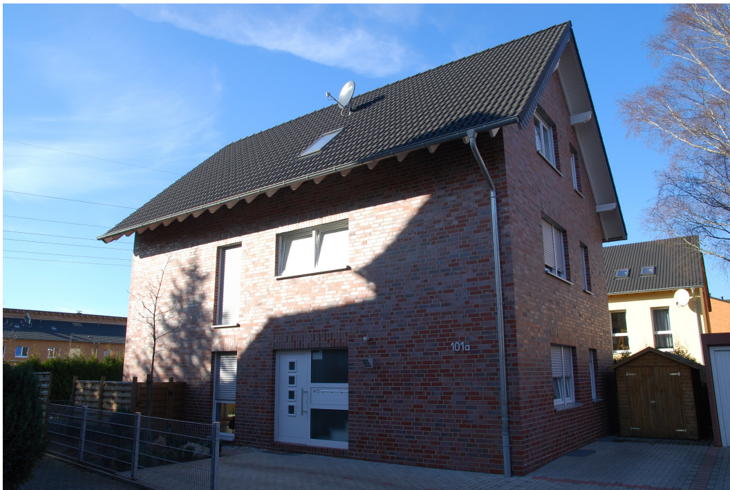
Hellweg101A Vorderansicht 1