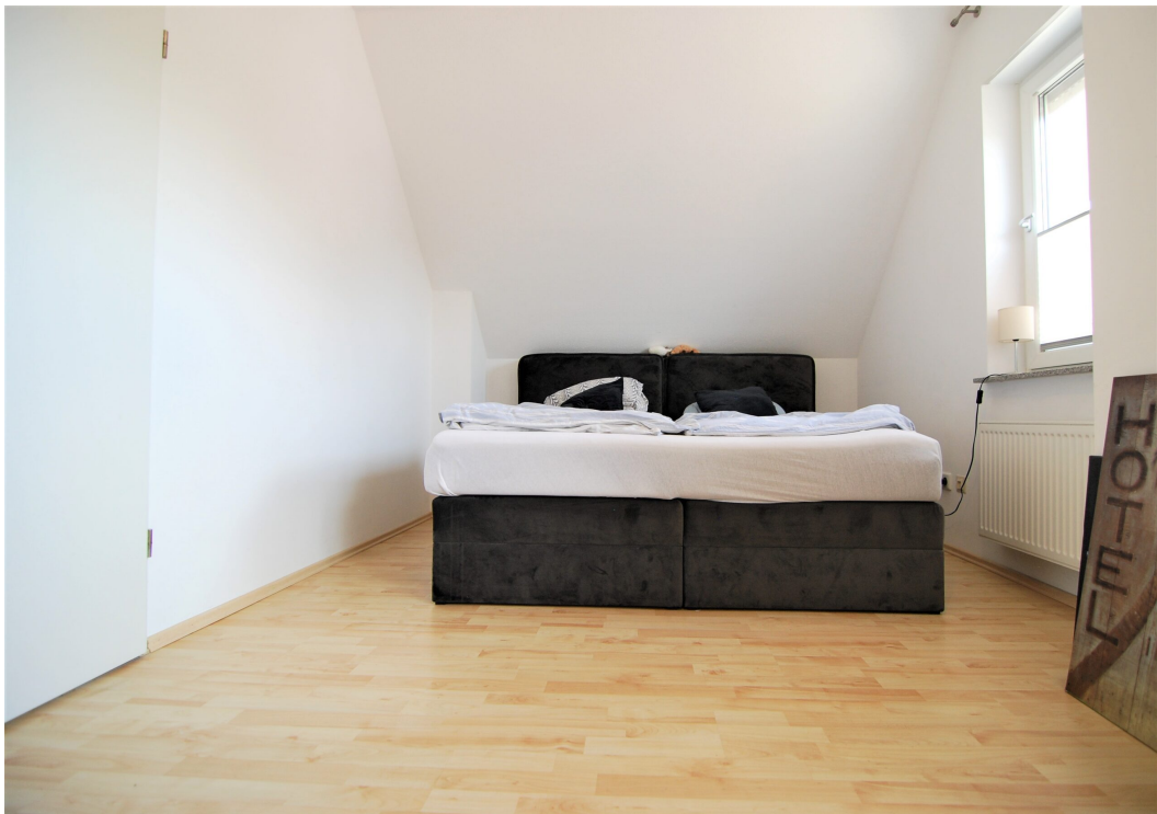
Hellweg101A DG Schlafzimmer 3