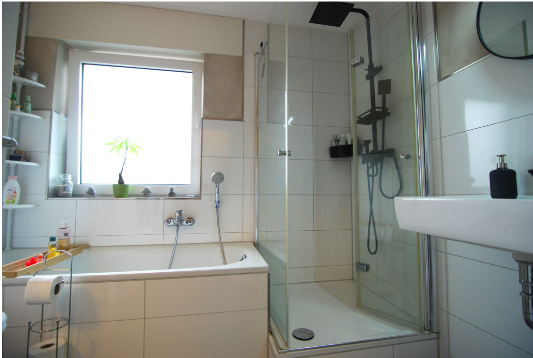
GemenerStrasse46 DG-Spitzboden Bad 2.25