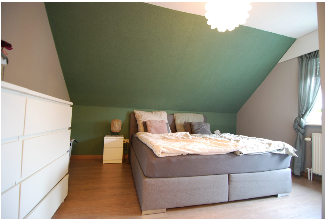
GemenerStrasse46 DG-Spitzboden Schlafzimmer 1.25