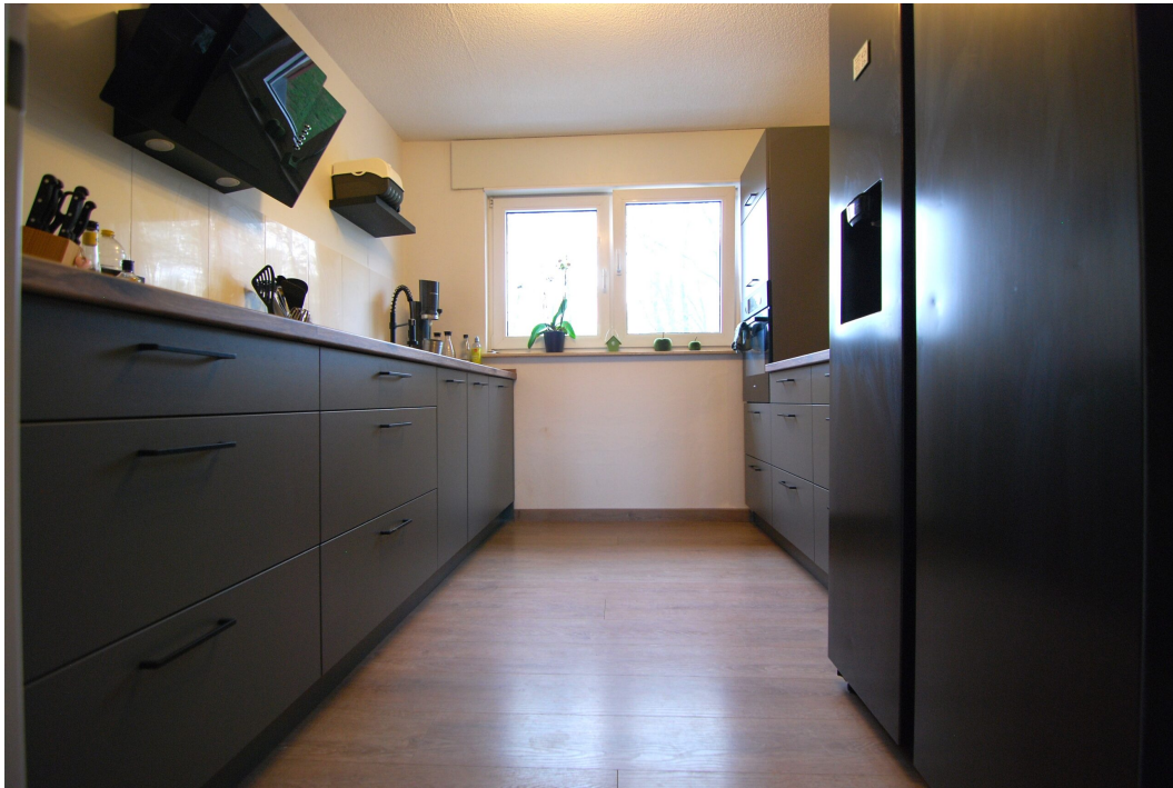
GemenerStrasse46 DG-Spitzboden Kueche 1.25