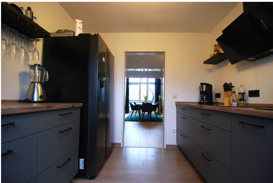
GemenerStrasse46 DG-Spitzboden Kueche 3.25