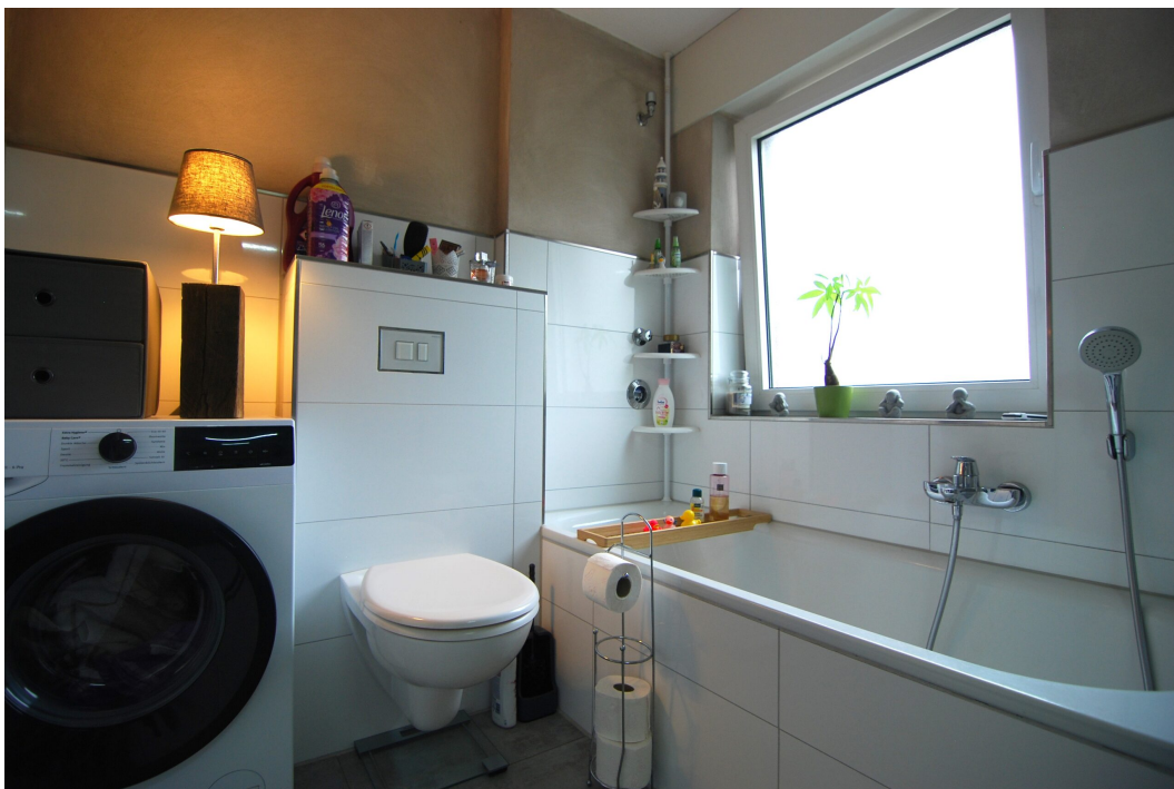
GemenerStrasse46 DG-Spitzboden Bad 4.25