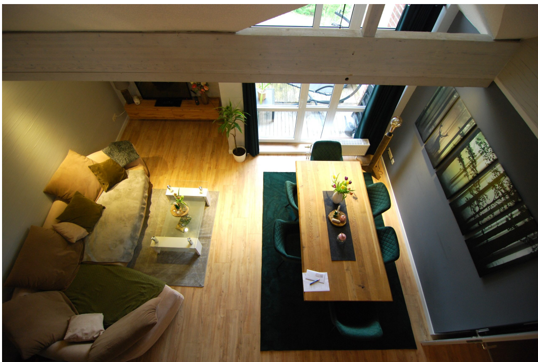
GemenerStrasse46 DG-Spitzboden Blick Wohnzimmer 1.25