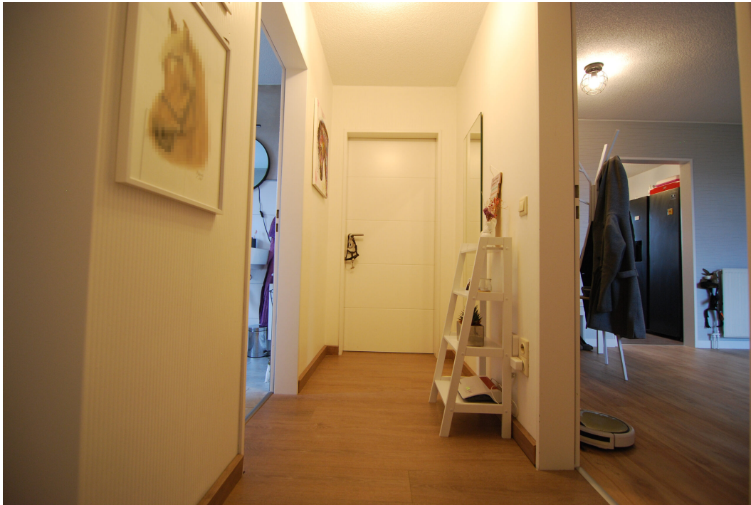
GemenerStrasse46 DG-Spitzboden Flur 2.25