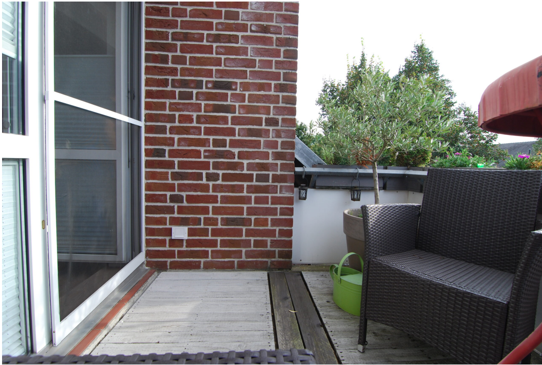
GemenerStrasse46 DG-Spitzboden Balkon 2