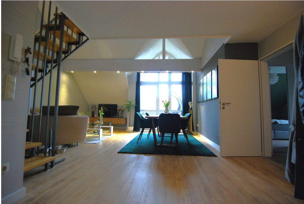
GemenerStrasse46 DG-Spitzboden Wohnzimmer 1.25