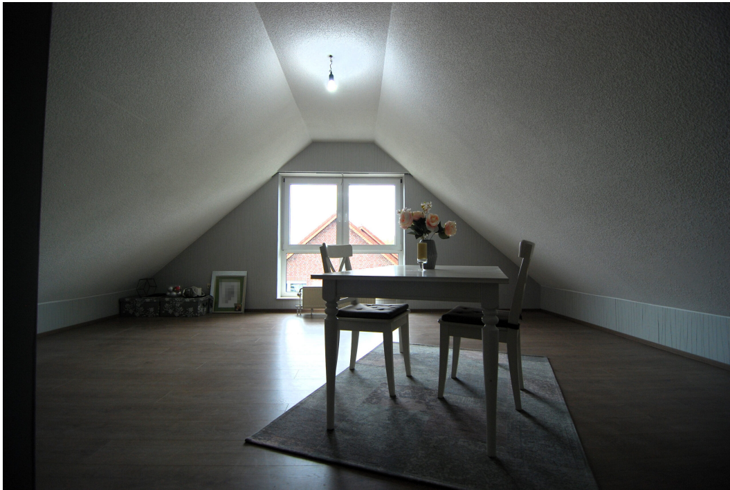
GemenerStrasse46 DG-Spitzboden Studio 1.25