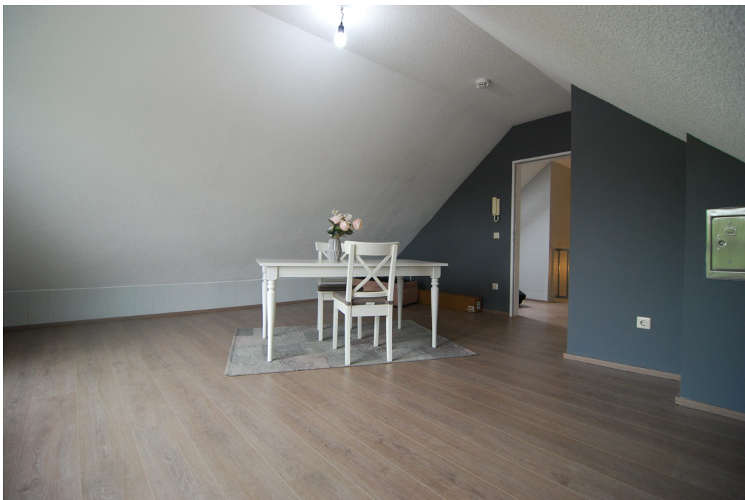
GemenerStrasse46 DG-Spitzboden Studio 4.25