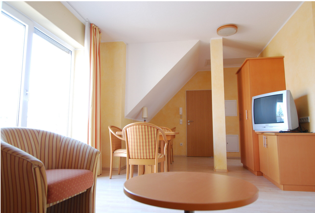
Waldstrasse26 DGrechts Wohnzimmer 6