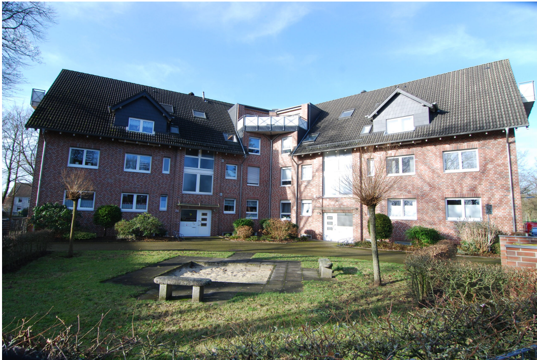
Waldstrasse24-26 Vorderansicht 1