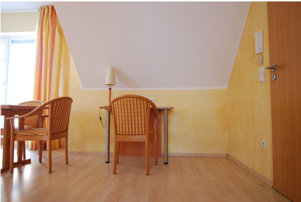
Waldstrasse26 DGrechts Wohnzimmer 9