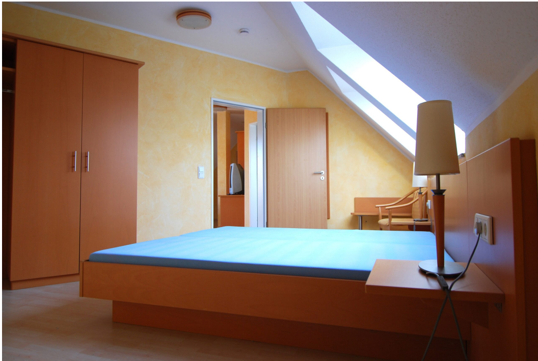
Waldstrasse26 DGrechts Schlafzimmer 7