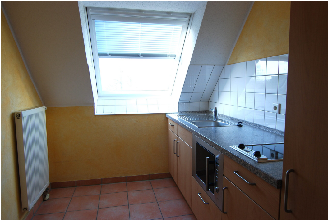
Waldstrasse26 DGrechts Kueche 2