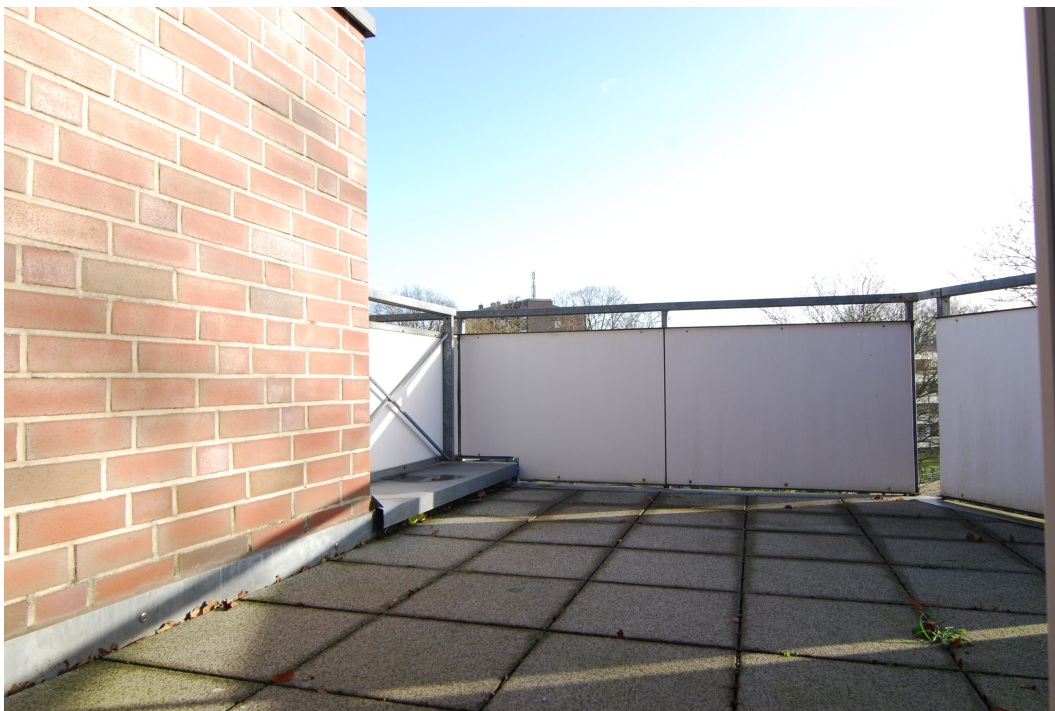
Waldstrasse26 DGrechts Balkon 1