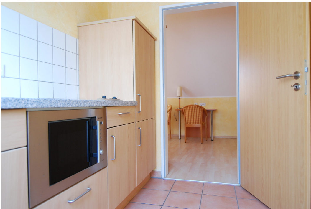
Waldstrasse26 DGrechts Kueche 4