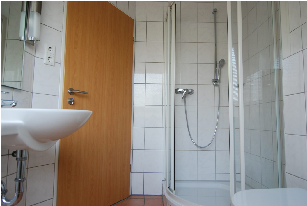
Waldstrasse26 DGrechts Bad 3