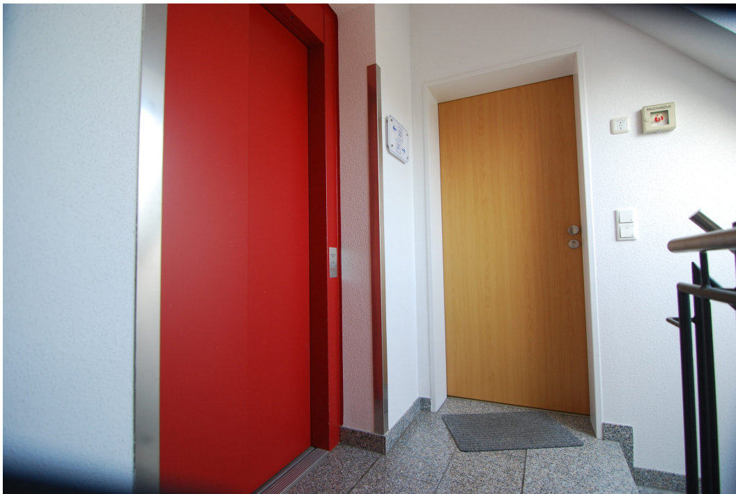
Waldstrasse26 DGrechts Hausflur 1