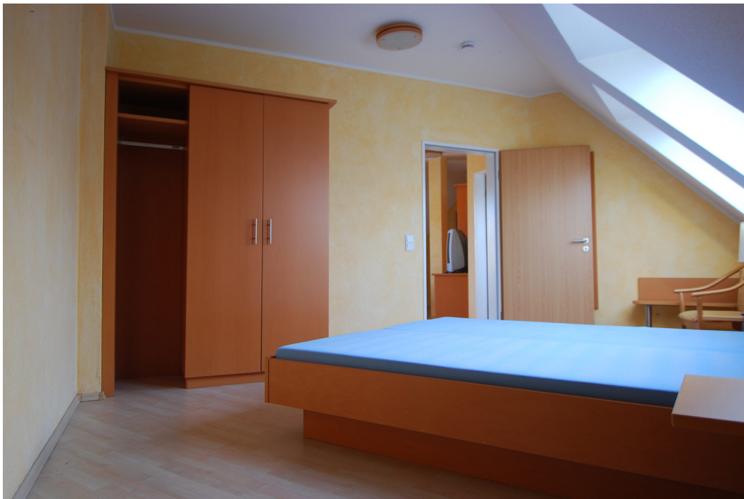
Waldstrasse26 DGrechts Schlafzimmer 6