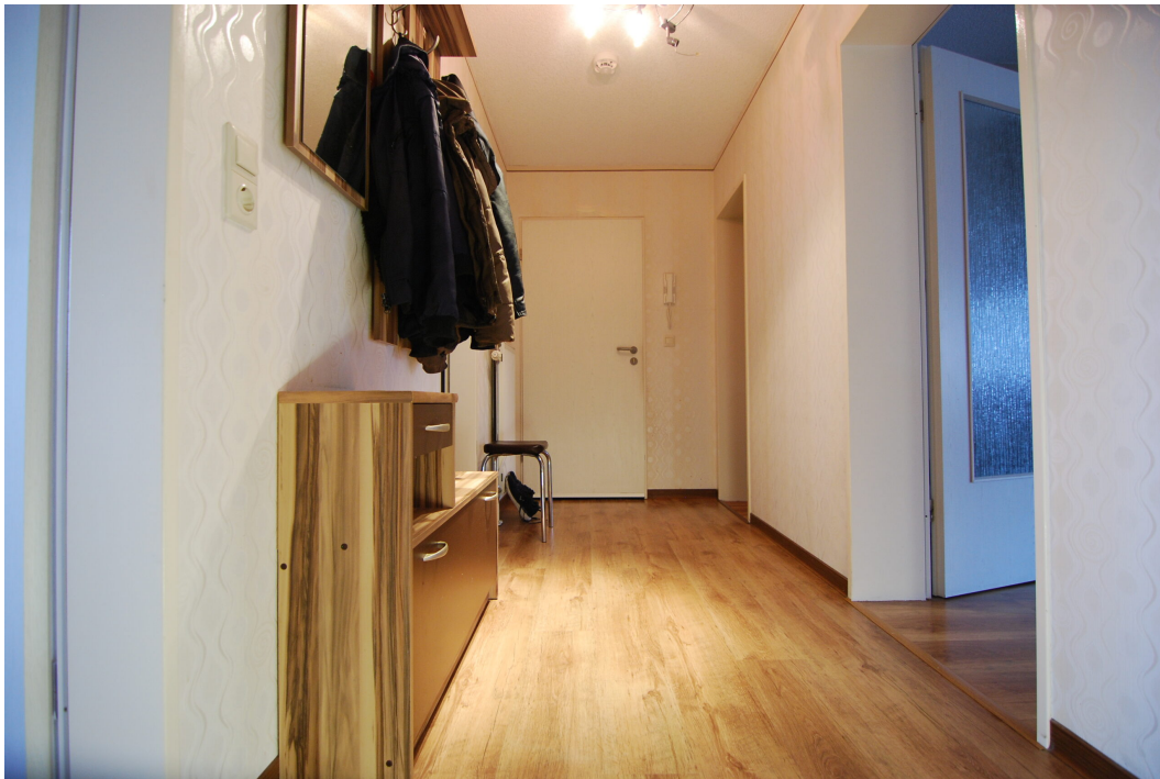
Apostelstiege30 10Gre Flur 3