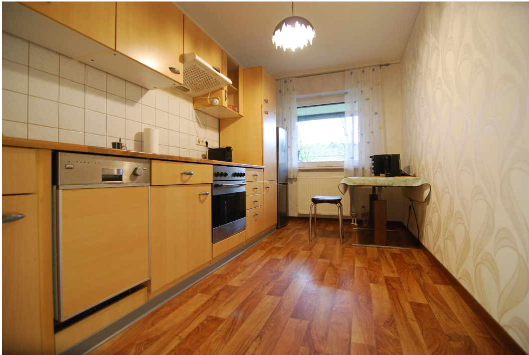
Apostelstiege30 10Gre Kueche 4