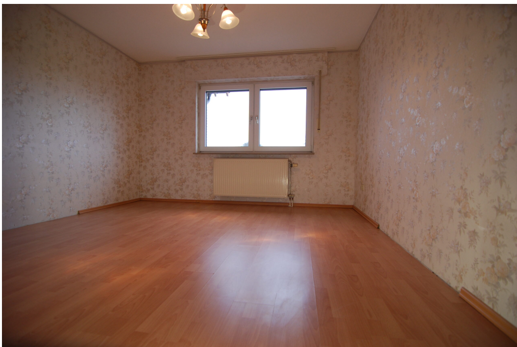
Apostelstiege30 10Gre Schlafzimmer 3