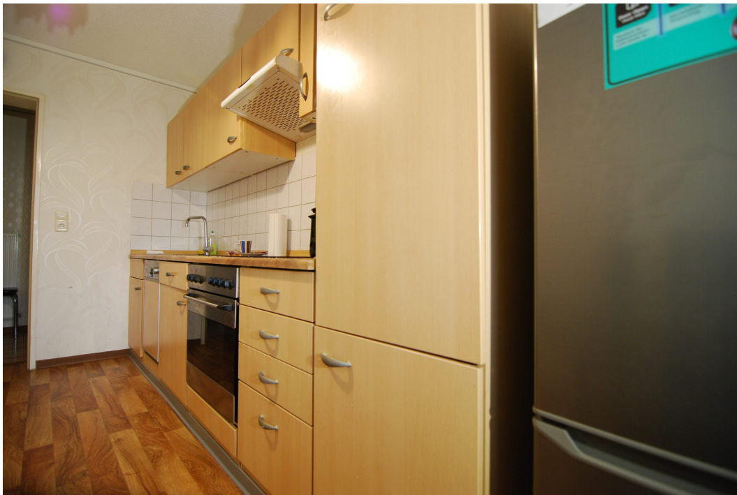
Apostelstiege30 10Gre Kueche 1