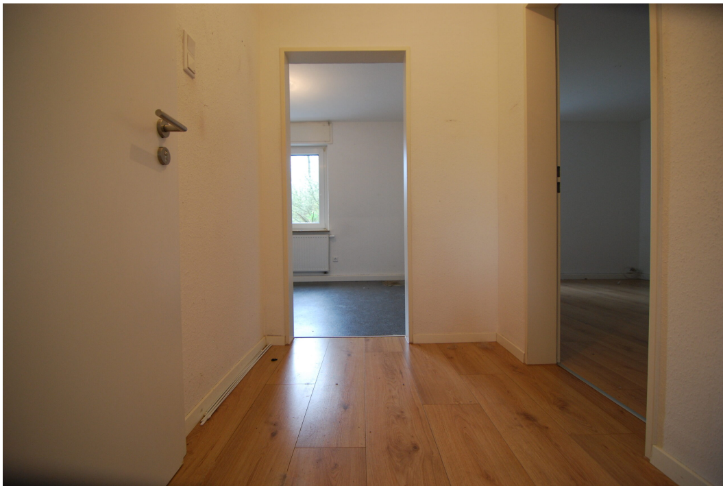
MarlerStrasse21 EG Flur 3