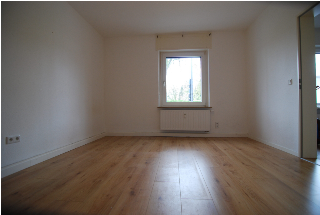
MarlerStrasse21 EG Schlafzimmer 4