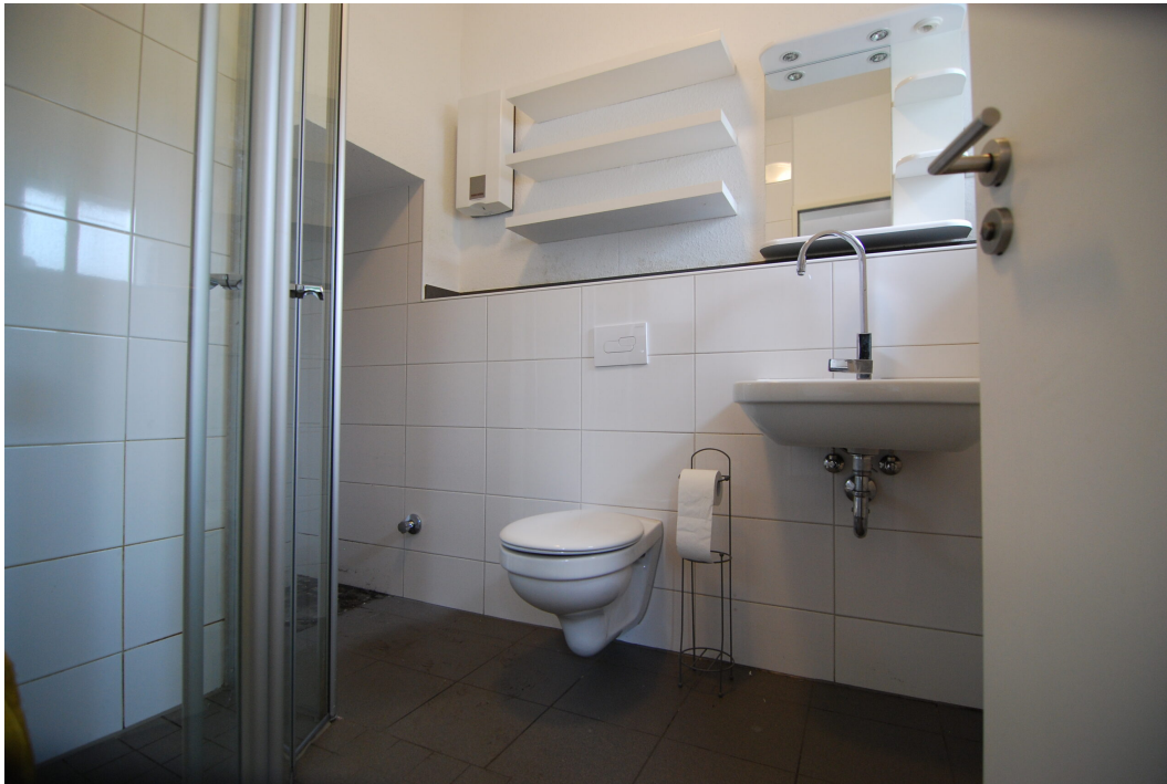
MarlerStrasse21 EG Bad 1