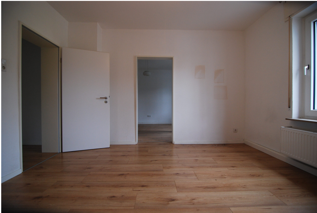
MarlerStrasse21 EG Wohnzimmer 4