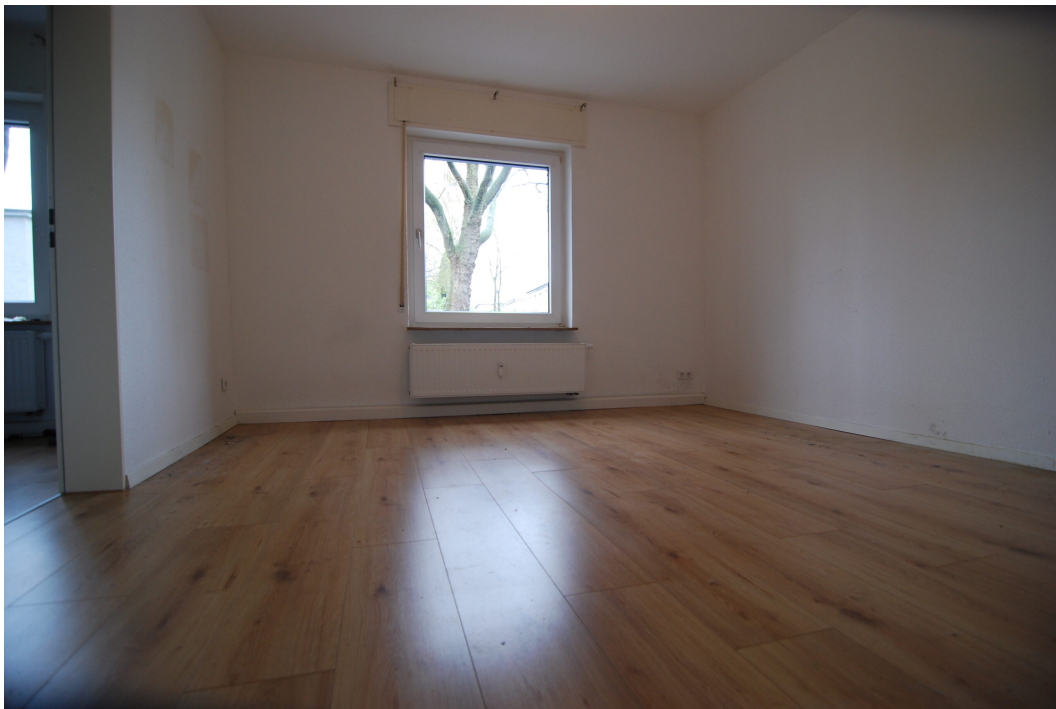
MarlerStrasse21 EG Wohnzimmer 1