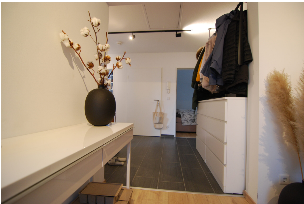
AmWasserturm14 DG Flur 1