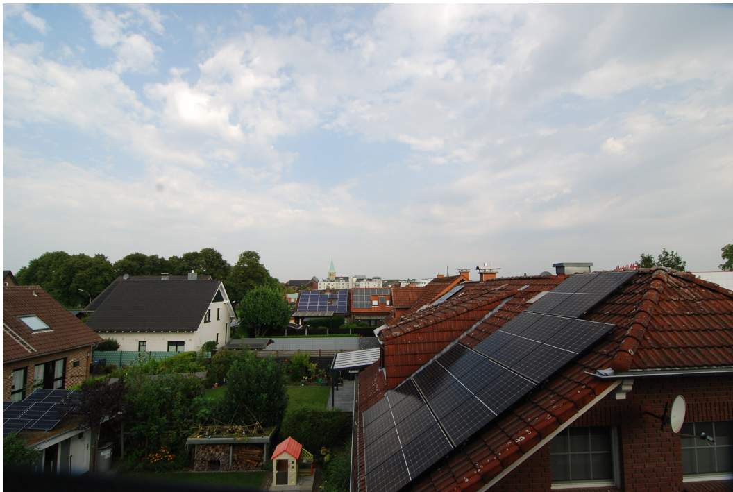
AmWasserturm14 DG Balkon Aussicht 1