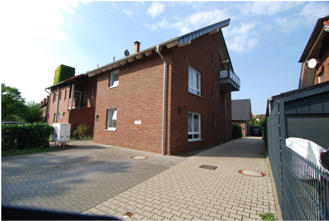
AmWasserturm14 SeitenVorderansicht 1