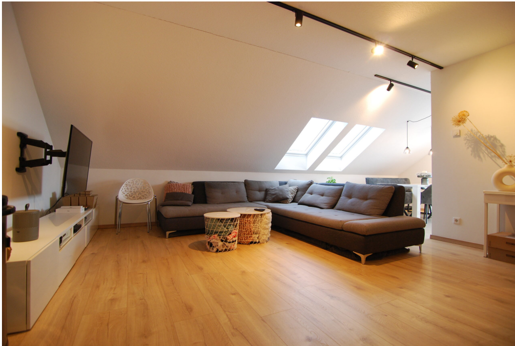
AmWasserturm14 DG Wohnzimmer 2