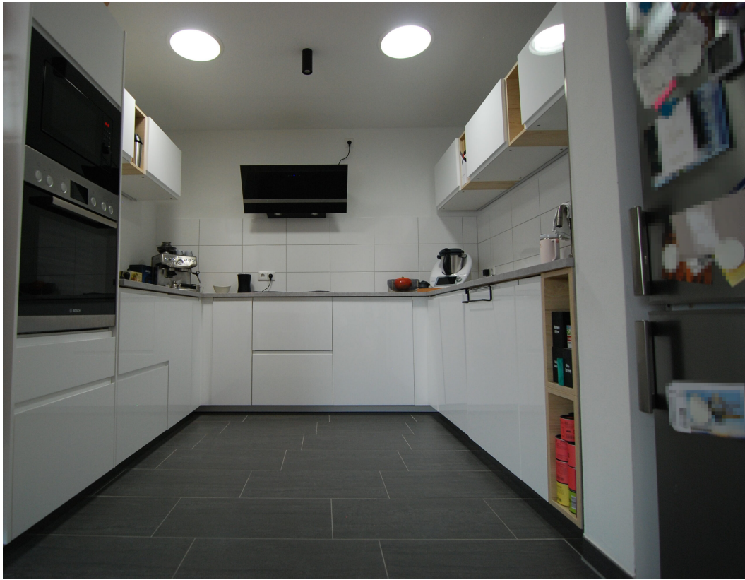
AmWasserturm14 DG Kueche 4