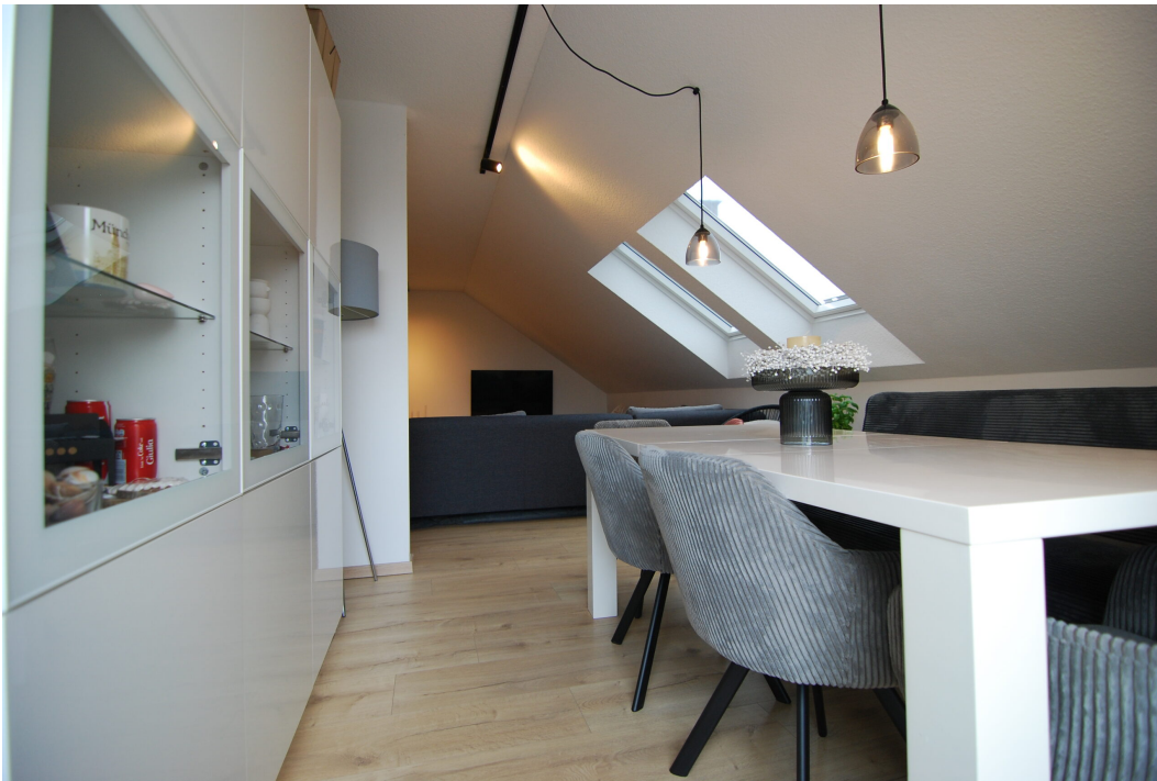
AmWasserturm14 DG Esszimmer 2