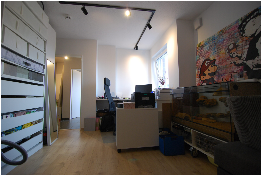
AmWasserturm14 DG Kinderzimmer 2