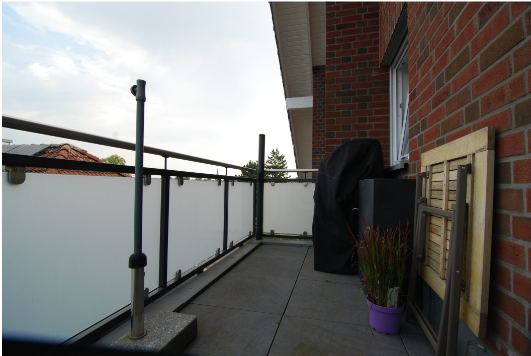
AmWasserturm14 DG Balkon 2