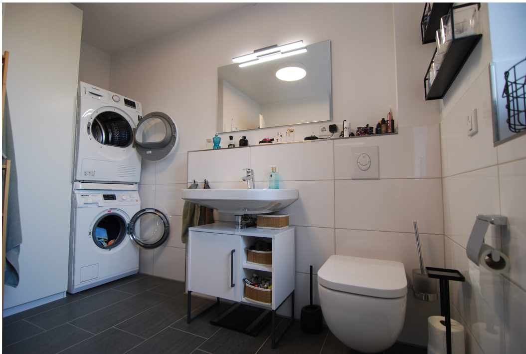
AmWasserturm14 DG Bad 7