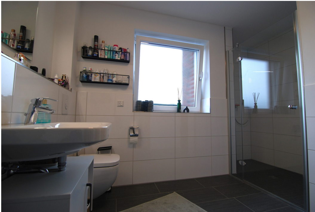
AmWasserturm14 DG Bad 6