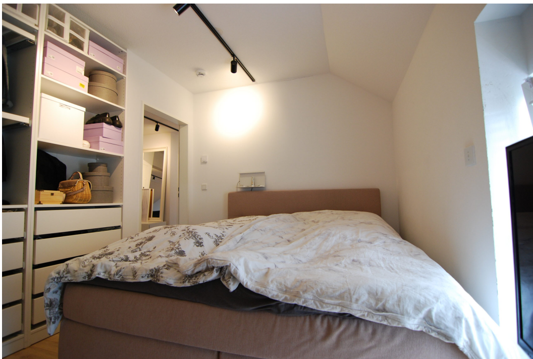
AmWasserturm14 DG Schlafzimmer 3