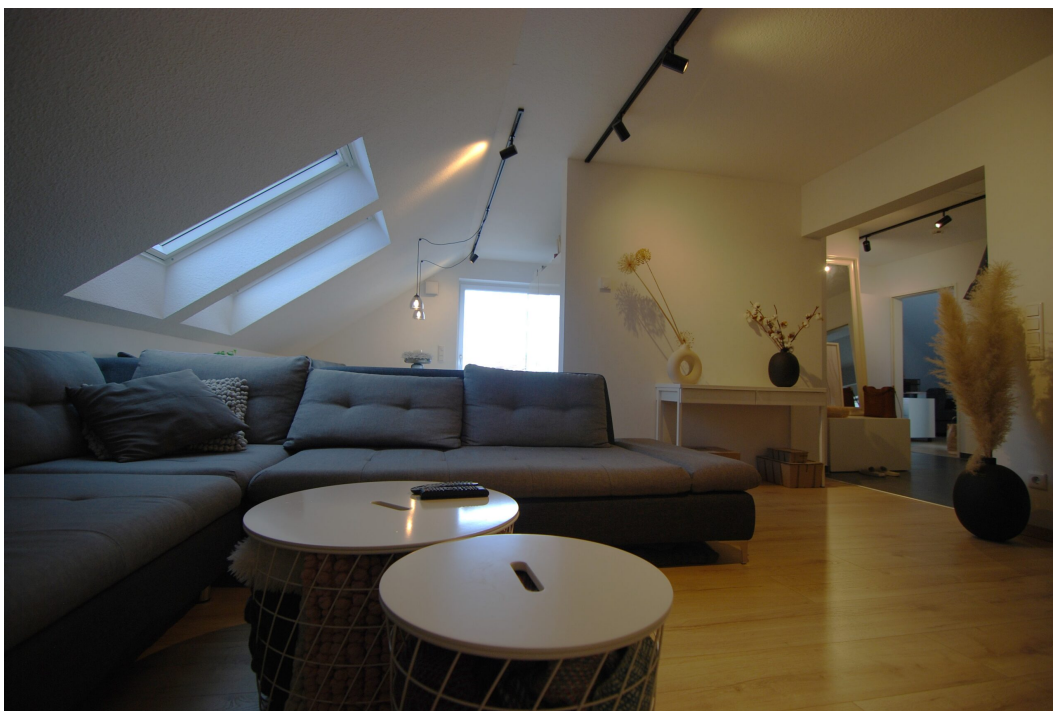
AmWasserturm14 DG Wohnzimmer 4