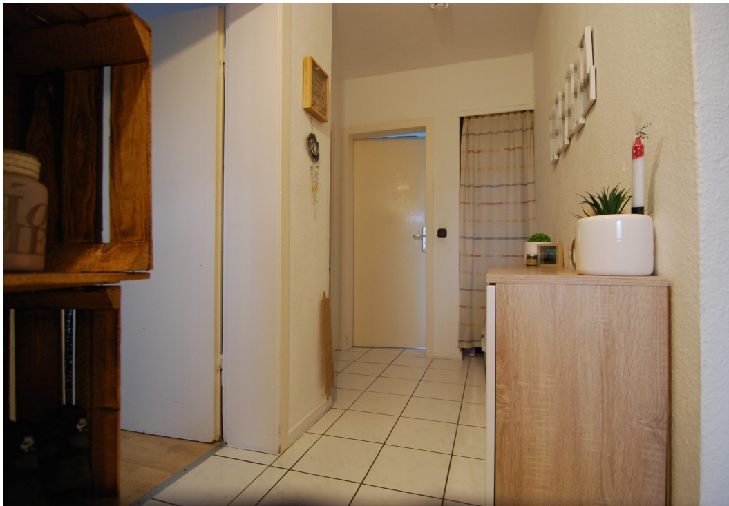
DoerksKamp5 20Glinks Flur 2