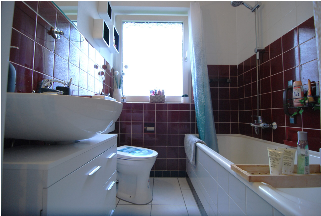
DoerksKamp5 2OGlinks Bad 2