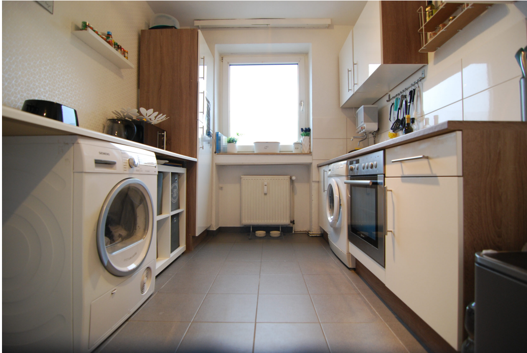
DoerksKamp5 20Glinks Kueche 1