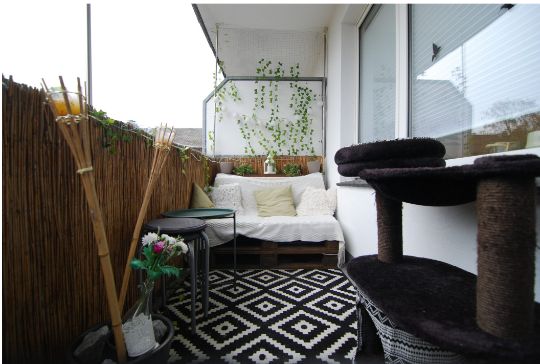
DoerksKamp5 2OGlinks Balkon 1