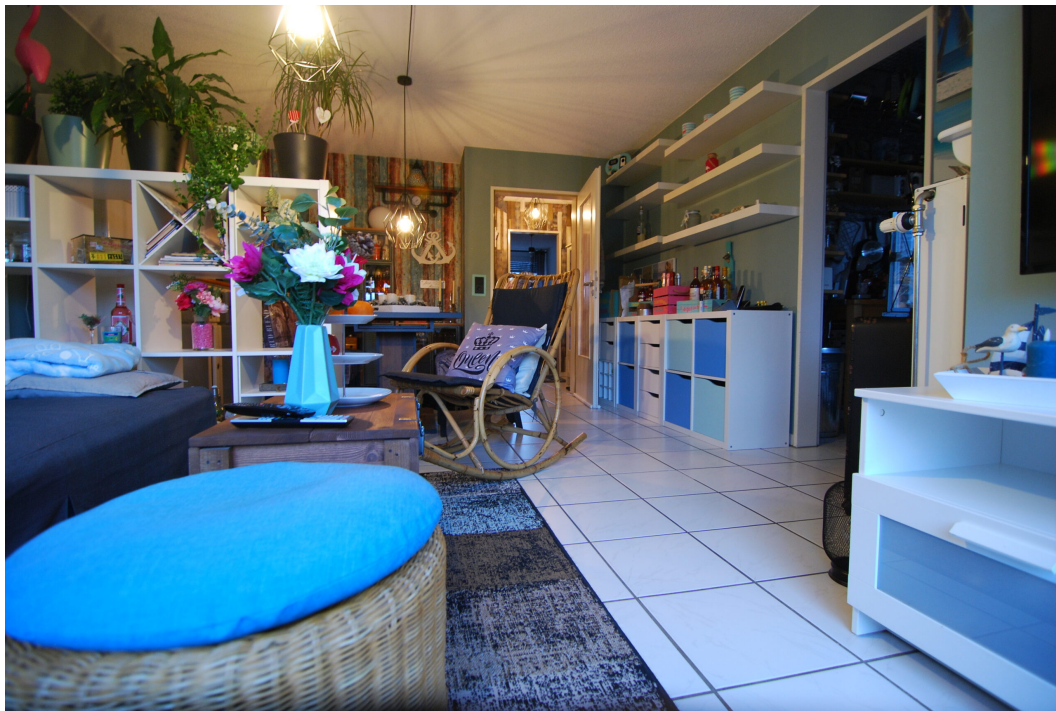
Apostelstiege28 DGLi Wohnzimmer 2