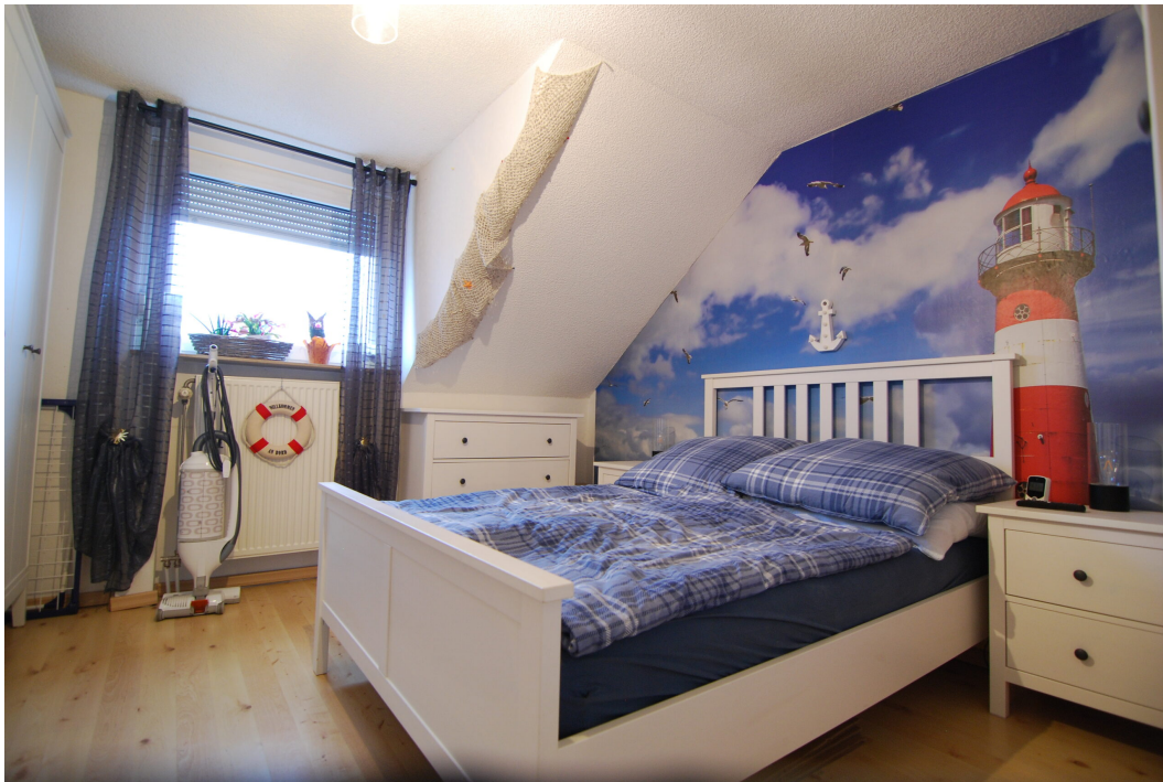
Apostelstiege28 DGli Schlafzimmer 1