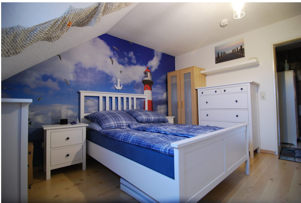
Apostelstiege28 DGli Schlafzimmer 3