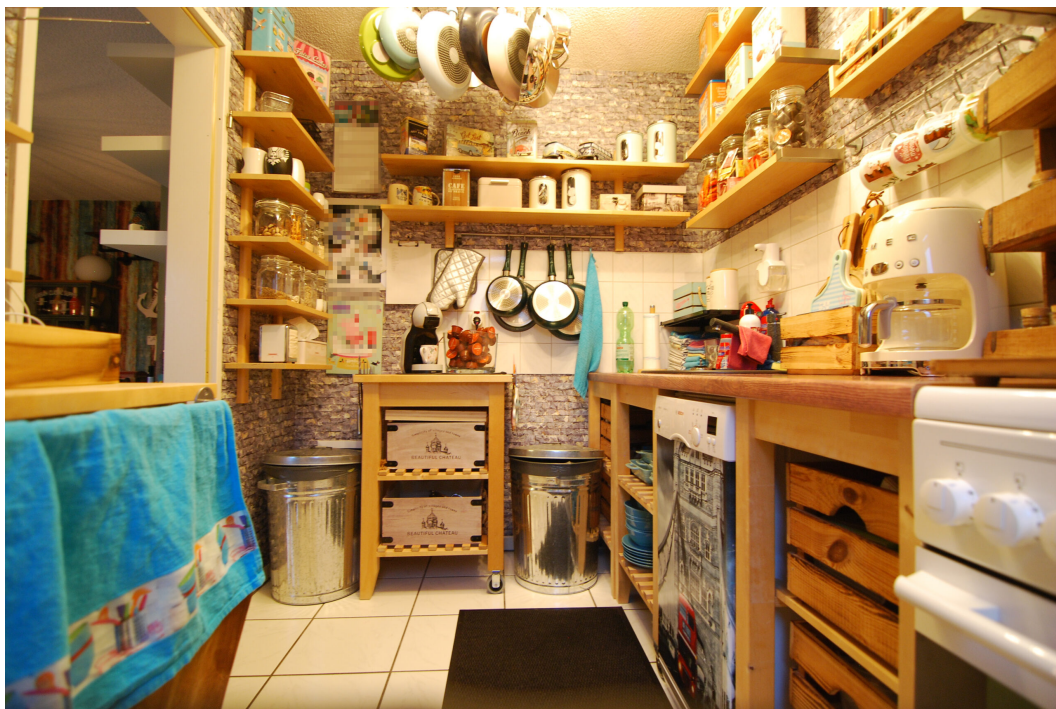
Apostelstiege28 DGLi Kueche 2