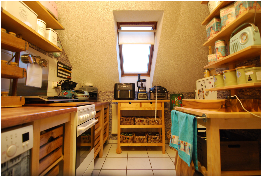
Apostelstiege28 DGli Kueche 1