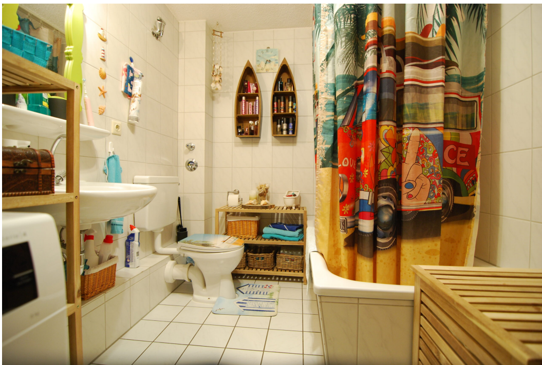
Apostelstiege28 DGli Bad 1