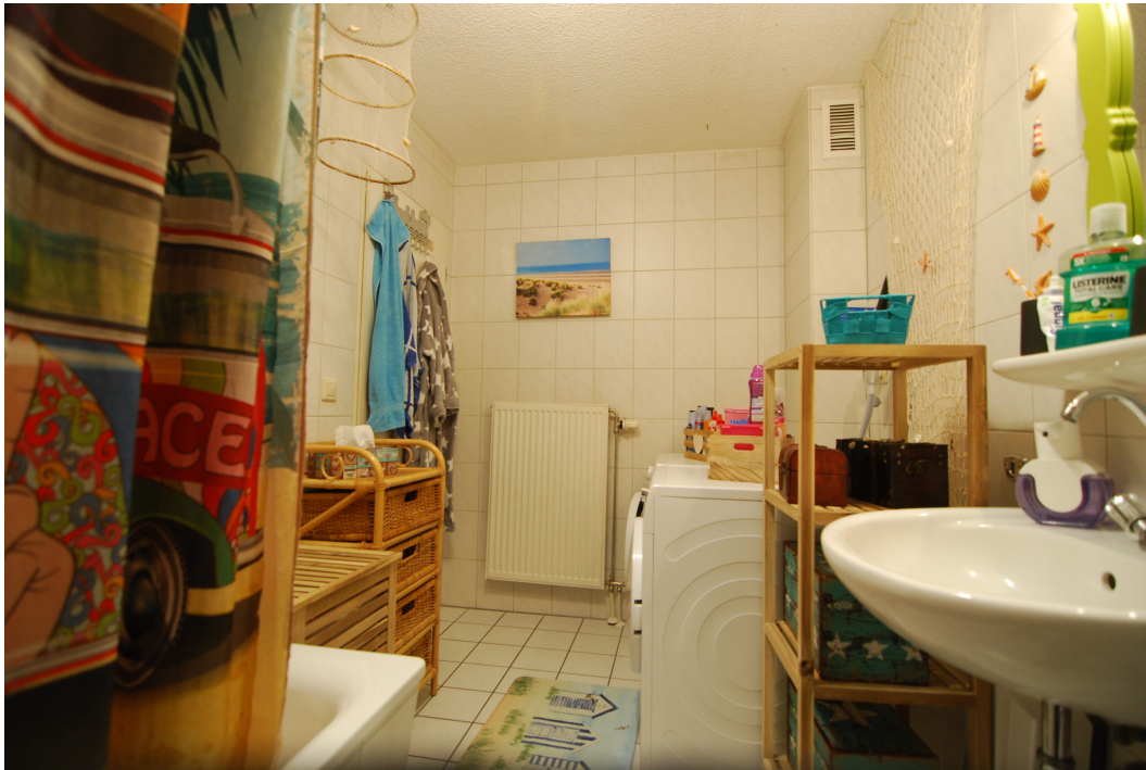
Apostelstiege28 DGli Bad 4