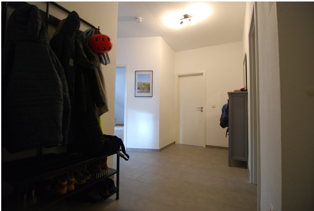
Marderweg25 DG Flur 2