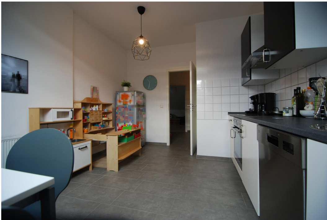
Marderweg25 DG Kueche 6