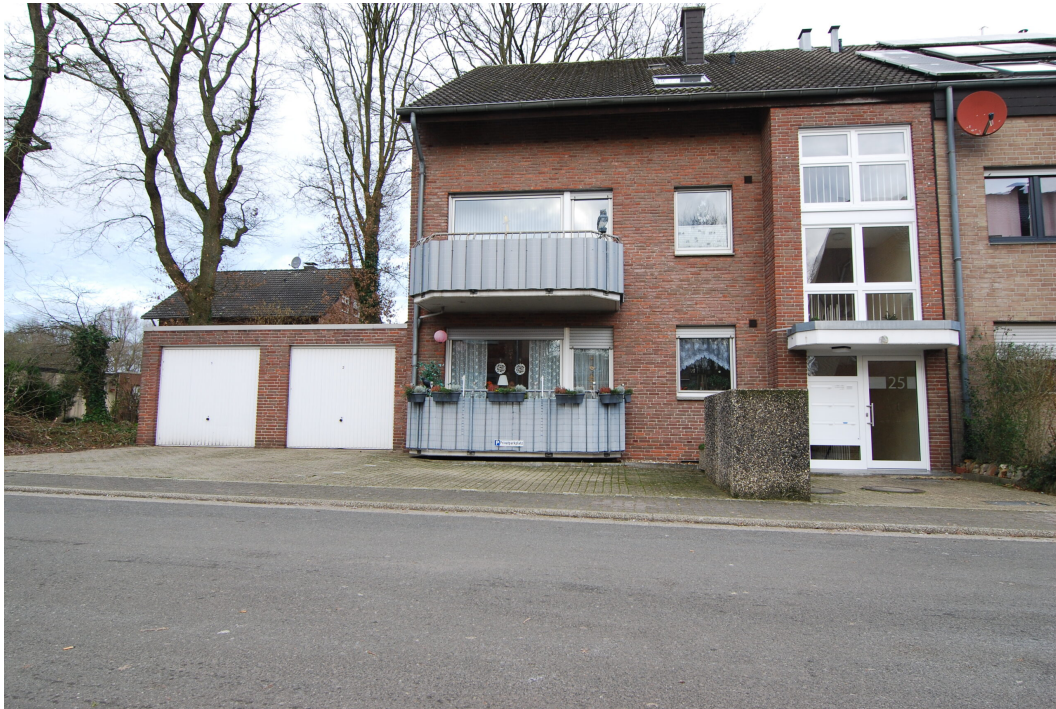
Marderweg 25 Vorderansicht 2 140125