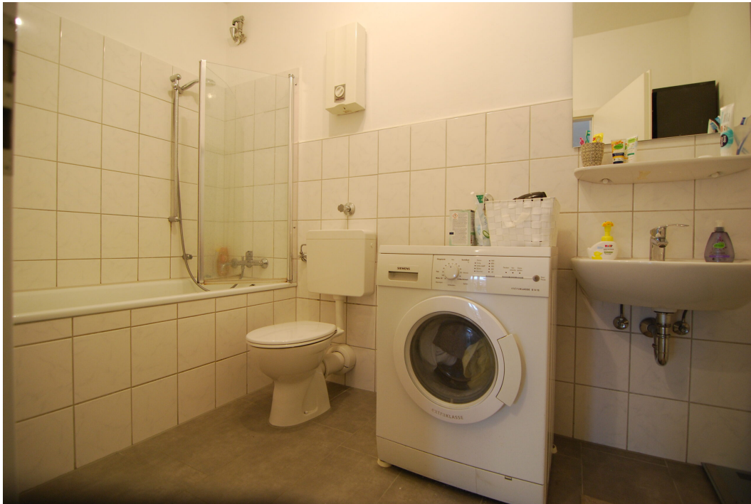
Marderweg25 DG Bad 4