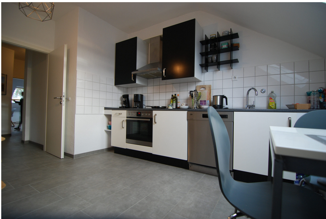
Marderweg25 DG Kueche 5