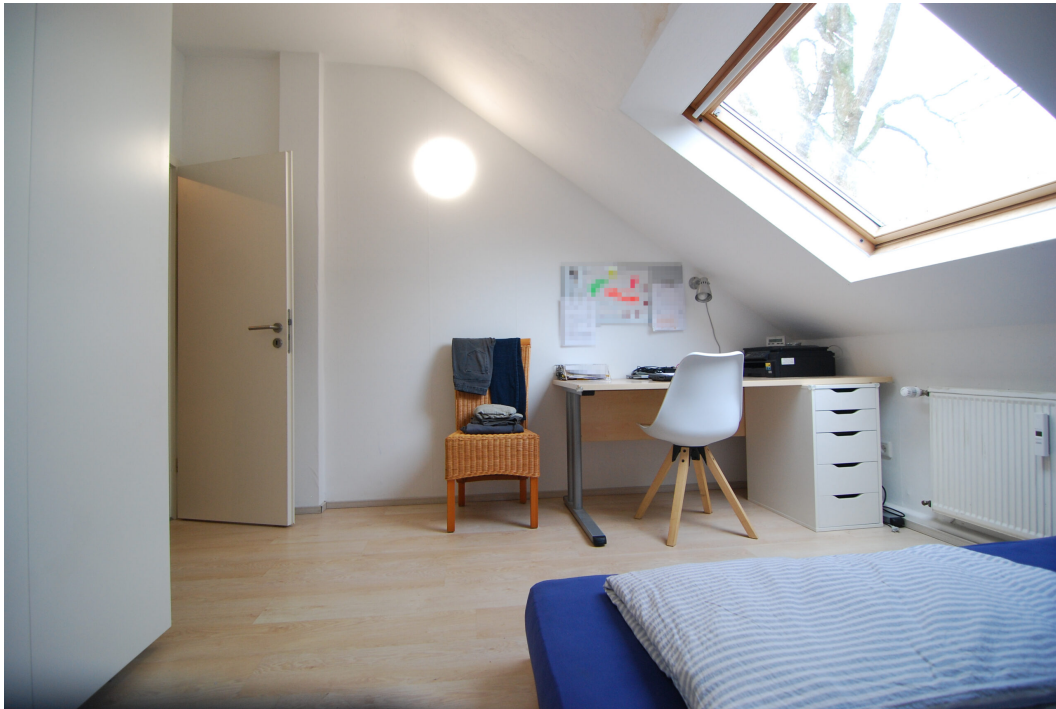
Marderweg25 DG Kinderzimmer 3