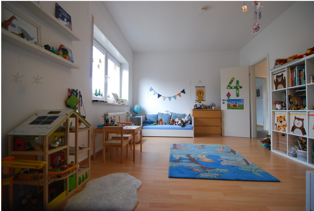
Marderweg25 DG Schlafzimmer 5