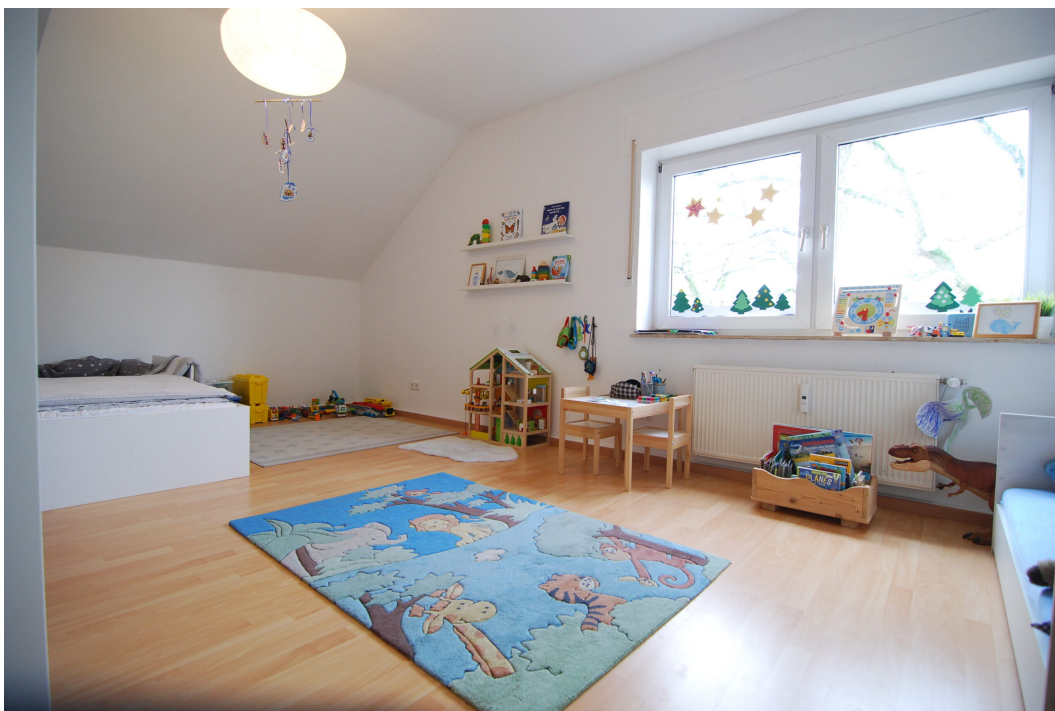
Marderweg25 DG Schlafzimmer 2