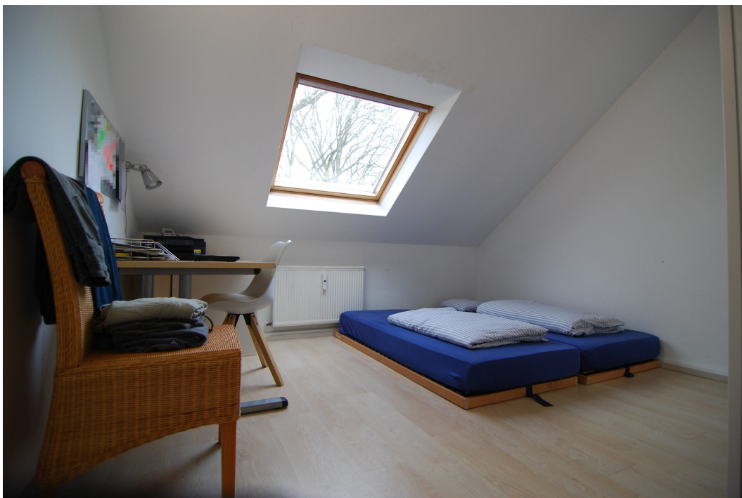
Marderweg25 DG Kinderzimmer 1