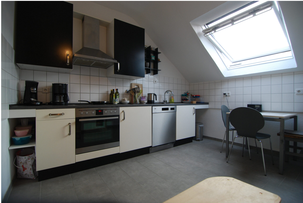
Marderweg25 DG Kueche 7