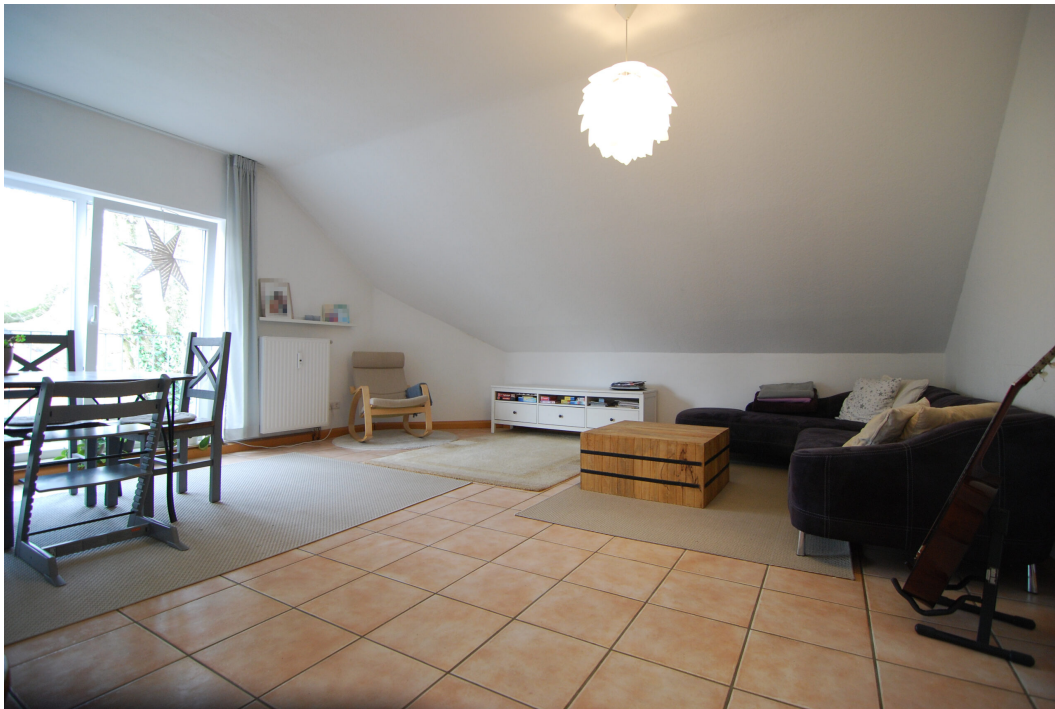
Marderweg25 DG Wohnzimmer 1