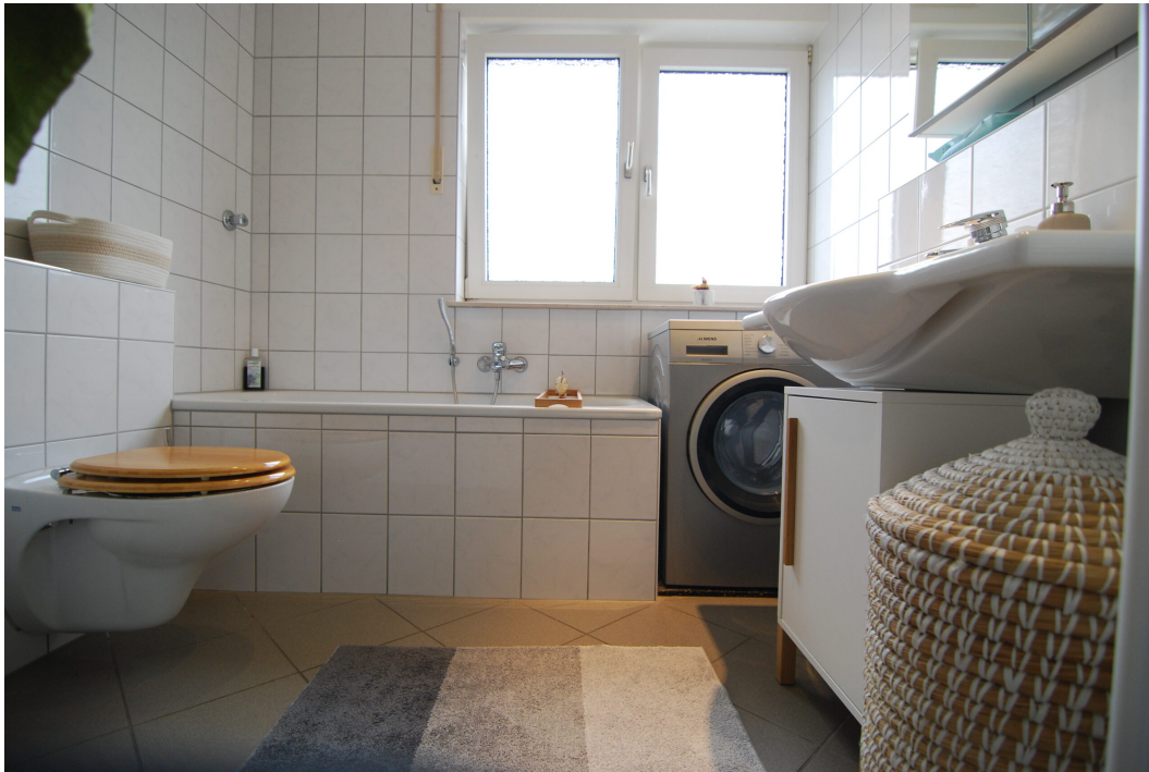
Hubertusstr4 10Gre Bad 2