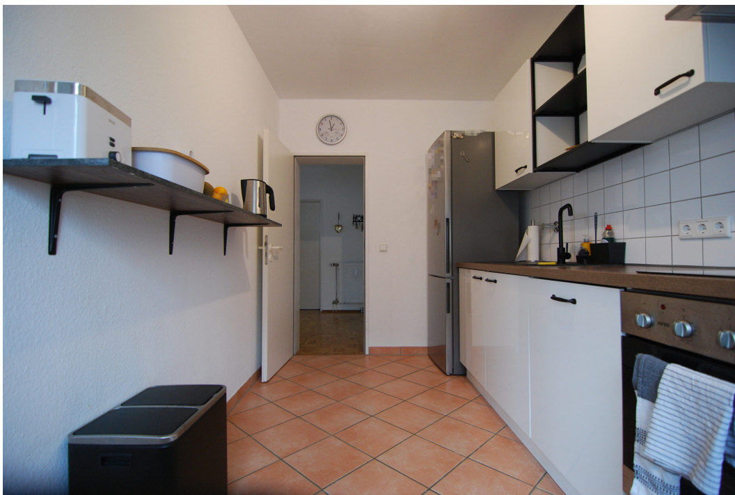
Hubertustr4 10Gre Kueche 5