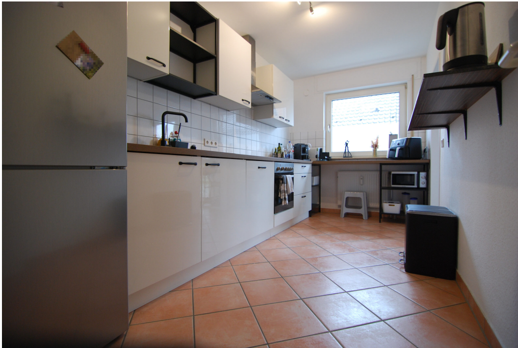
Hubertustr4 10Gre Kueche 1