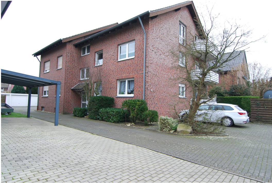
Hubertusstr4 Vorderansicht 1 140125