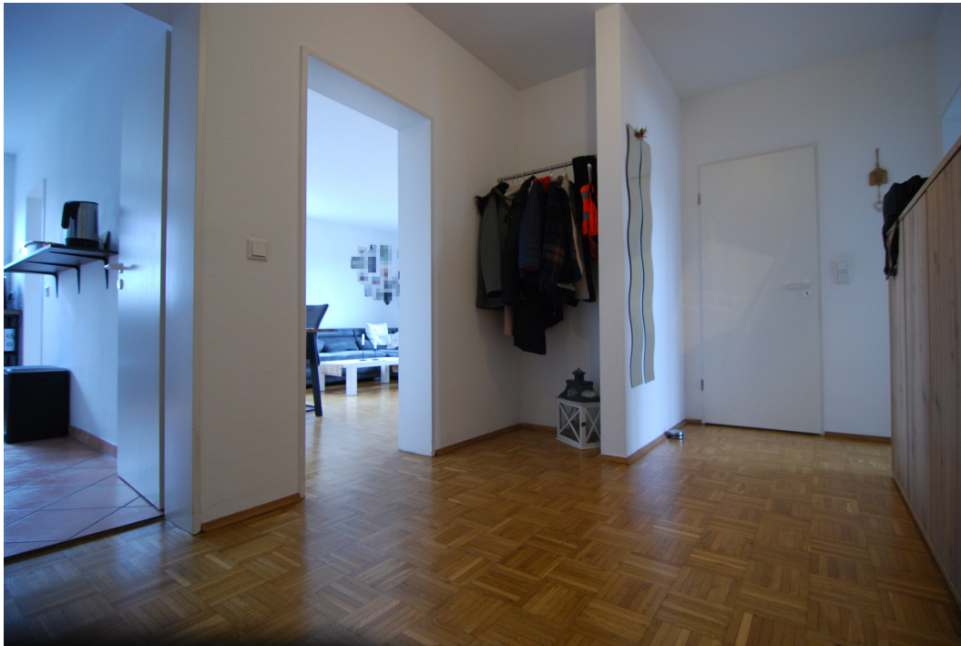
Hubertusstr4 10Gre Flur 4