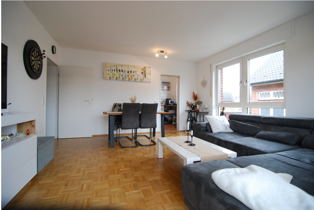
Hubertusstr4 10Gre Wohnzimmer 5