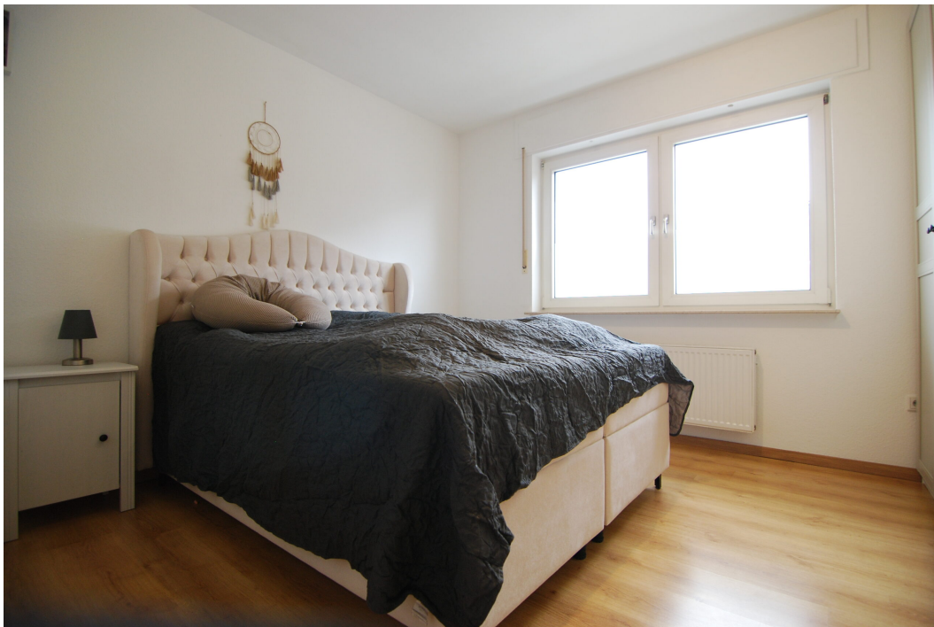
Hubertusstr4 10Gre Schlafzimmer 1