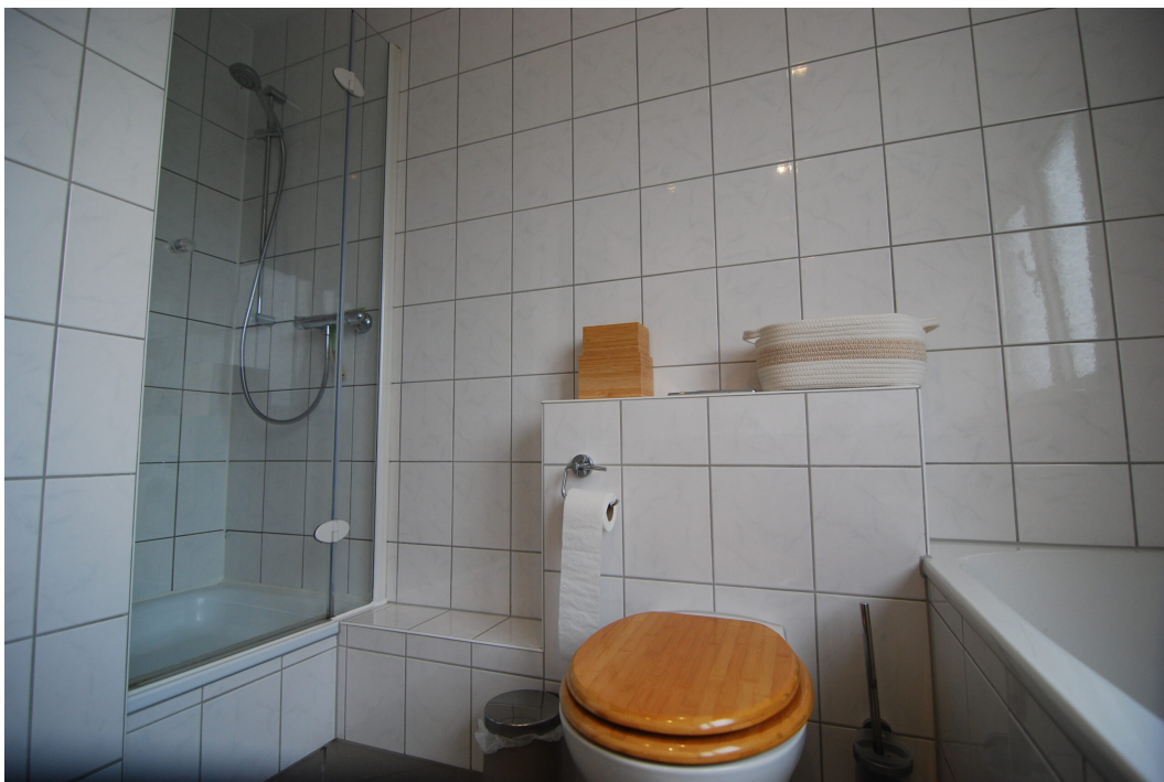
Hubertusstr4 10Gre Bad 4