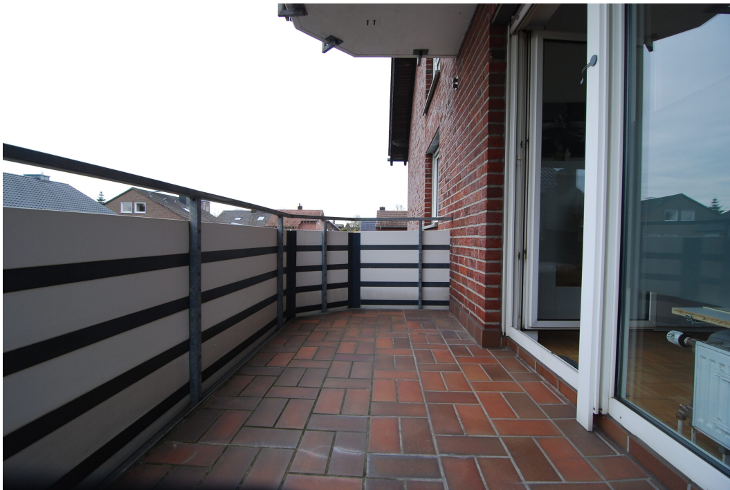
Hubertusstr4 10Gre Balkon 2