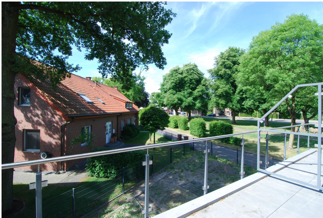
Frankenstraße2 10Glinks Balkon2