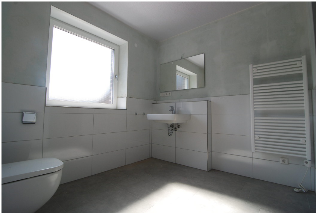
Frankenstraße2 10Glinks Bad3