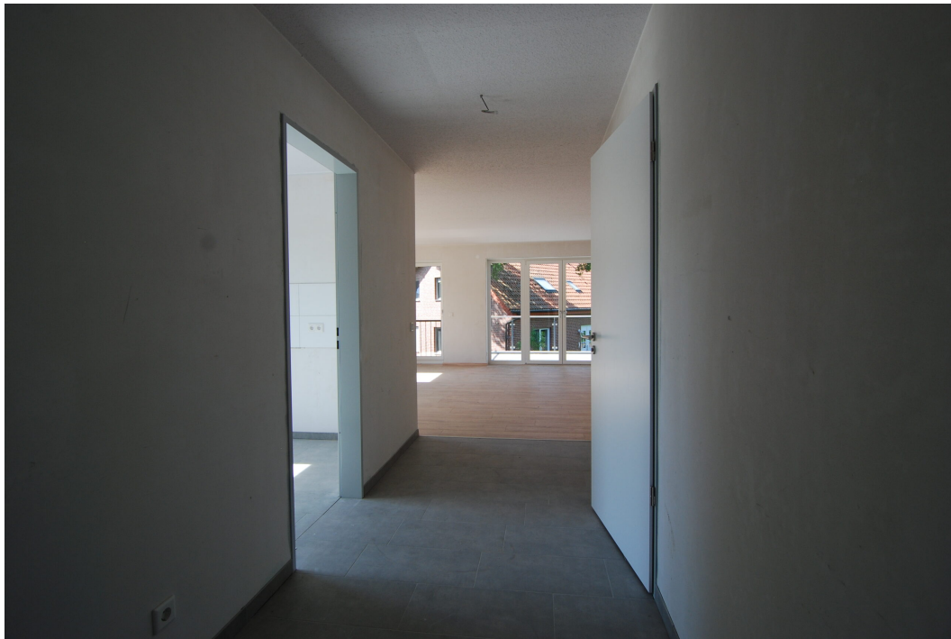
Frankenstraße2 10Glinks Flur1