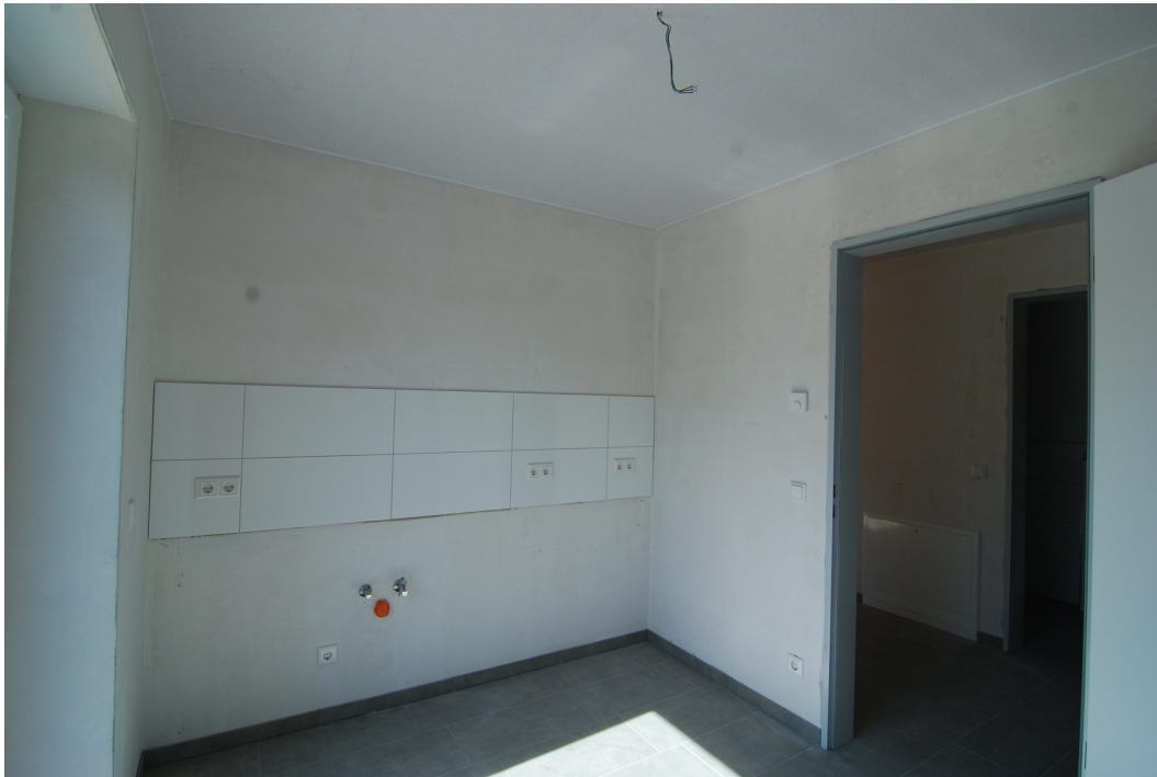
Frankenstraße2 10Glinks Kueche2