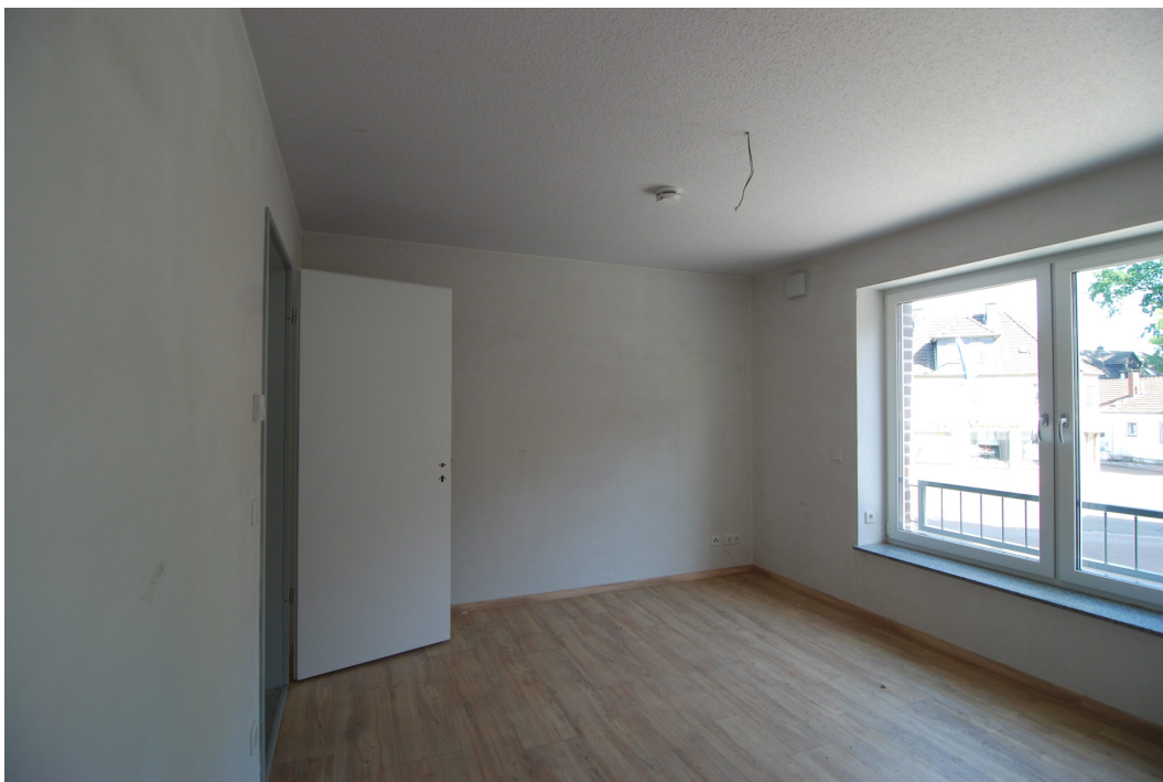
Frankenstraße2 10Glinks Schlafen2