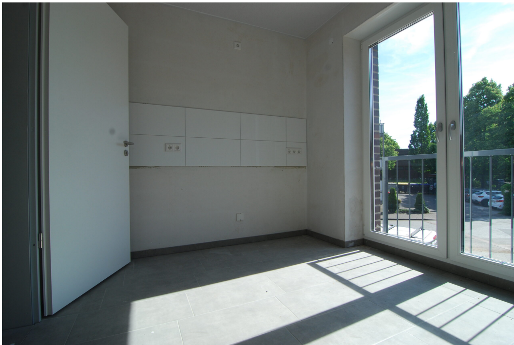
Frankenstraße2 10Glinks Kueche4