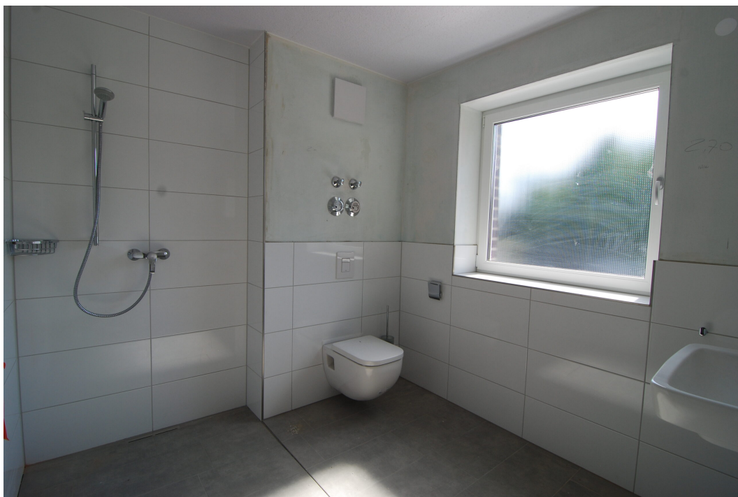
Frankenstraße2 10Glinks Bad2