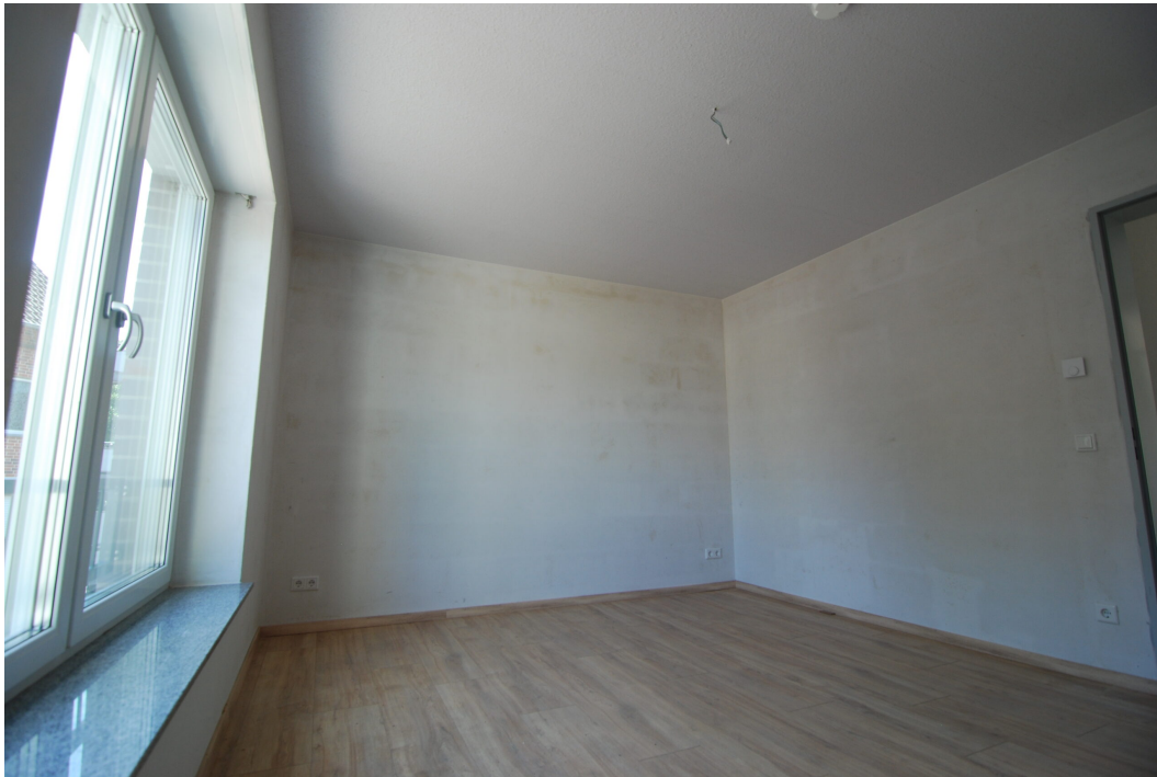
Frankenstraße2 10Glinks Schlafen1