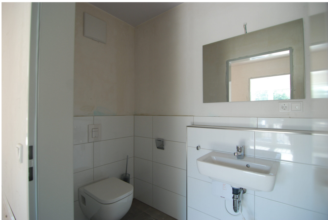
Frankenstraße2 10Glinks GaesteWC1