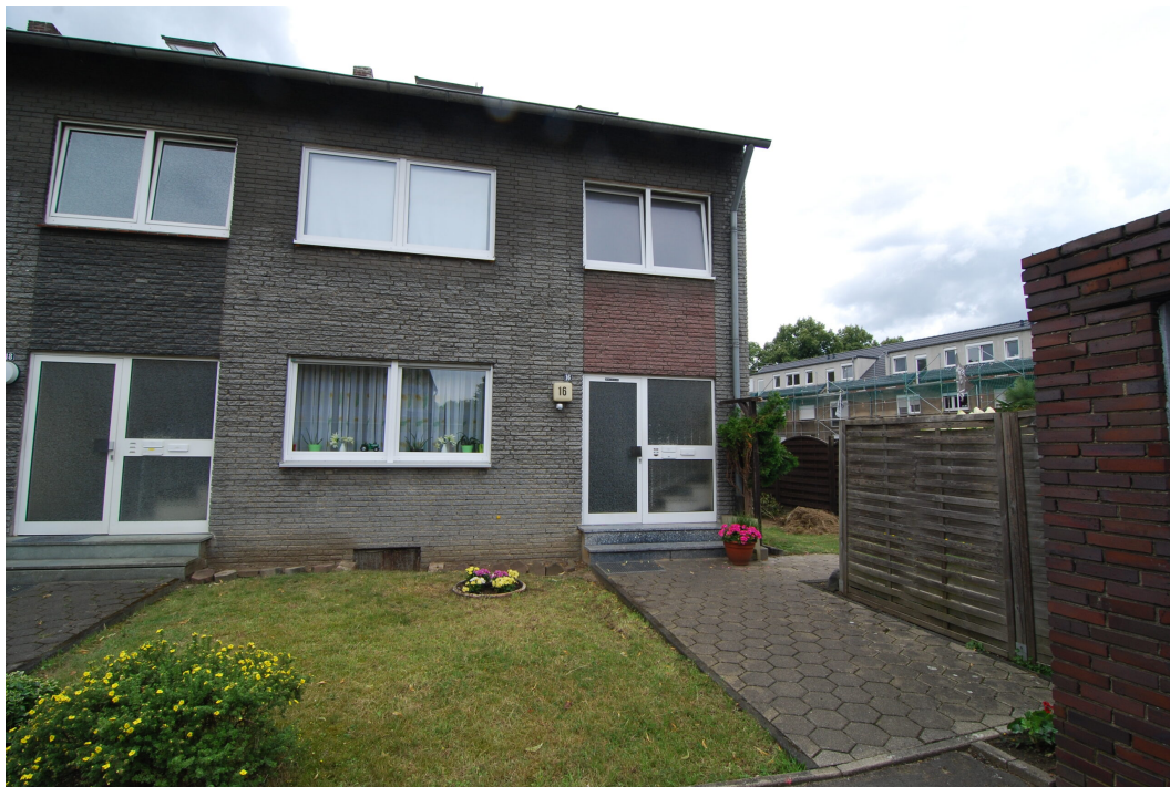
Vogelsang16 Vorderansicht 1 210725