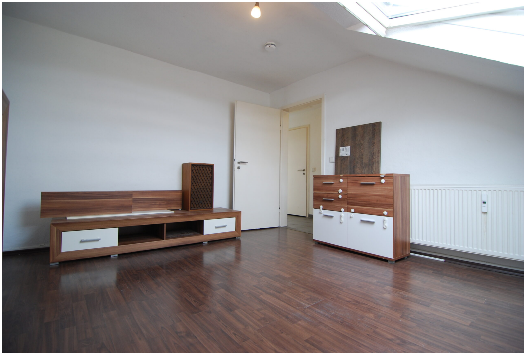
Vogelsang16 DG Schlafzimmer 5