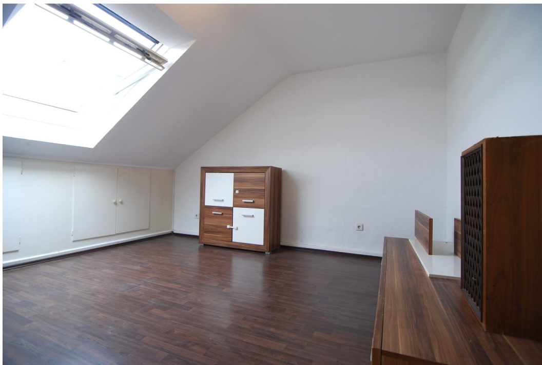
Vogelsang16 DG Schlafzimmer 1