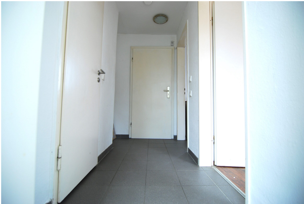
Vogelsang16 DG Flur 1