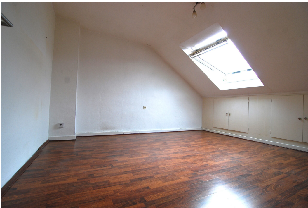
Vogelsang16 DG Wohnzimmer 1