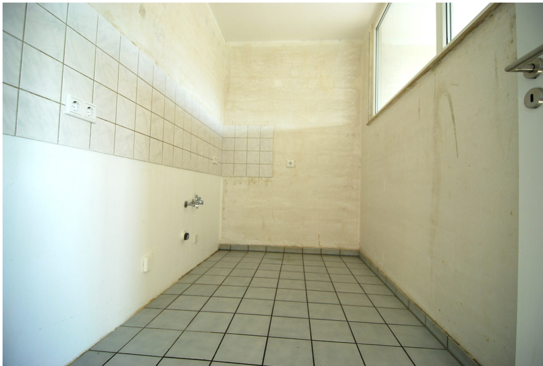
Ellerbruchstrasse121 3OGMitte Kueche 2