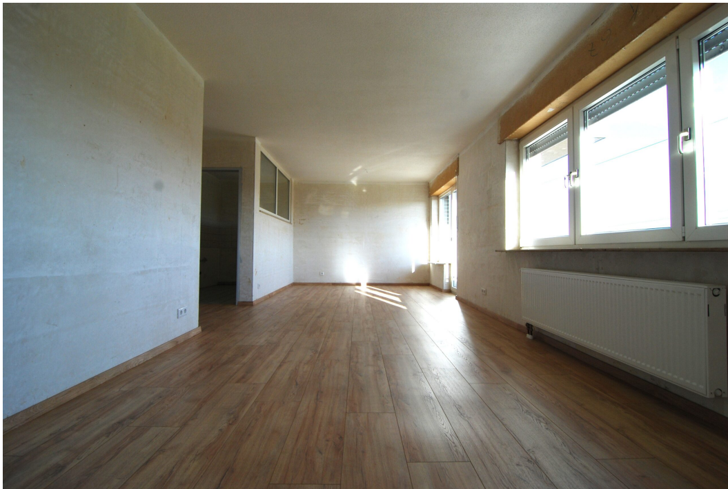
Ellerbruchstrasse121 3OGMitte Wohnzimmer 1