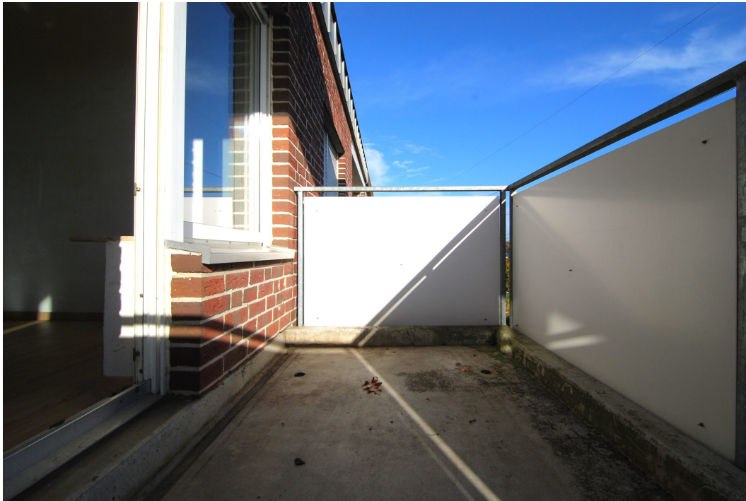
Ellerbruchstrasse121 3OGMitte Balkon 1