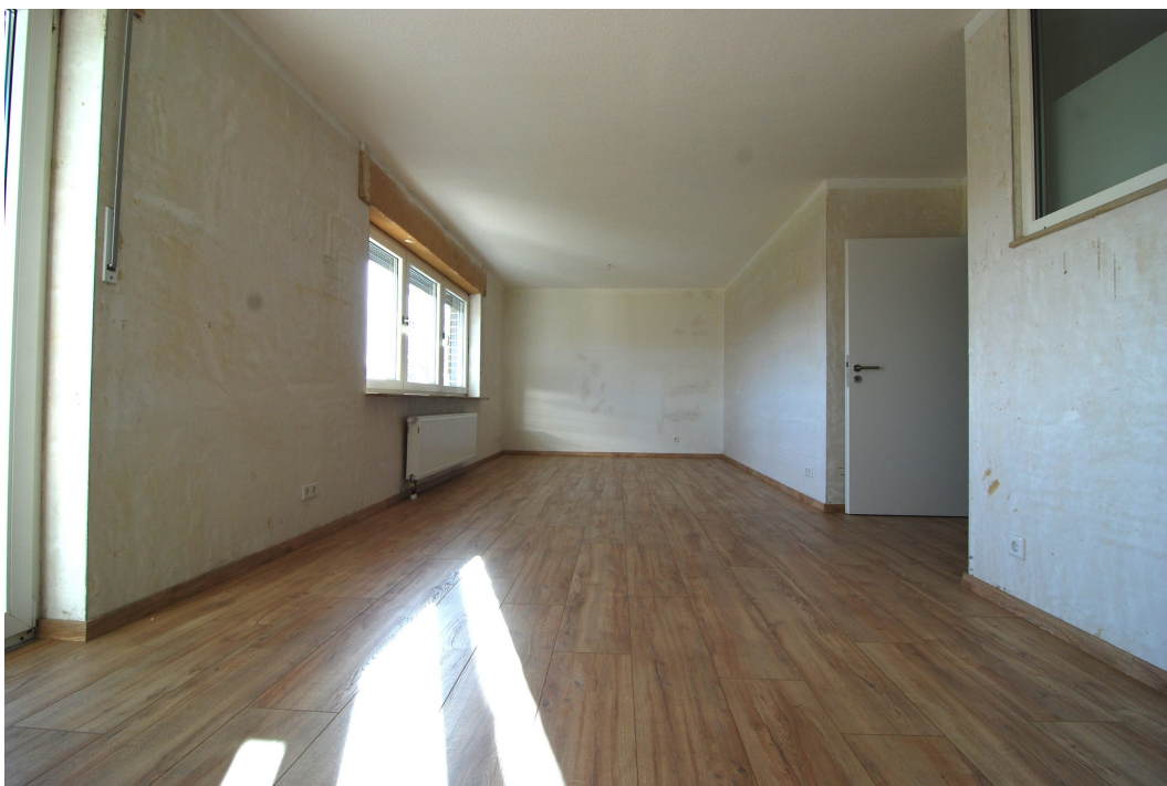
Ellerbruchstrasse121 3OGMitte Wohnzimmer 3