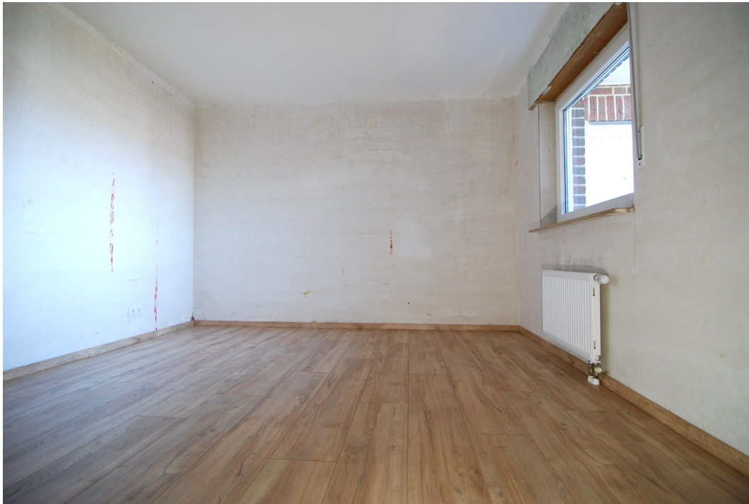
Ellerbruchstrasse121 3OGMitte Schlafimmer 1