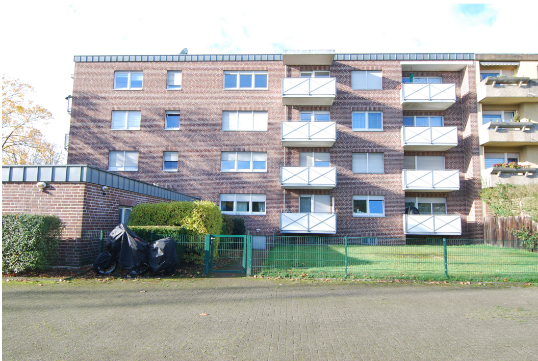
Ellerbruchstrasse121 Rueckansicht 2 031125