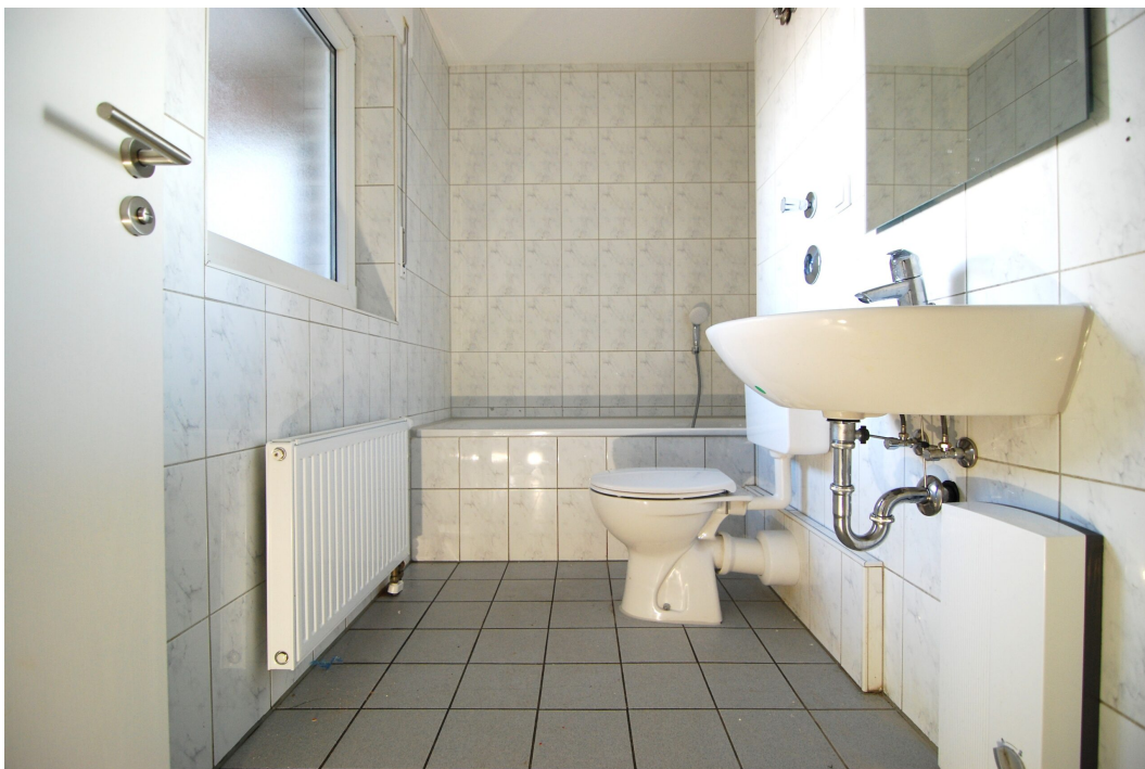
Ellerbruchstrasse121 3OGMitte Bad 1