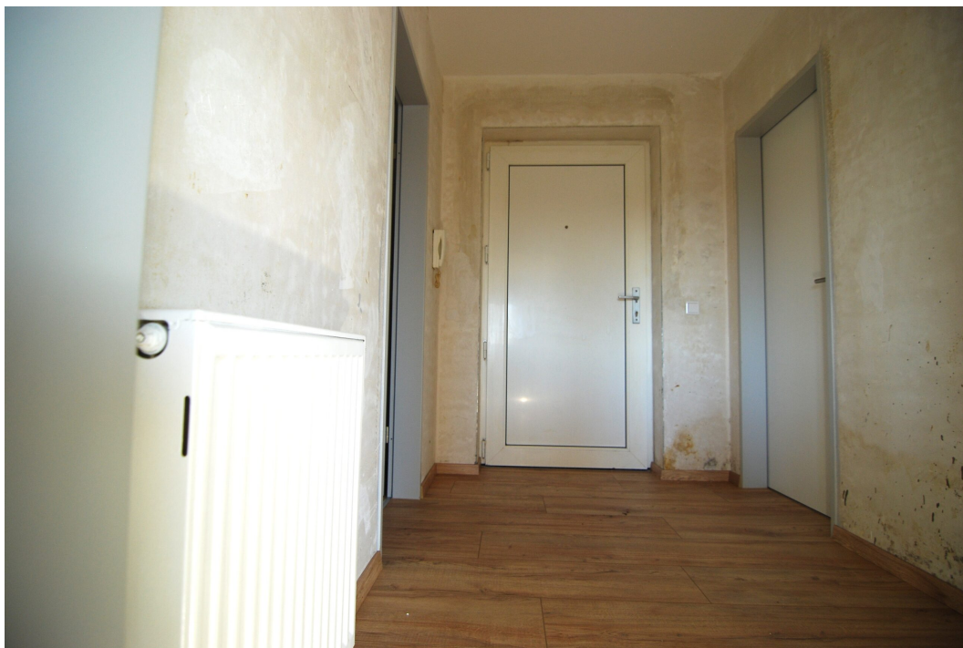
Ellerbruchstrasse121 3OGMitte Flur 2