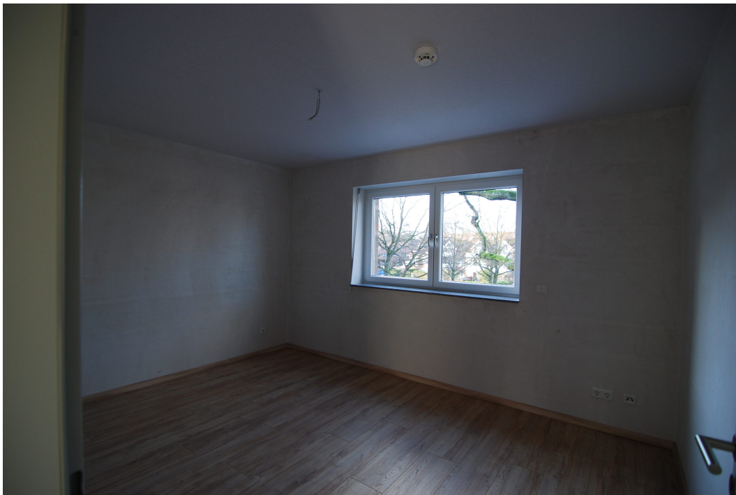
Marderweg76 2OG Kind