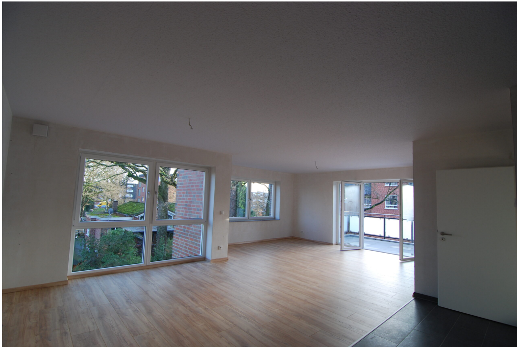
Marderweg76 2OG WohnKueche2