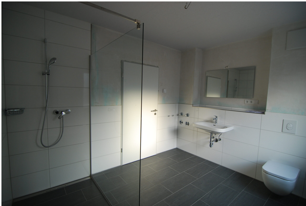
Marderweg76 2OG Bad