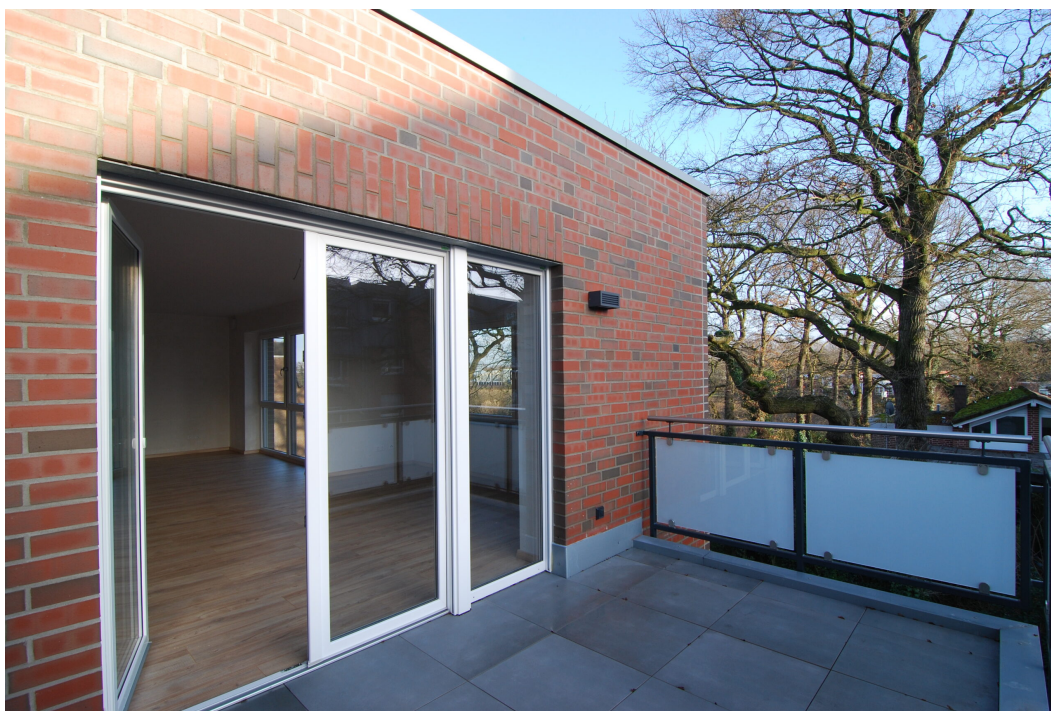
Marderweg76 2OG Balkon