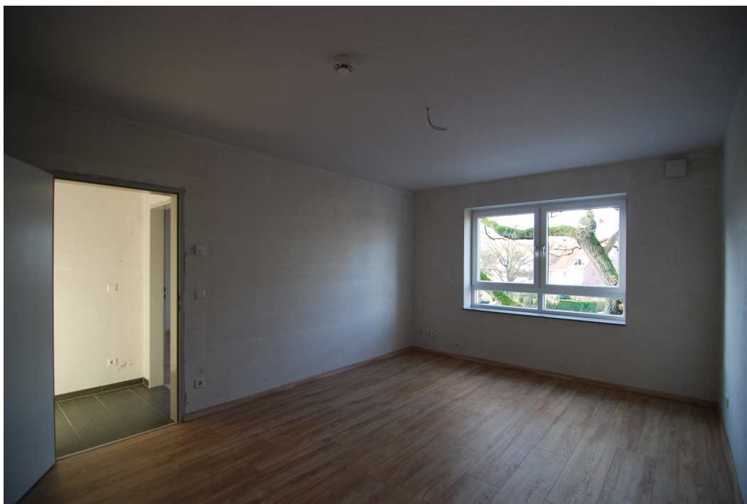
Marderweg76 2OG Eltern2