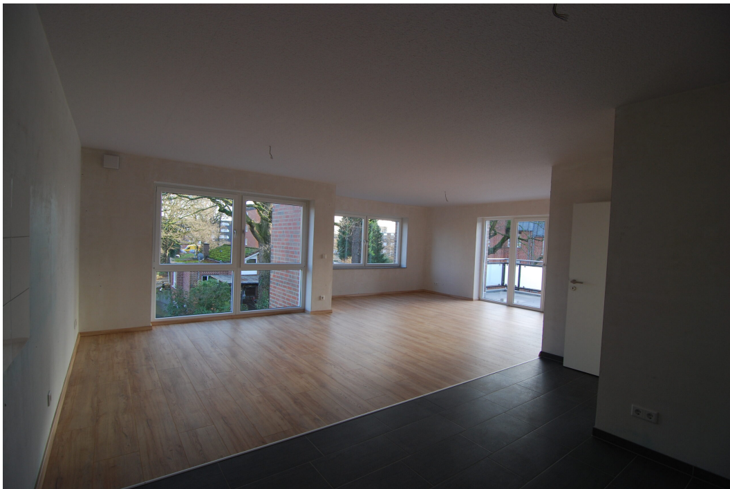
Marderweg76 2OG Wohnen2