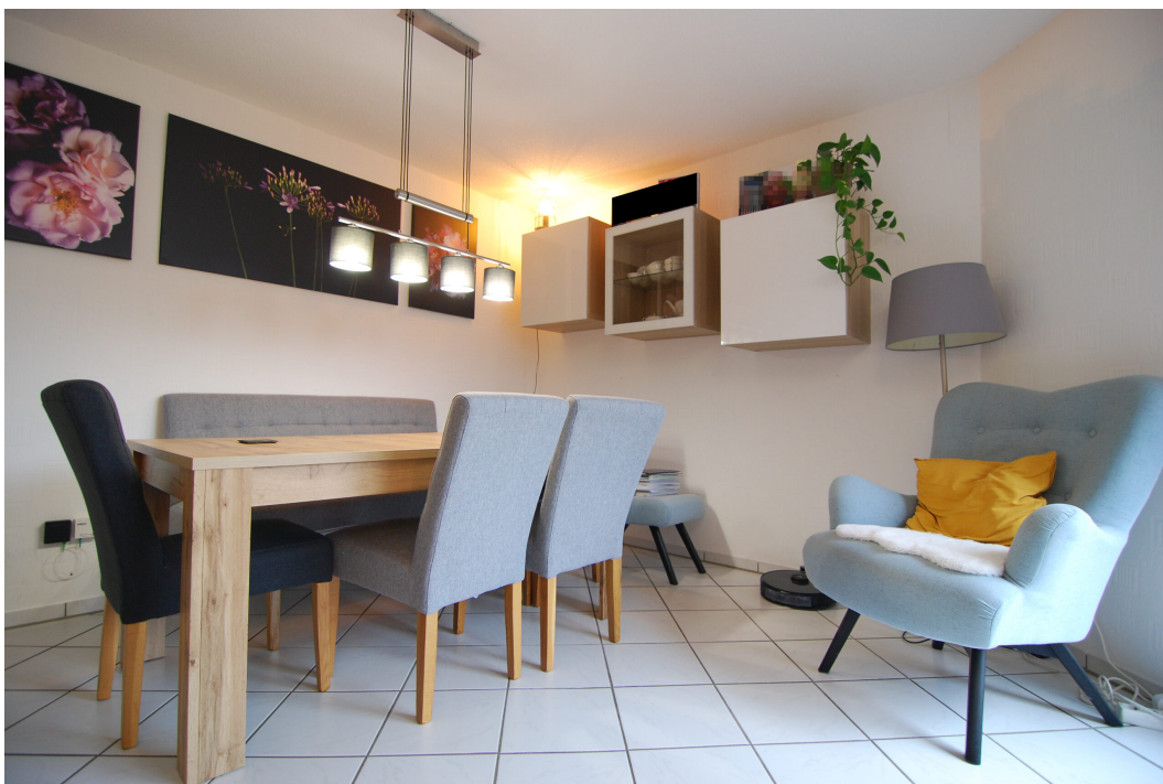
ImEnnewaelken23 DGre Wohnzimmer 7