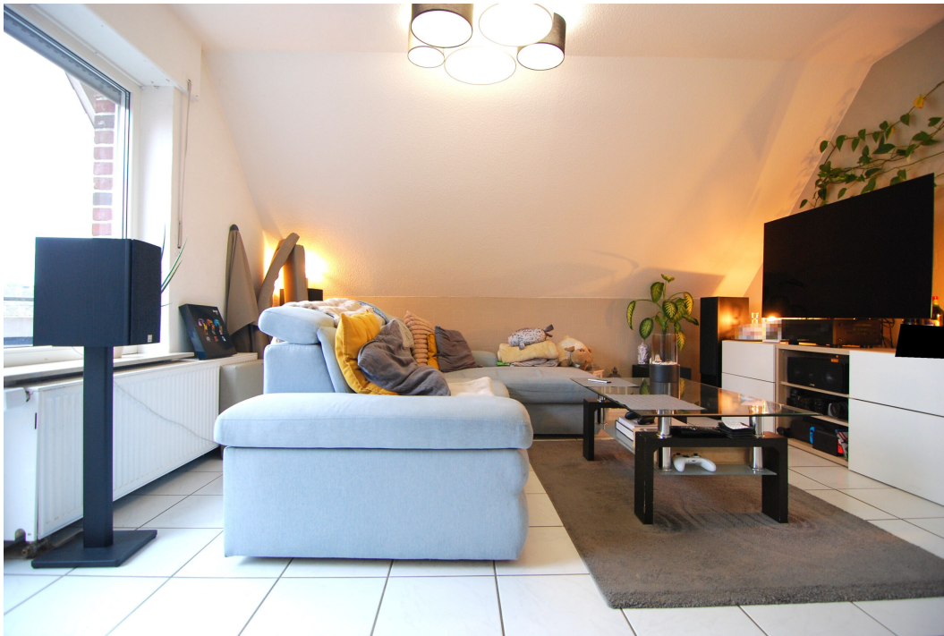
ImEnnewaelken23 DGre Wohnzimmer 3