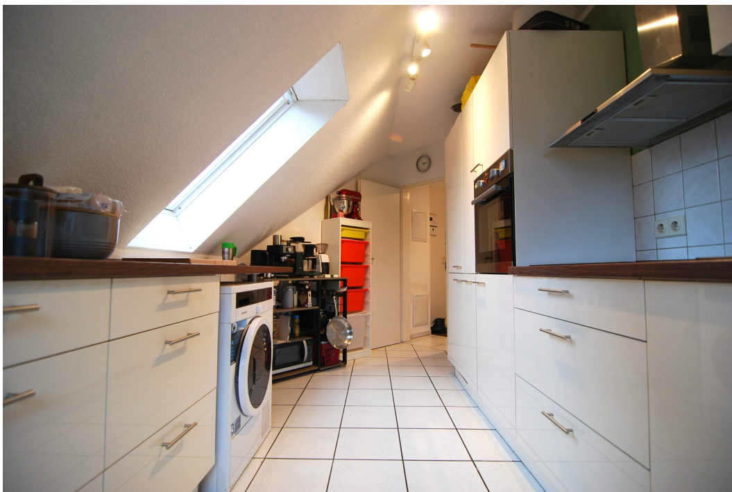
ImEnnewaelken23 DGre Kueche 3