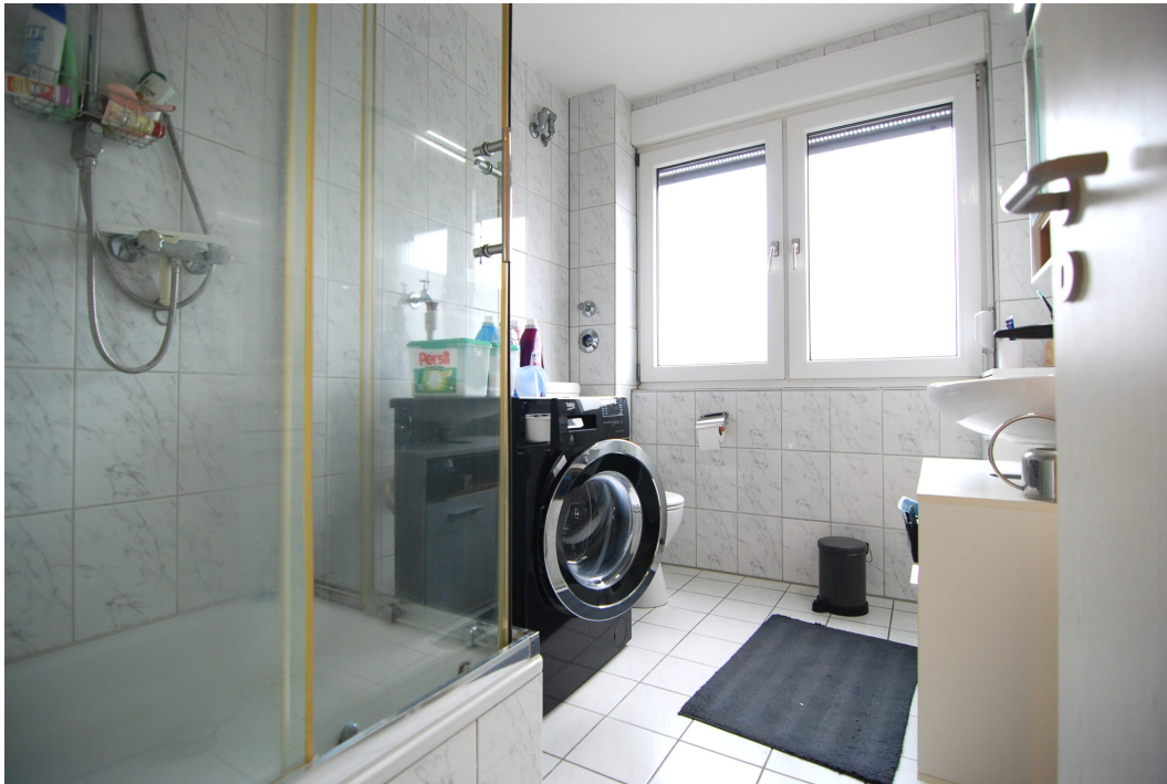
ImEnnewaelken23 DGre Bad 2