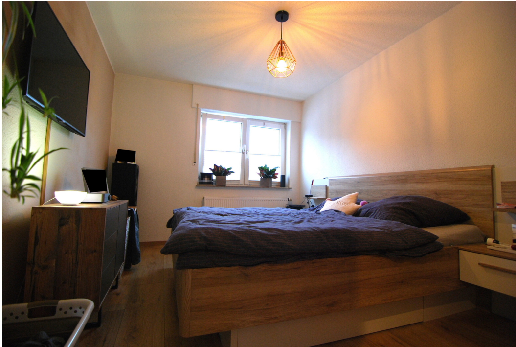
ImEnnewaelken23 DGre Schlafzimmer 1