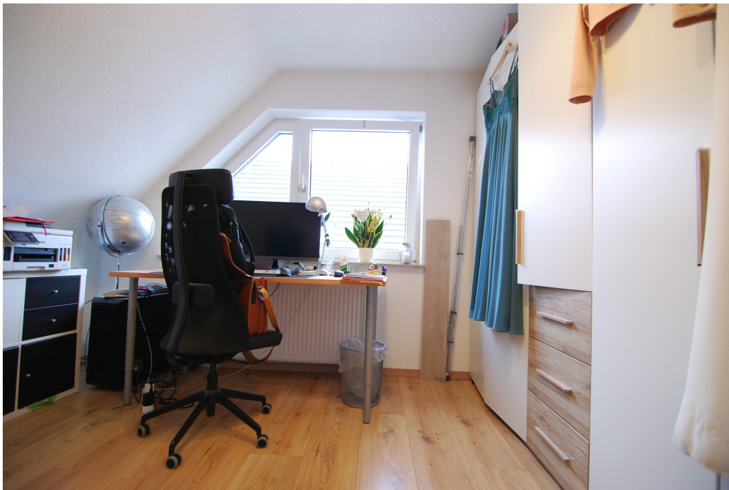
ImEnnewaelken23 DGre Kinderzimmer 2