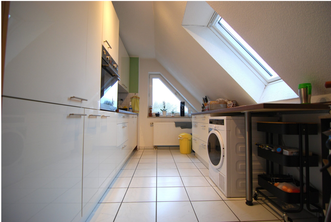
ImEnnewaelken23 DGre Kueche 2