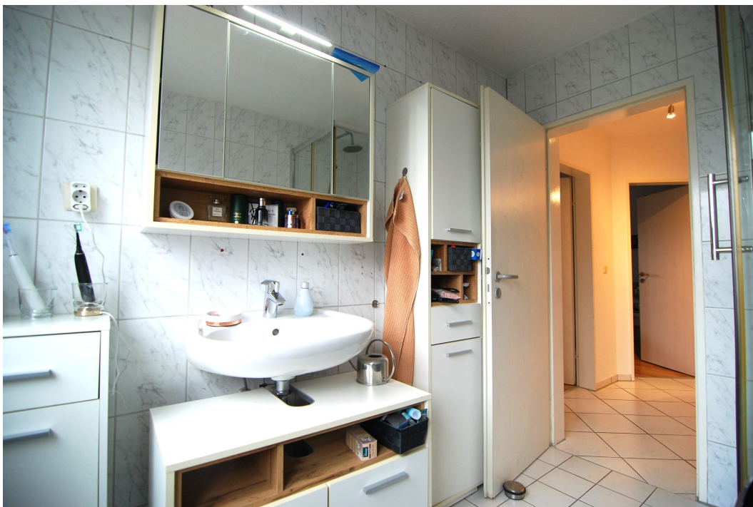
ImEnnewaelken23 DGre Bad 4