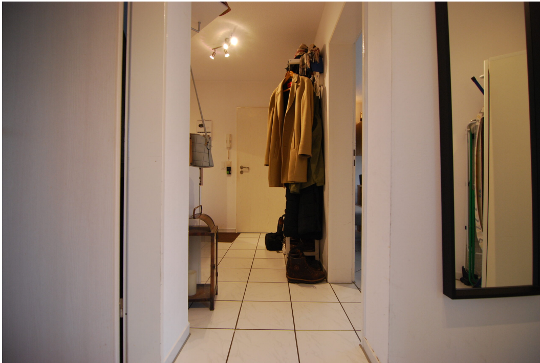
ImEnnewaelken23 DGre Flur 3