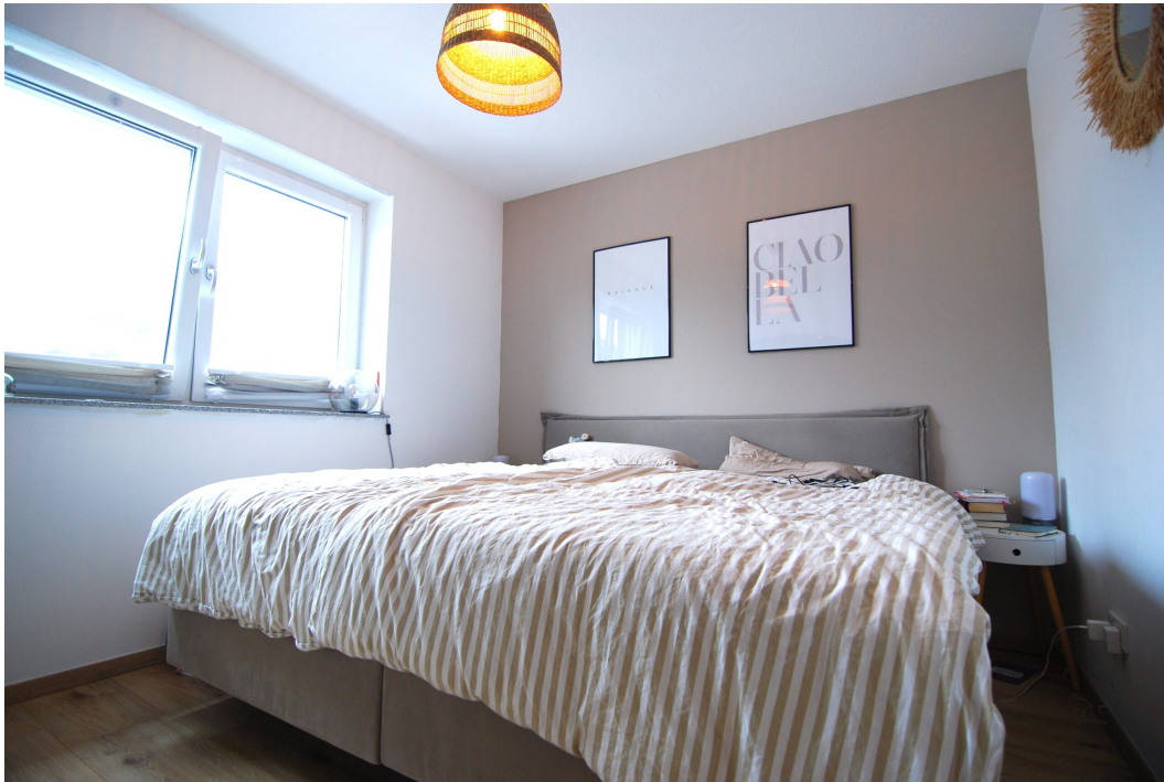
Perlsteinring47 EGlücks Schlafzimmer 2