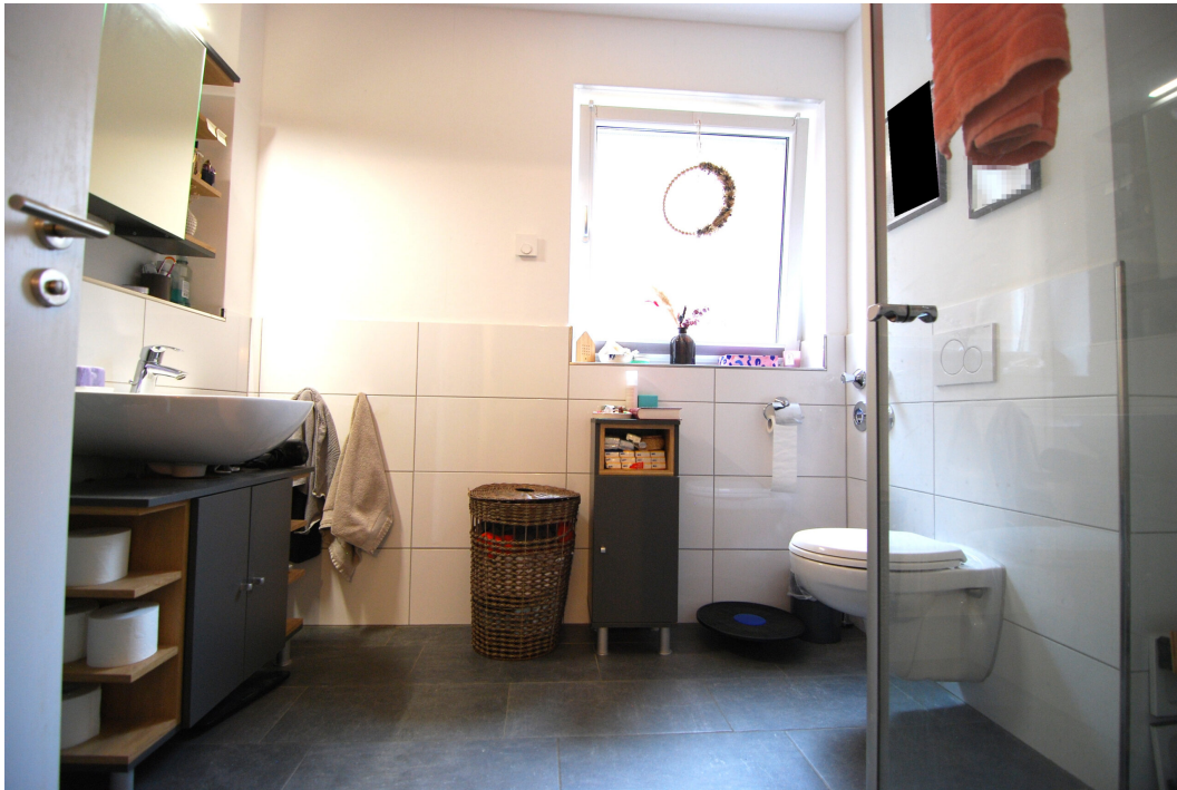
Perlsteinring47 EGlücks Bad 1