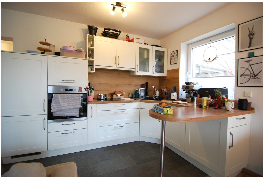
Perlsteinring47 EGlücks Küche 1