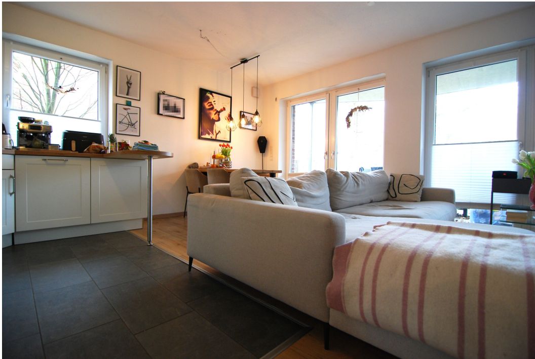
Perlsteinring47 EGlücks Wohnzimmer 2