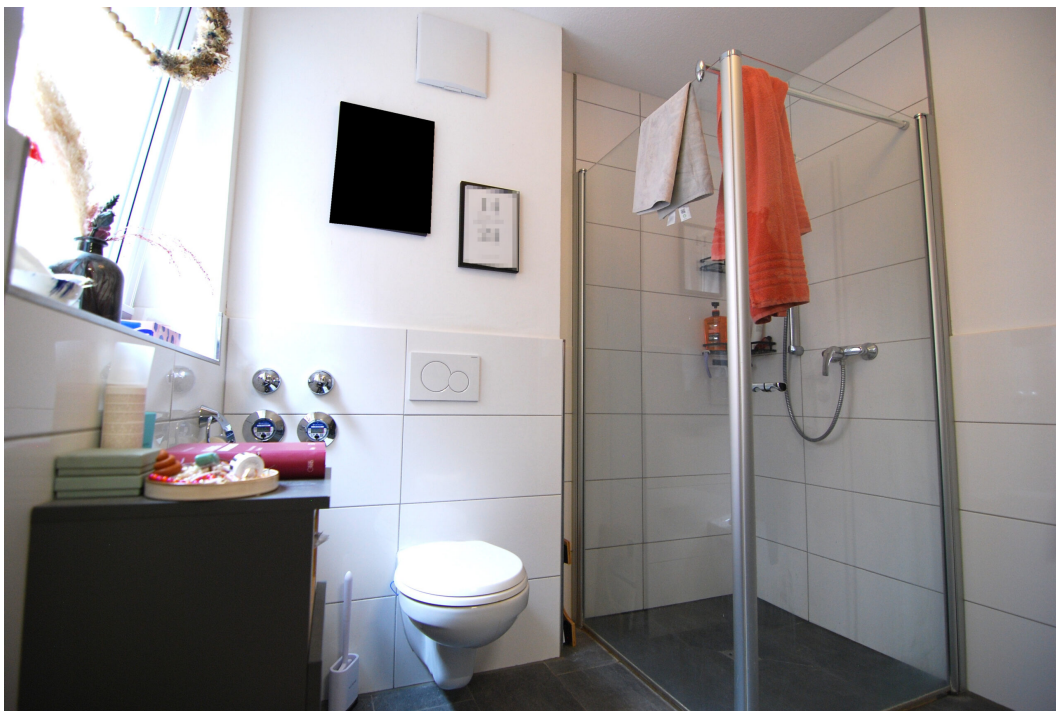
Perlsteinring47 EGlücks Bad 5