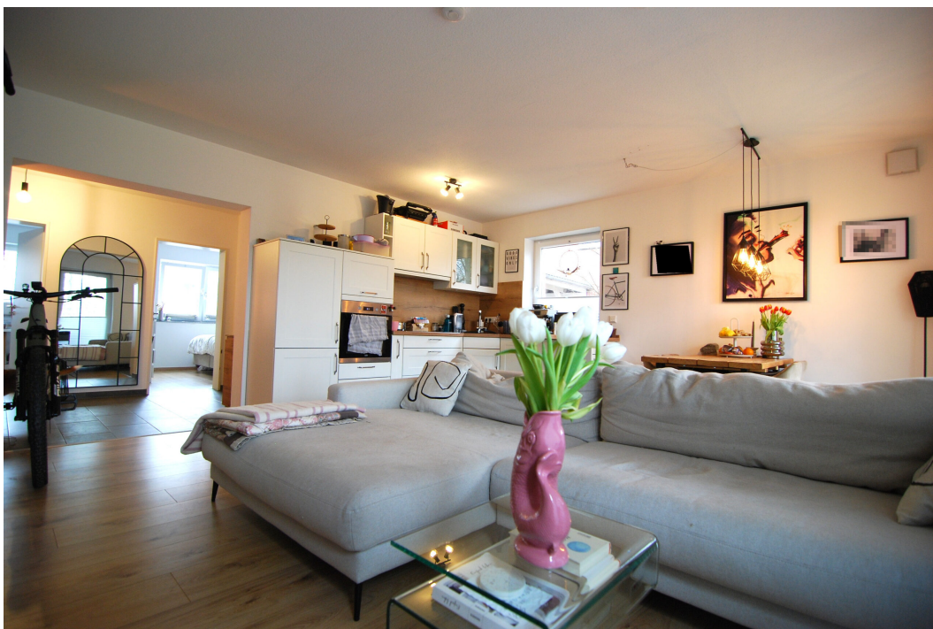
Perlsteinring47 ELinks Wohnzimmer 6