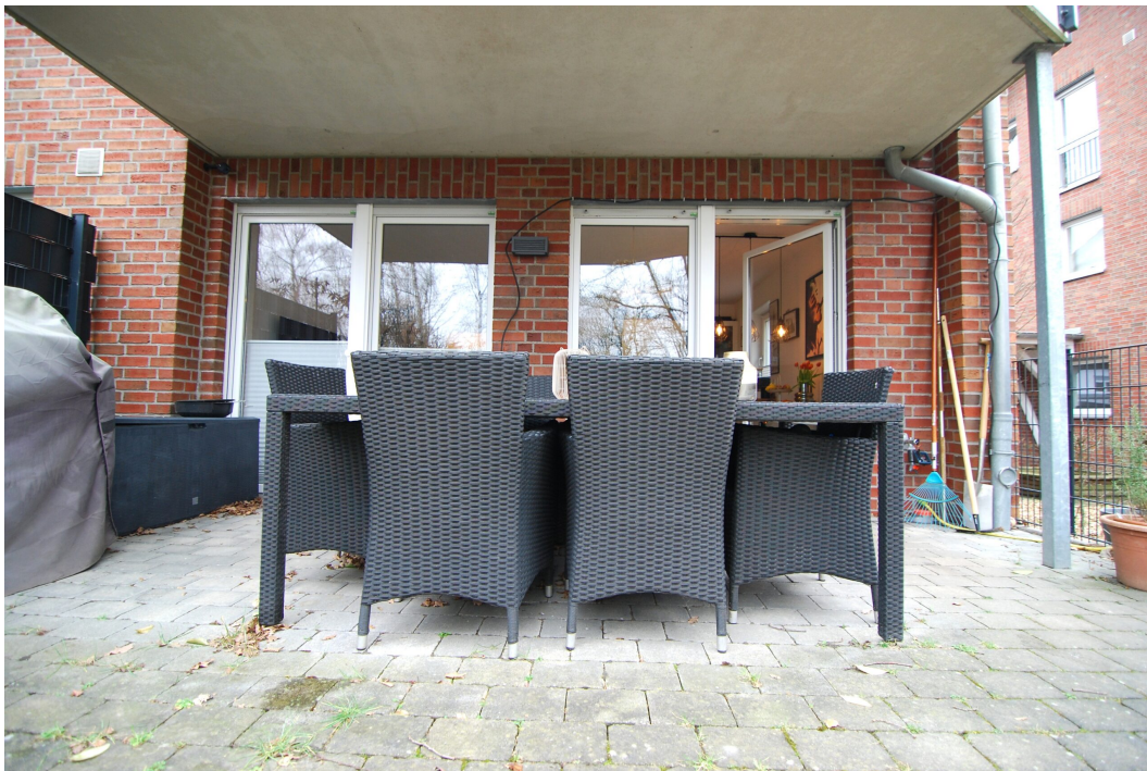
Perlsteinring47 EGlücks Terrasse 1