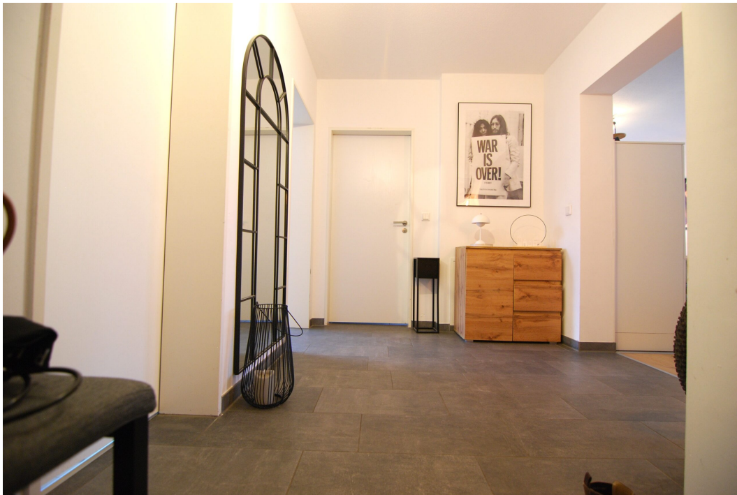
Perlsteinring47 ELinks Flur 2