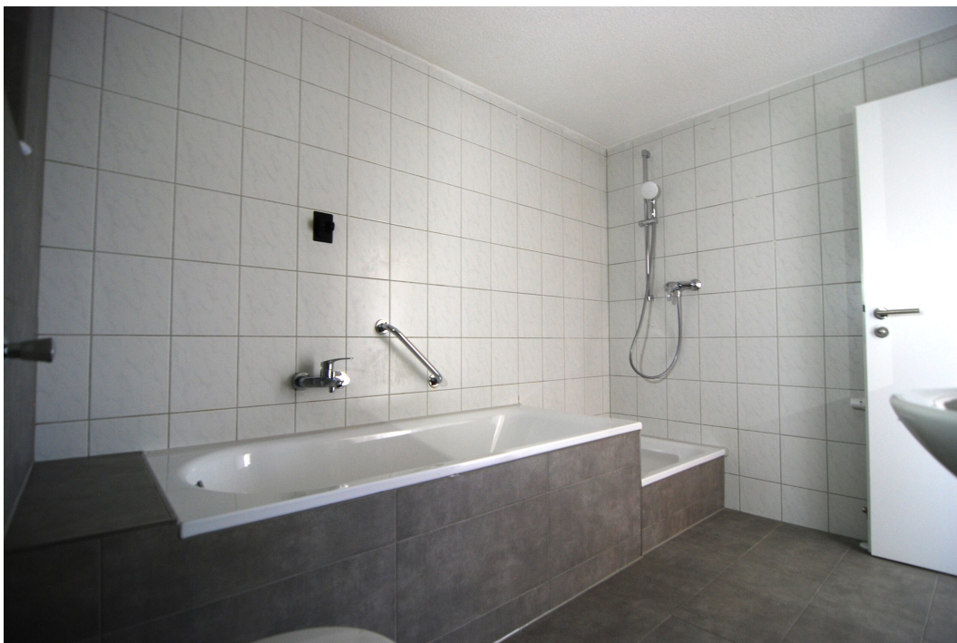
ClemensAugustStr57 Bad 4