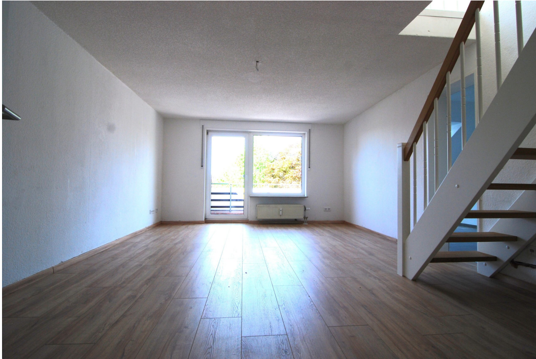
ClemensAugustStr57 Wohnzimmer 1