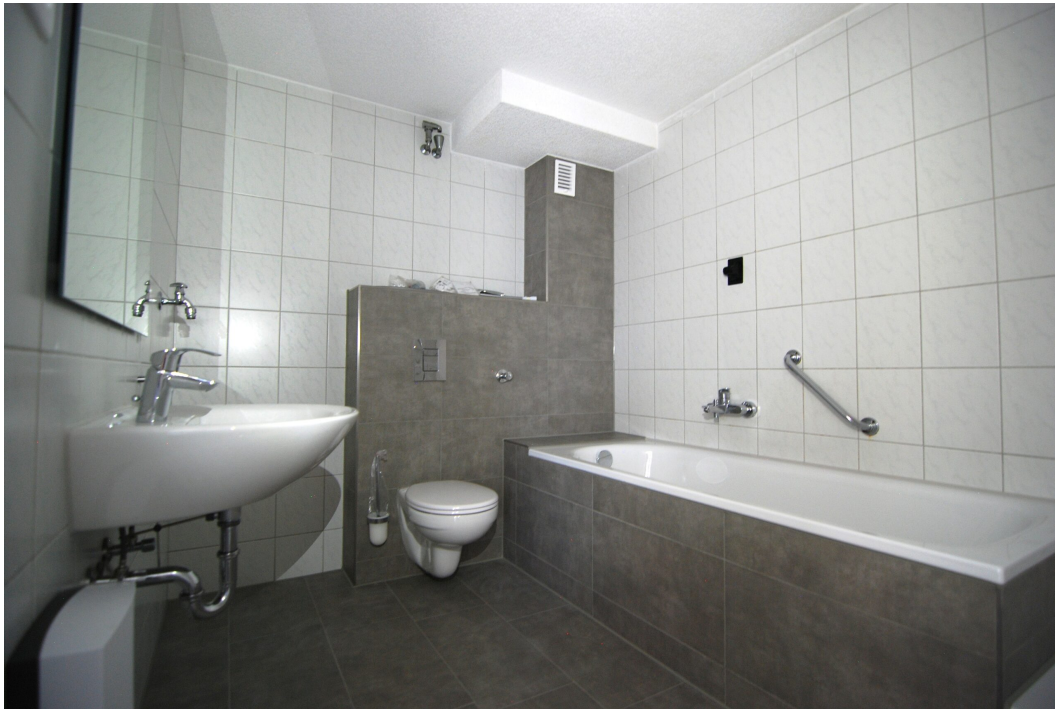
ClemensAugustStr57 Bad 1