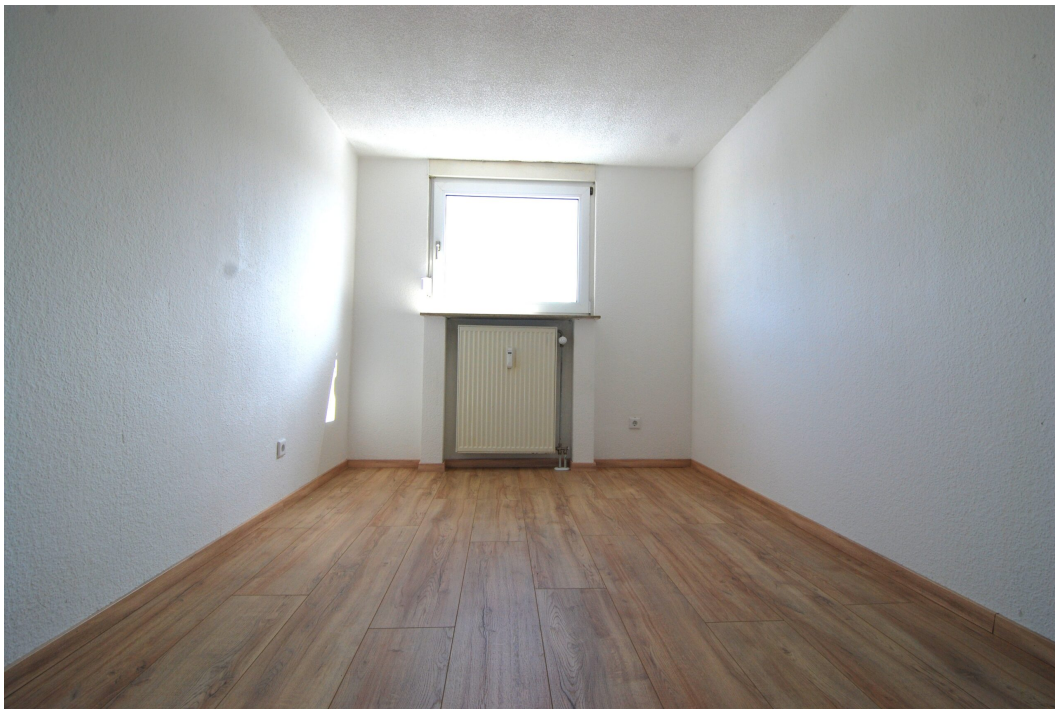
ClemensAugustStr57 Kinderzimmer 1