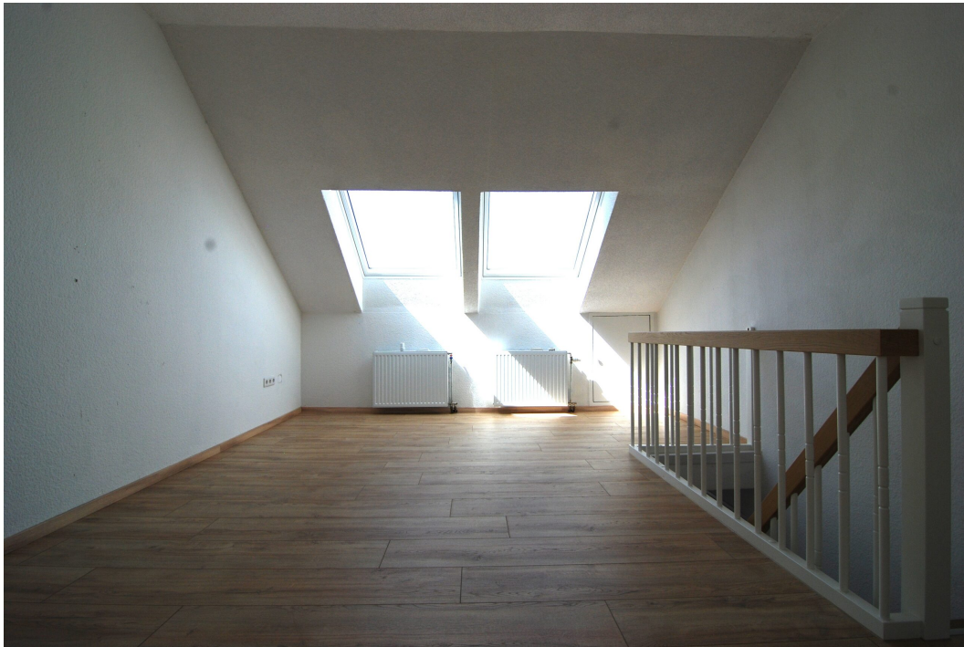
ClemensAugustStr57 Studio 1