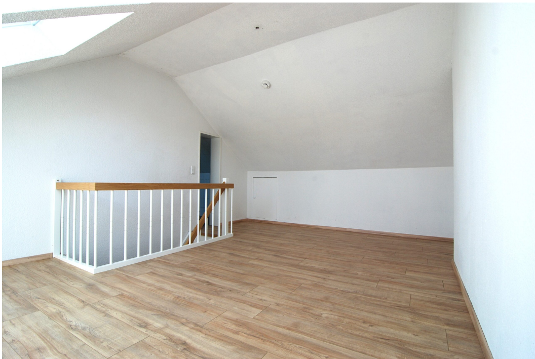
ClemensAugustStr57 Studio 3