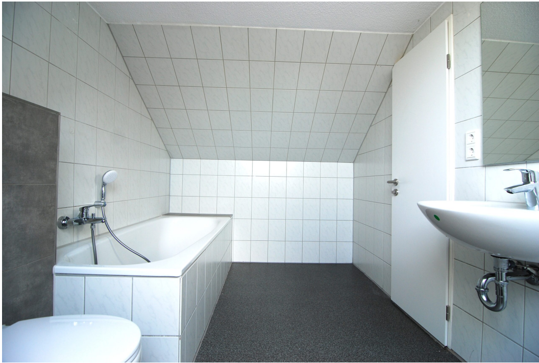
ClemensAugustStr57 Bad Studio 2