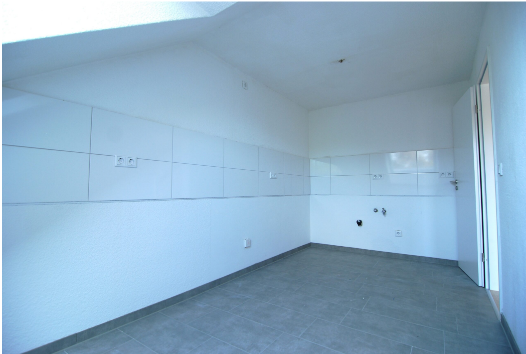
ClemensAugustStr57 Kueche 2