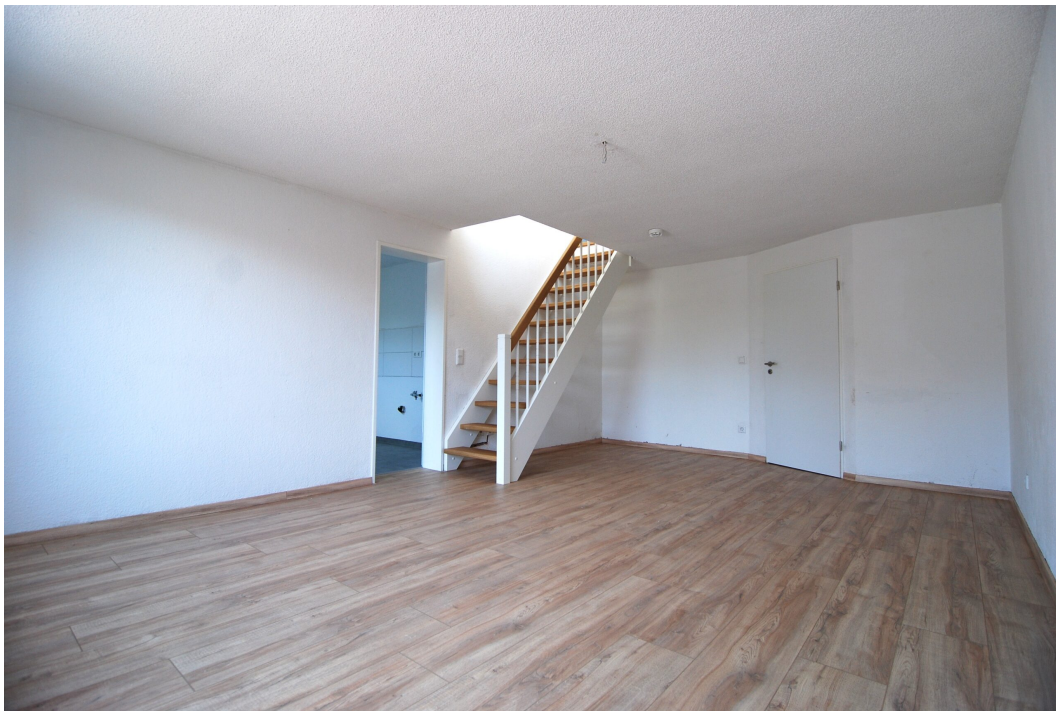
ClemensAugustStr57 Wohnzimmer 4