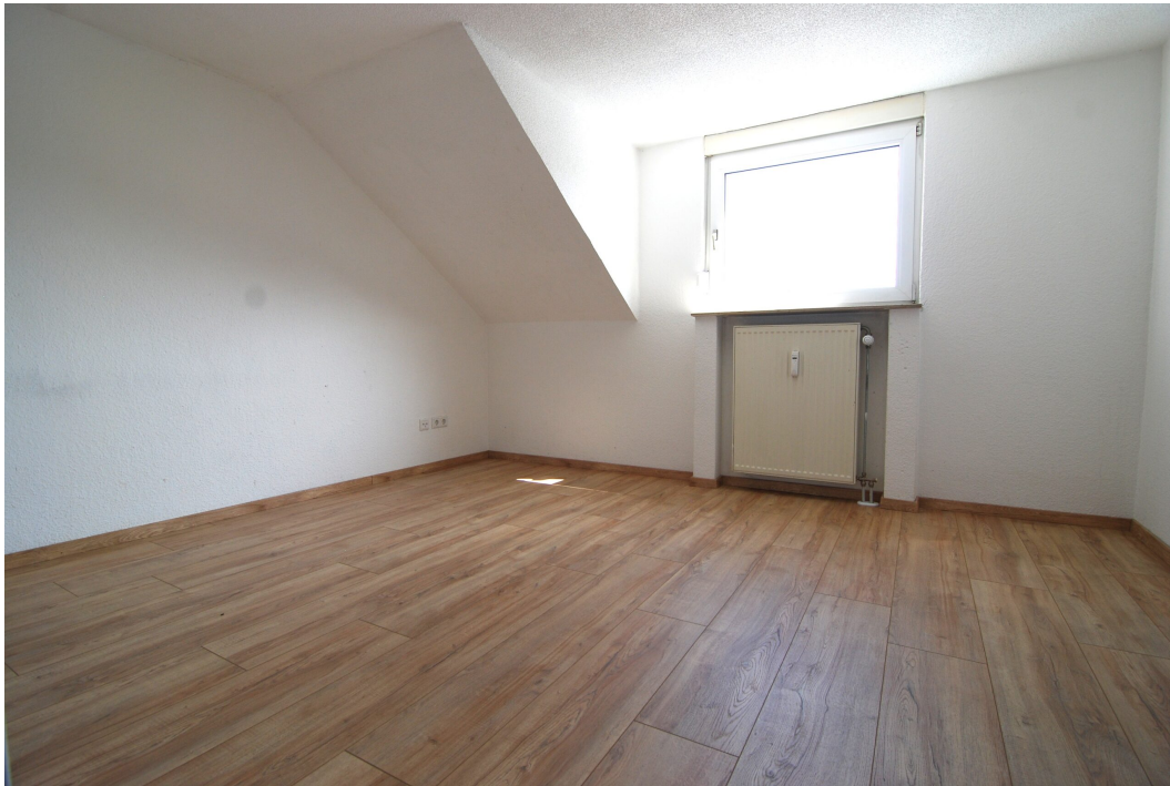
ClemensAugustStr57 Schlafzimmer 2