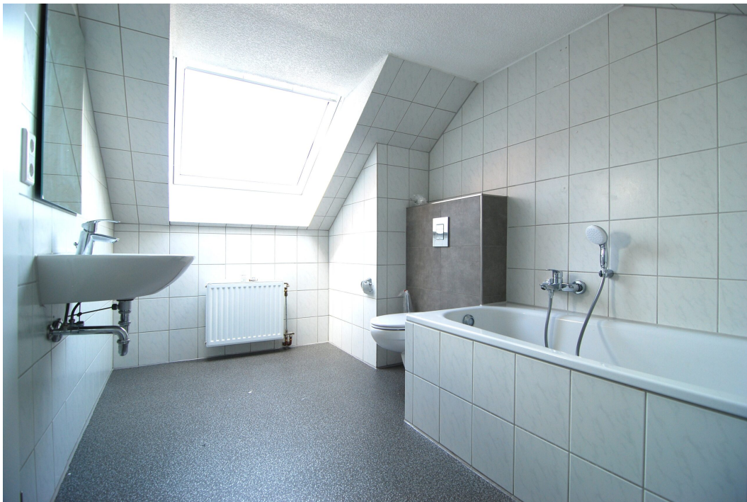
ClemensAugustStr57 Bad Studio 1