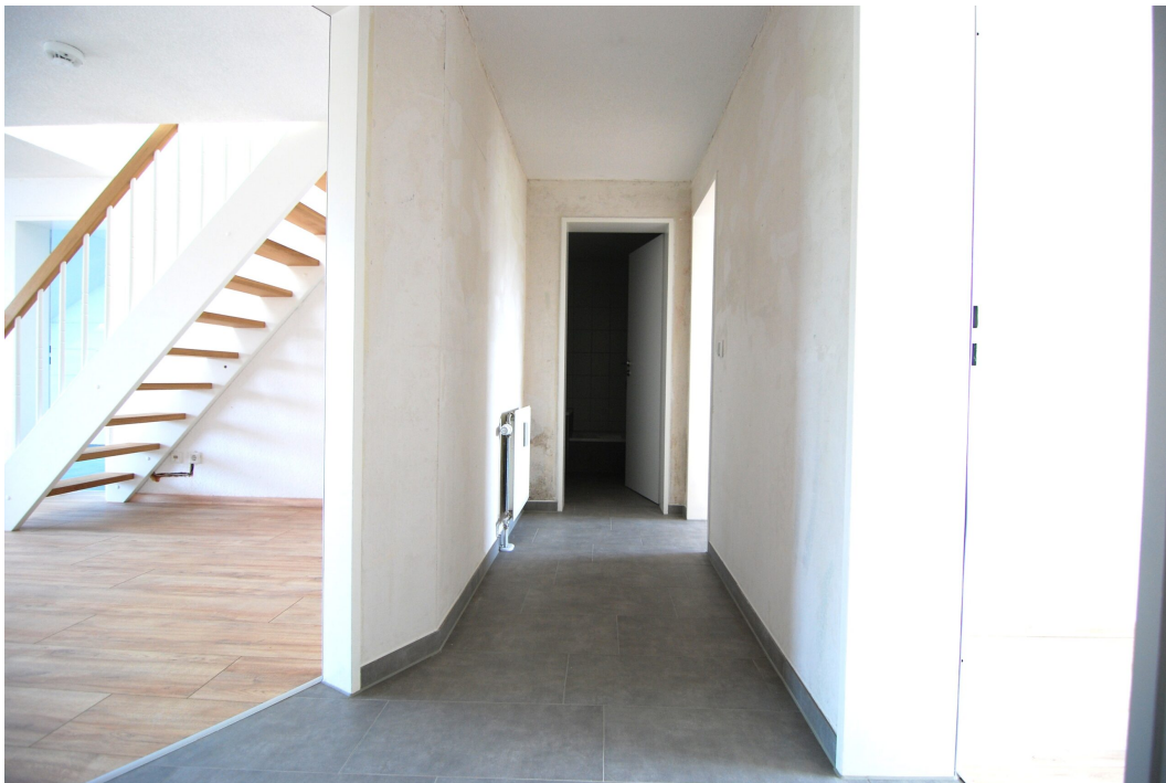
ClemensAugustStr57 Flur 1