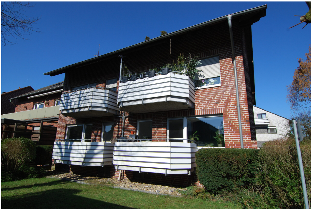
Falkenstrasse54 Gartenansicht 2