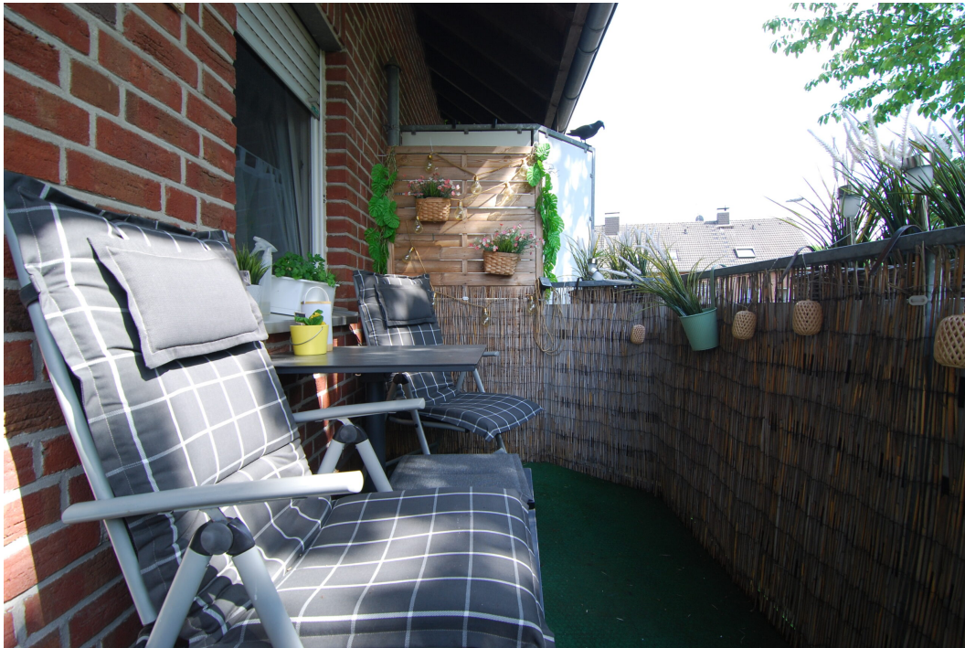
Falkenstrasse54 10Grechts Balkon 3