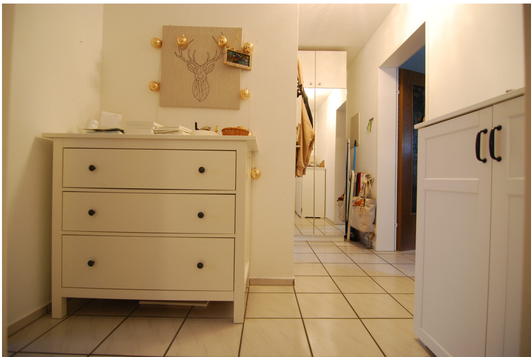
Falkenstrasse54 10Grechts Flur 2