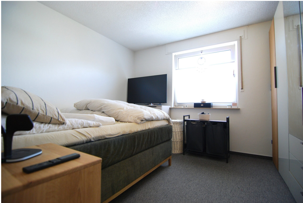
Falkenstrasse54 10Grechts Schlafzimmer 2