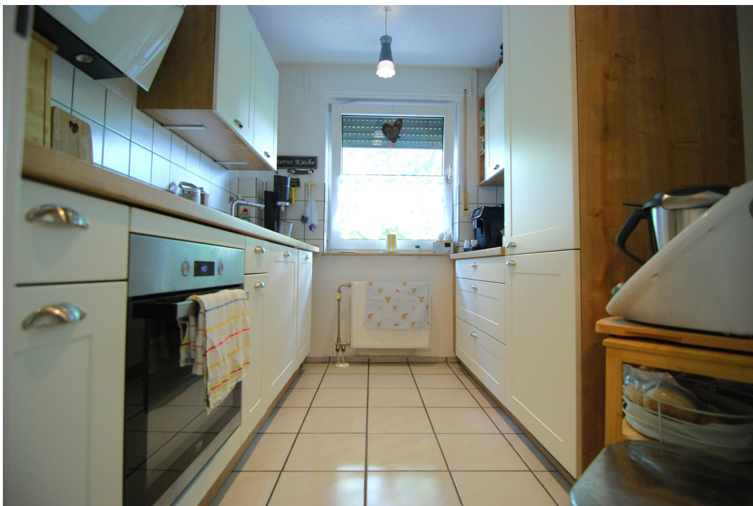
Falkenstrasse54 10Grechts Kueche 1