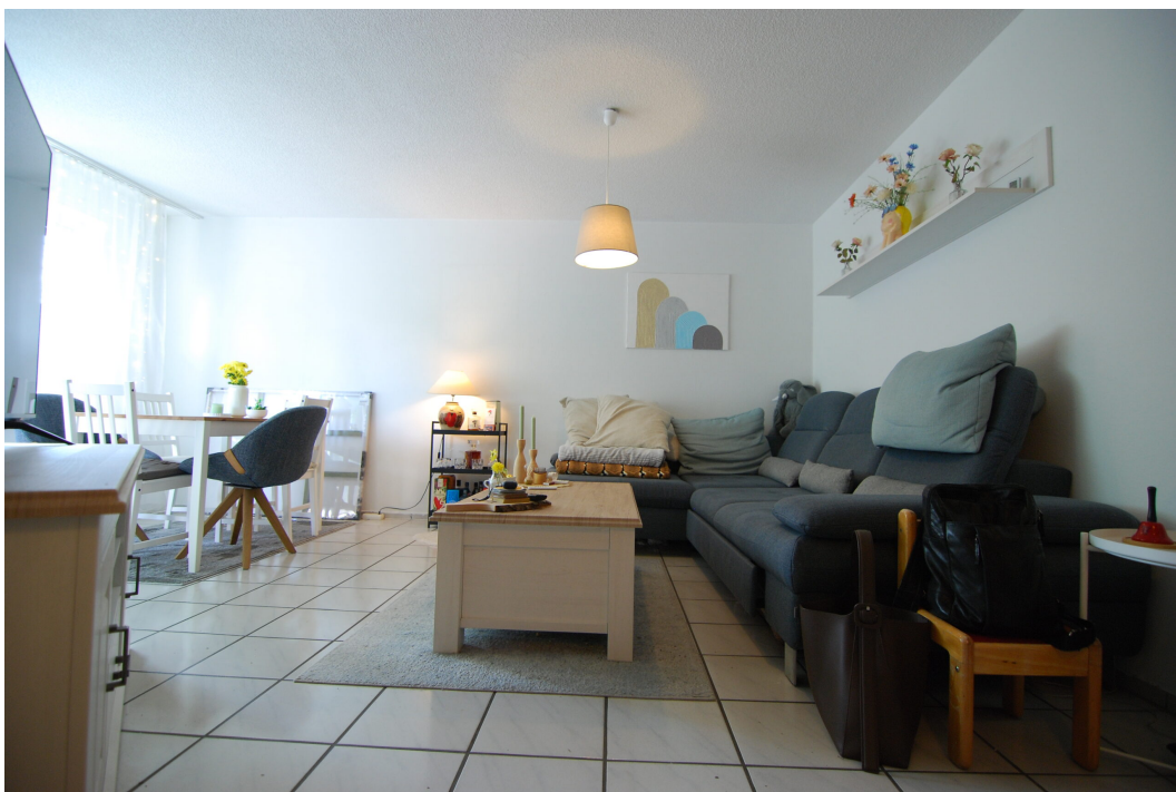
Falkenstrasse54 10Grechts Wohnzimmer 5