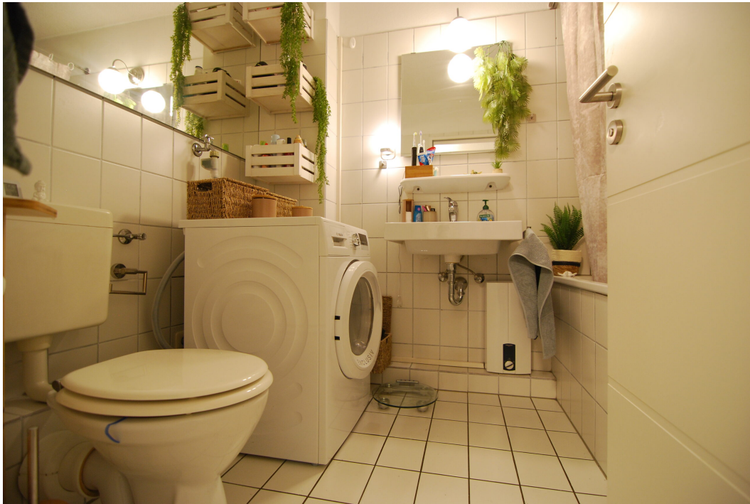
Falkenstrasse54 10Grechts Bad 1