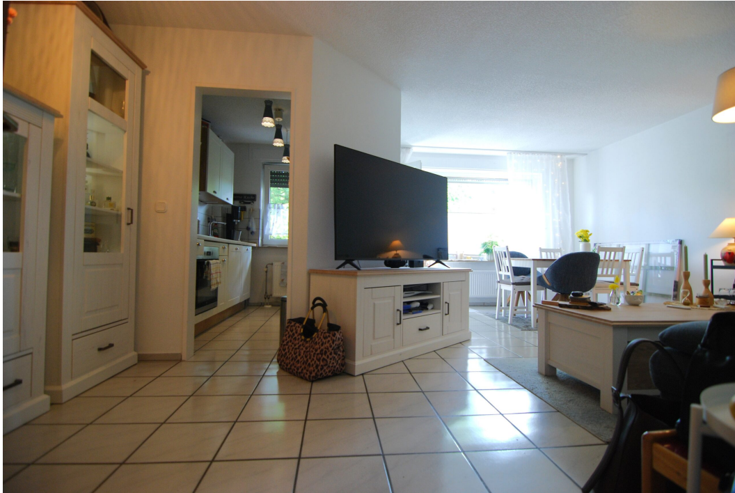
Falkenstrasse54 10Grechts Wohnzimmer 3