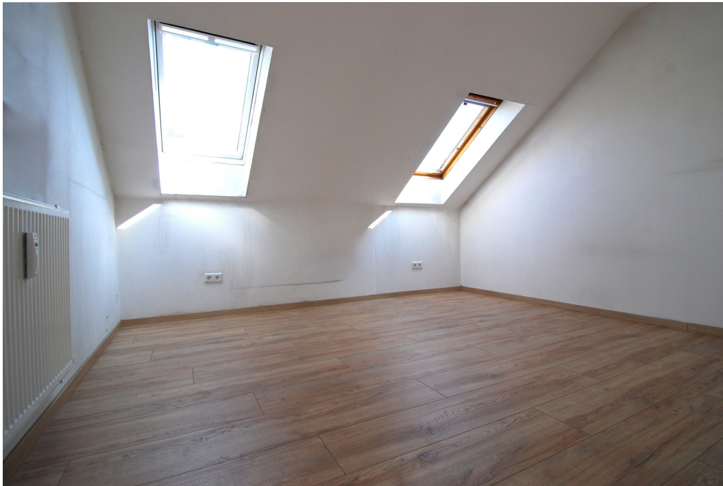
Freiheitsstr43 DGlinks Schlafzimmer 2