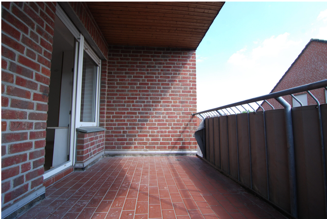
Freiheitsstr43 DGLinks Balkon 2