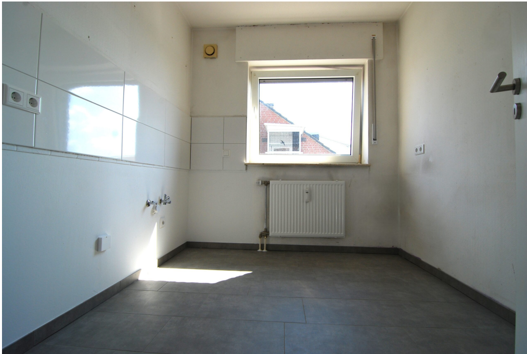
Freiheitsstr43 DGLinks Kueche 1