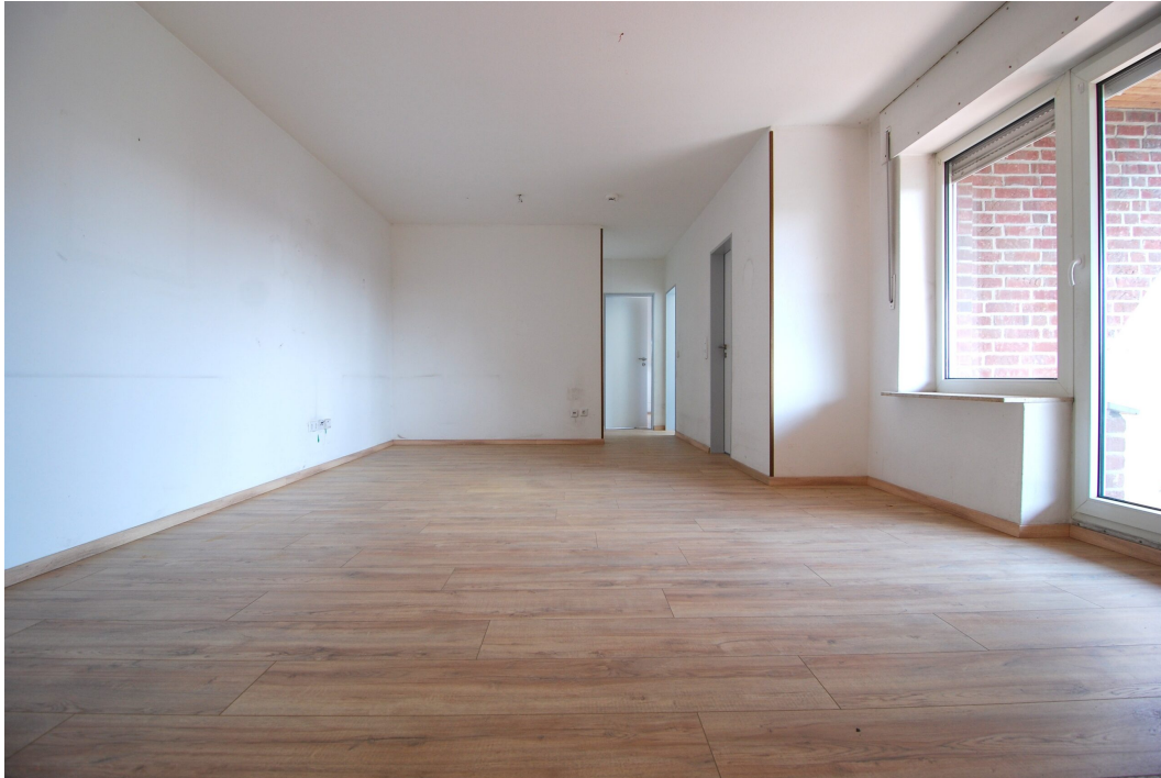
Freiheitsstr43 DGlinks Wohnzimmer 4