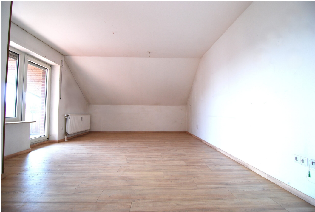
Freiheitsstr43 DGlinks Wohnzimmer 1