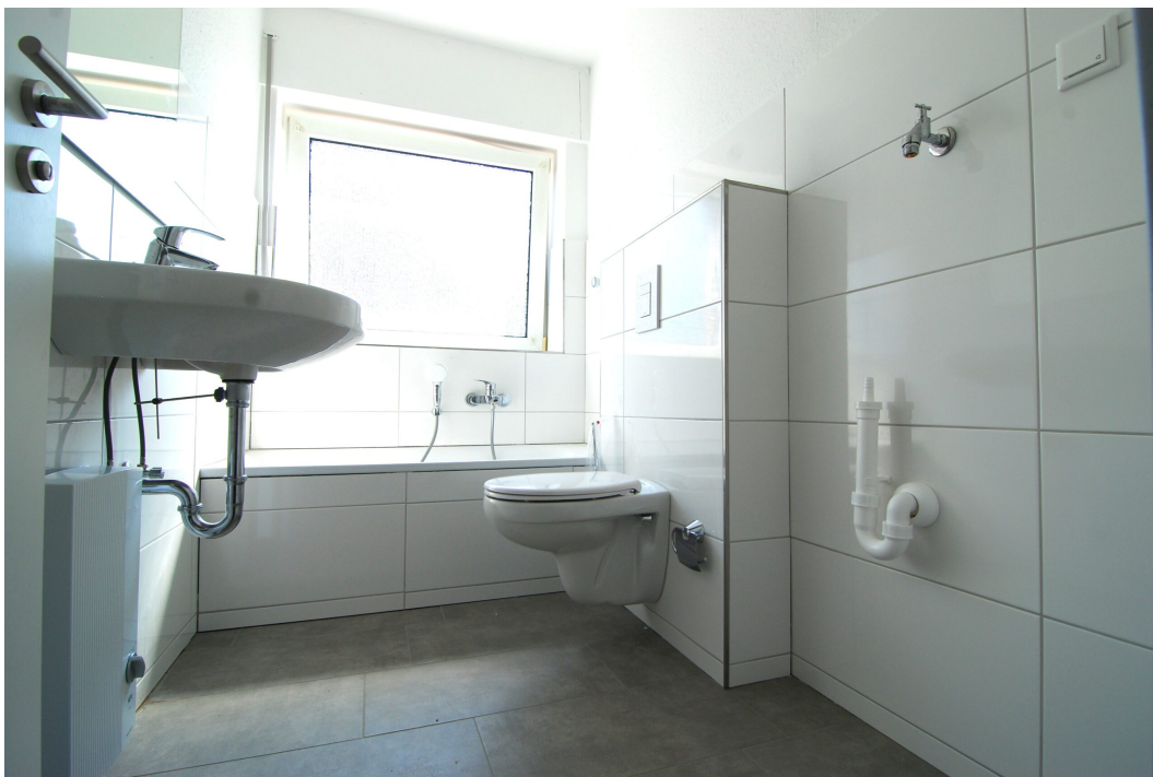
Freiheitsstr43 DGlinks Bad 1