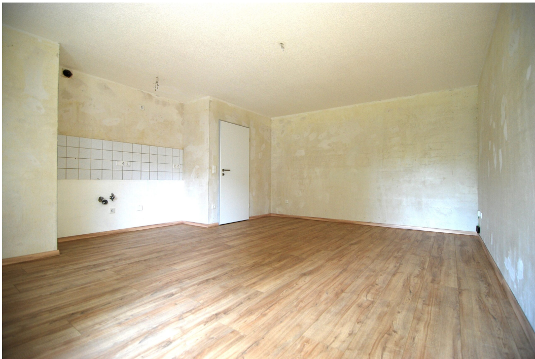
Waldstr2a 1OMitte links Wohnzimmer 6