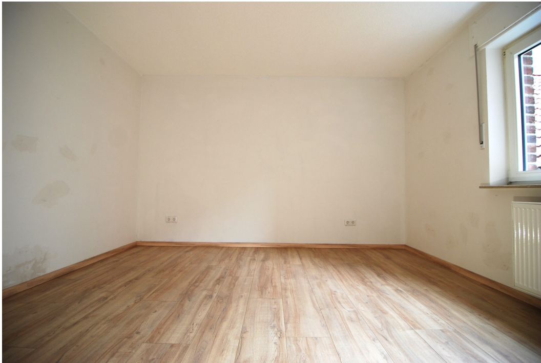
Waldstr2a 1OMitte links Schlafzimmer 2