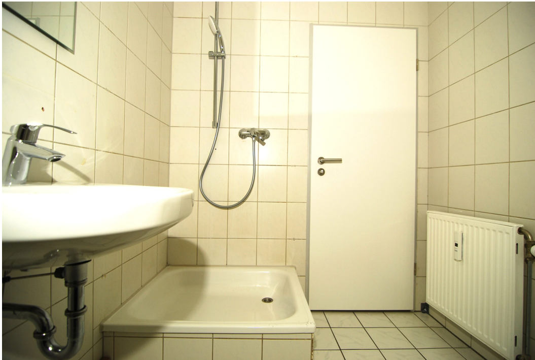
Waldstr2a 1OMitte links Bad 3