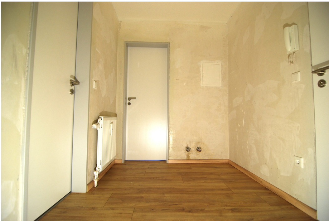
Waldstr2a 1OMitte links Flur 2