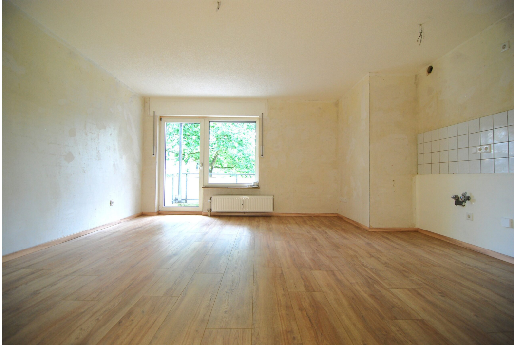
Waldstr2a 1OMitte links Wohnzimmer 1