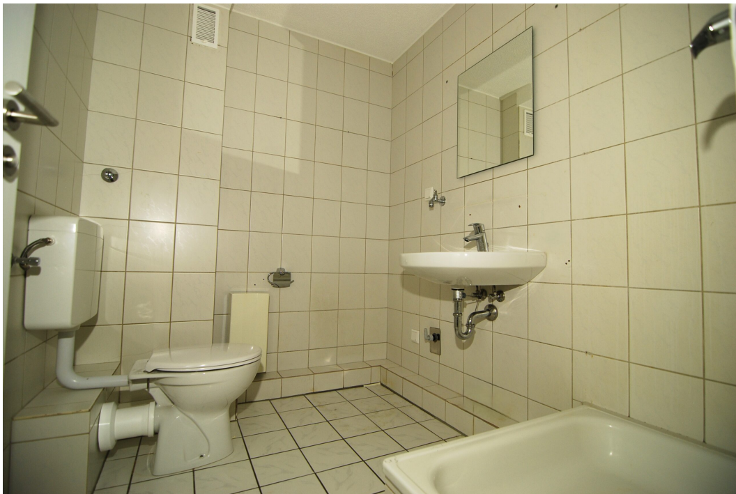
Waldstr2a 1OMitte links Bad 1