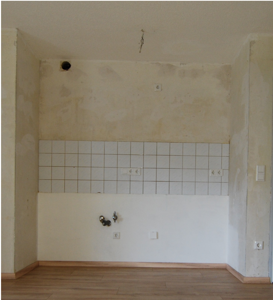
Waldstr2a 1OMitte links Küchennische 1