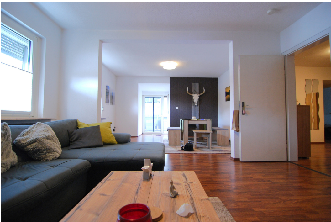
Barbarastrasse16 1OG Wohnzimmer 1