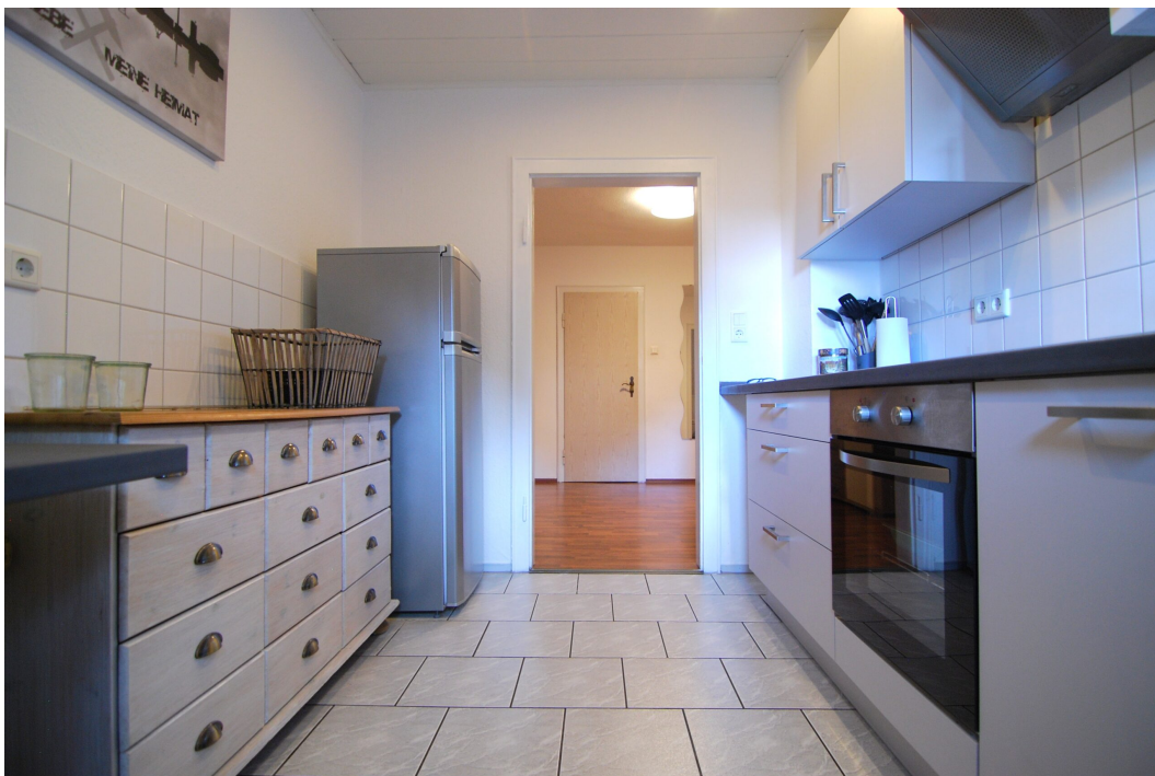
Barbarastrasse16 1OG Kueche 4