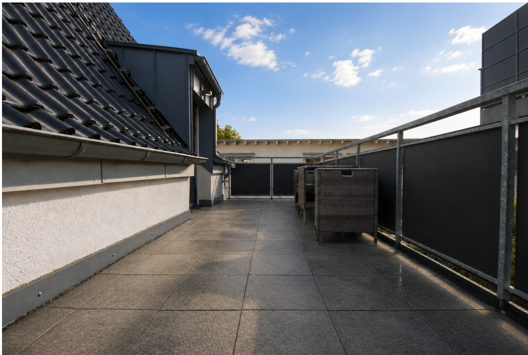
Barbarastrasse16 1OG Balkon 5