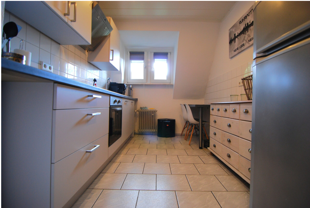
Barbarastrasse16 1OG Kueche 1