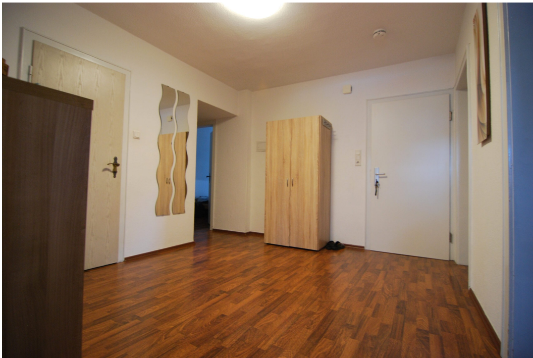
Barbarastrasse16 1OG Flur 2