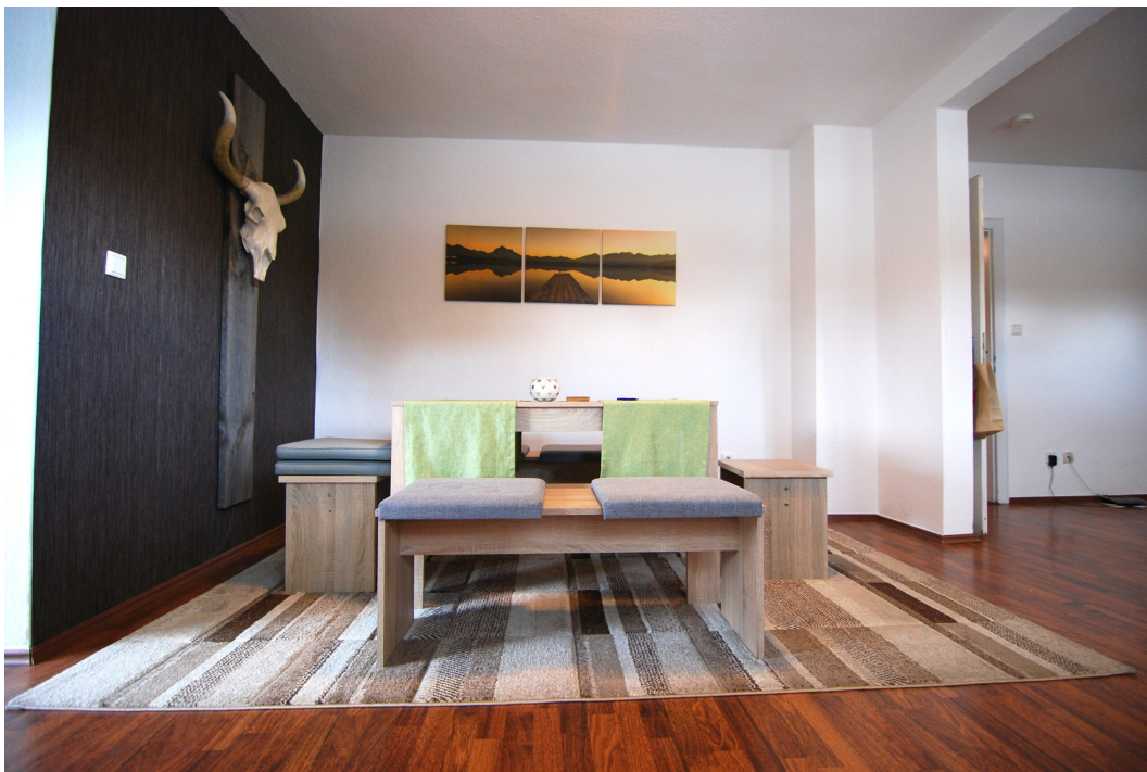
Barbarastrasse16 1OG Esszimmer 1