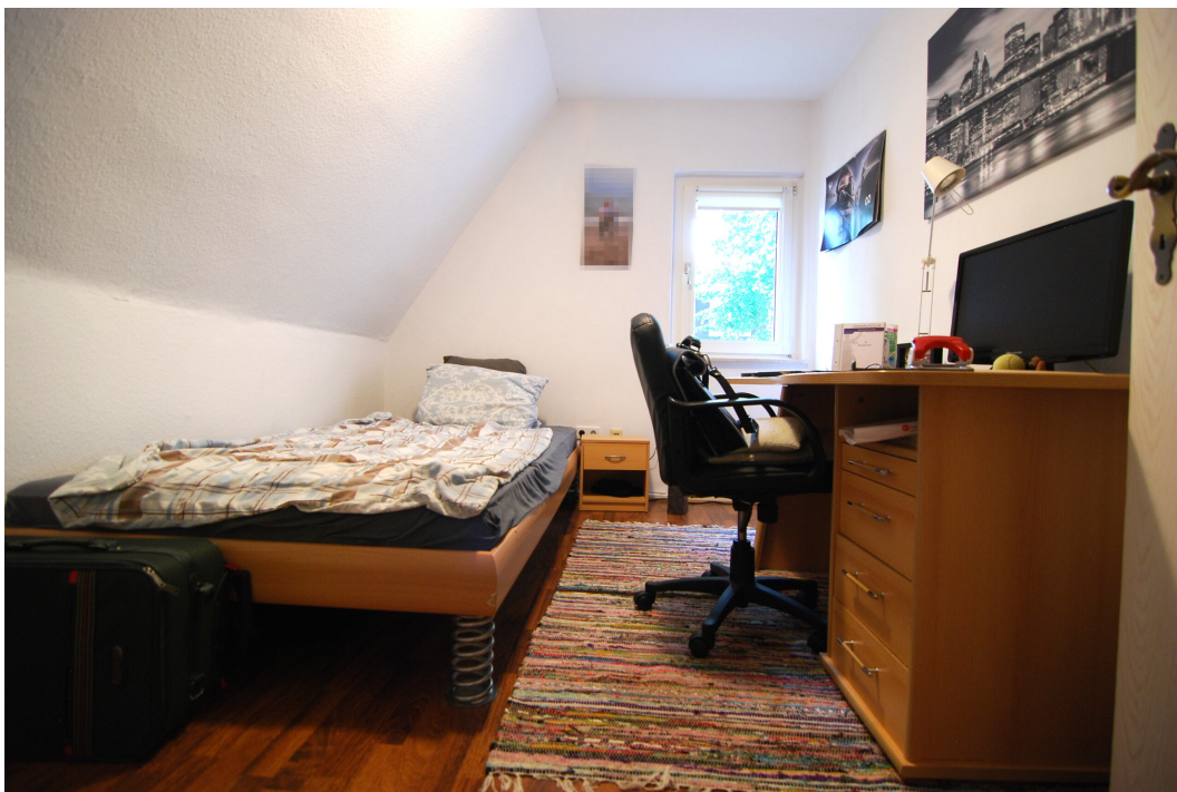
Barbarastrasse16 1OG Kinderzimmer 1