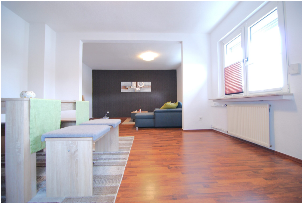
Barbarastrasse16 1OG Wohnzimmer 2