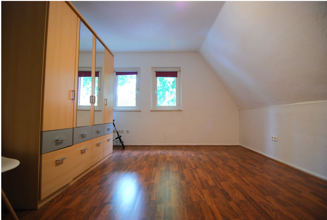
Barbarastrasse16 1OG Schlafzimmer 1