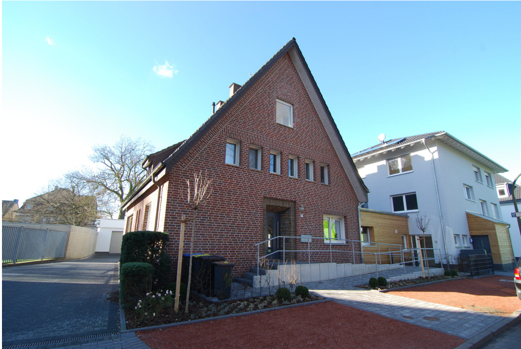
Barbarastr14A+16 280114 Bild