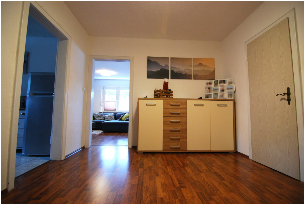
Barbarastrasse16 1OG Flur 1