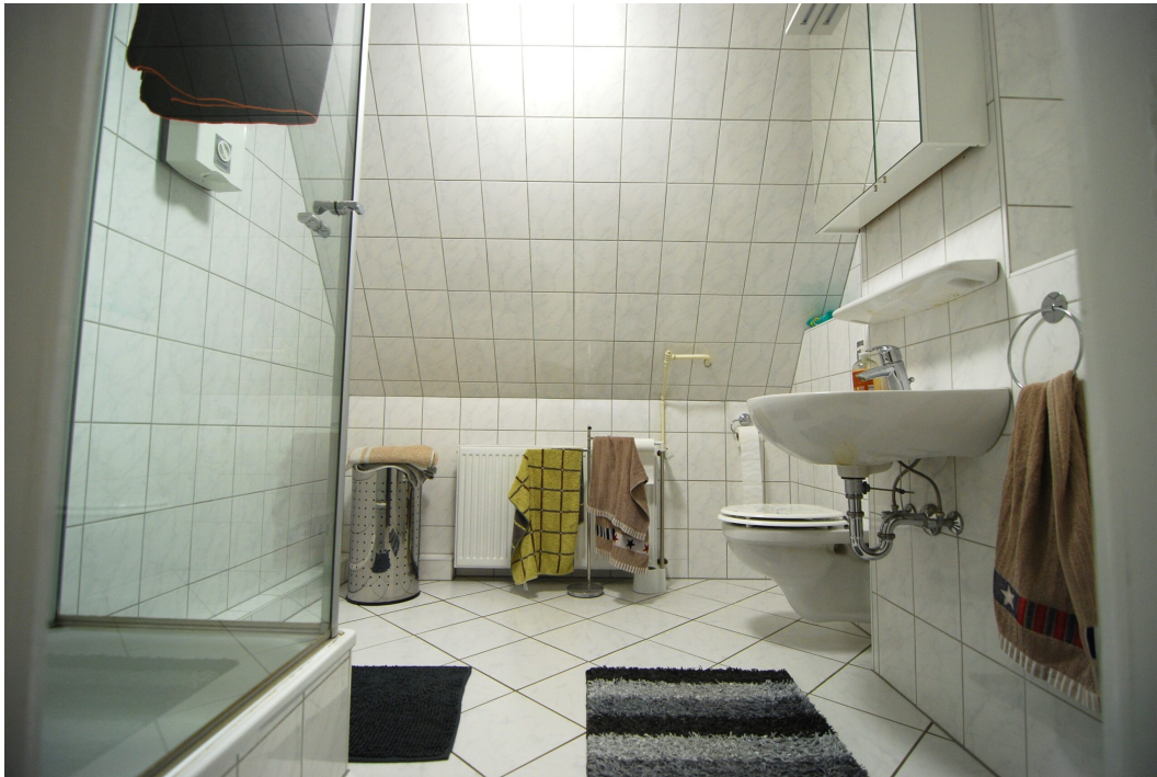
Barbarastrasse16 1OG Bad 1